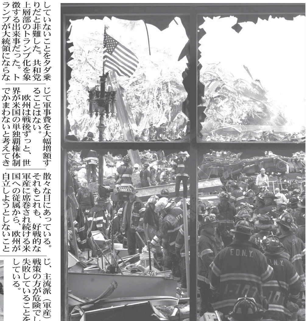
アメリカを変えた9 11同時多発テロ

米覇権を求めるとの思惑。米政界の「トランプ」化の一方、同盟国に敵しい注目を浴びることだ。たとえ「トランプ」が大統領にならなくても、米政界の主流派は、トランプに対して脅威を感じている。その分、トランプへの敵視が強くなる。だがその一方で、トランプの主張は、政治家が有権者に対して人気取りをする際に便利なので、米政界では最近、トランプに似た主張をする議員が増えている。