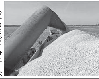
伯国のトウモロコシ畑の風景

記録的な豊作にもかかわらず、アメリカのトウモロコシ市場では、家畜用の飼料の重要な原料としての需要から輸入が増加している。 今期の輸入量は56%増とも