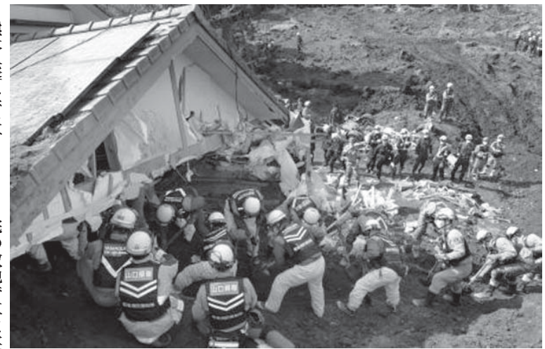
行方不明者の捜索が続く熊本県南阿蘇村の土砂崩れ現場=19日午後3時16分

【共同】熊本、大分両県で相次ぐ地震で、熊本市消防局は19日、避難のため自動車内で「車中泊」していた同市の女性(51)がエコノミクス症候群で死亡していたと明らかにした。今回の地震で、同症候群による死者が明らかになったのは初めて。熊本市の集計によると、避難所で生活する被災者は10万人規模で推移。行政は車中泊の全容を把握しておらず、対策が急務だ。