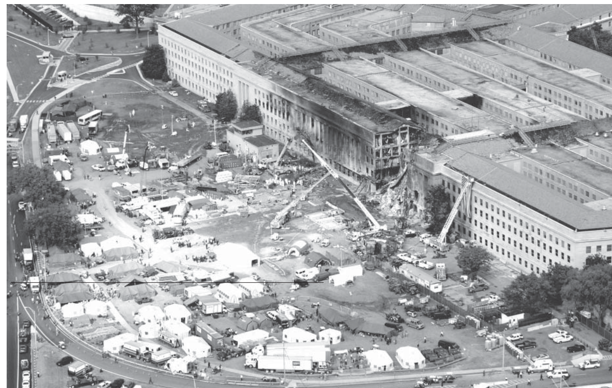
9 11同時多発テロで攻撃を受けたアメリカ国防総省(ペンタゴン、Foto: Cedric H. Rudisill/ DOD)

米覇権を求めるとの思惑。米政界の「トランプ」化の一方、同盟国に敵しい注目を浴びることだ。たとえ「トランプ」が大統領にならなくても、米政界の主流派は、トランプに対して脅威を感じている。その分、トランプへの敵視が強くなる。だがその一方で、トランプの主張は、政治家が有権者に対して人気取りをする際に便利なので、米政界では最近、トランプに似た主張をする議員が増えている。