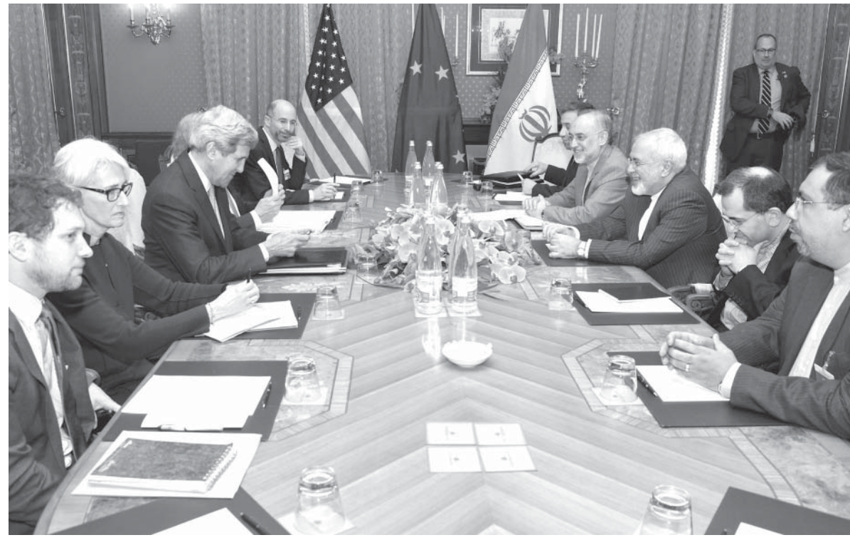
2015年3月20日、スイスで。イラン代表と核問題について話し合うケリー-米務長官(左、Foto: Glen Johnson/ State Department Photo)

米政界の「トランプ」化の一方、同盟国に敵しい注目を浴びることだ。たとえ「トランプ」が大統領にならなくても、米政界の主流派は、トランプに対して脅威を感じている。その分、トランプへの敵視が強くなる。だがその一方で、トランプの主張は、政治家が有権者に対して人気取りをする際に便利なので、米政界では最近、トランプに似た主張をする議員が増えている。