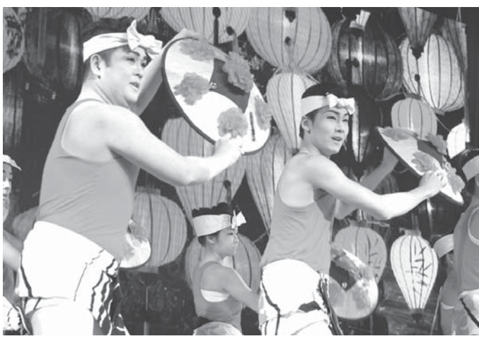
前回公演の様子。民謡や太鼓、舞踊など盛り沢山のプログラムだった

若手日系人グループの「エン・ラツソス」(En-Rassos)による公演「縁・友情の絆」が、30日午後7時から聖市東洋街のFECAP劇場(TV Liberdade)で開催される。民謡のグルッポ民や琉球国歌祭太鼓などが、先祖に感謝の気持ちを伝える。エン・ラツソス代表(32、44歳)は「ブラジル音楽に和楽器を取り込むなど、日伯文化は融合の結晶である」とし、「それらを通じて祖先を受け