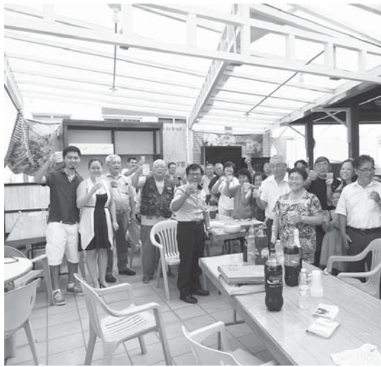
アルゼンチナ丸同船者会の様子