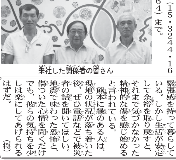
来社した関係者の皆さん

からアメリカやブラジルへ伝わっている現状を知ることができた。仏教の世界性を感じられる企画」と感想を語った。 具体的な支援方法として菅尾監督は、インターネットを通じて資金調達「クラウドファンディング」を紹介。「ブラジル仏教の素晴らしさを幅広く発信するためにも、ぜひ協力してほしい」と来場者に訴えた。 ネット上では6月中旬まで資金募集を行ない、平行して年末まで企業スポンサーを募る。寄付は専用サイト(www.kicikan.com.br/campanhas/documentario-tres-joias)から、予告映像