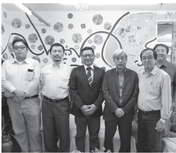
来社したプロジェクト推進団体関係者

「持続可能な森林農法普及による地域活性化を」。JICA草の根技術協力として東京農工大学が中心となり、2011年11月より開始された「日系遷移型アグロフォレストリー(SAFFA)普及認証計画」が5年間の無事に終了、18日に来社した一行はその成果や手ごたえをじっくりと語った。