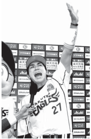
ロッテにサヨナラ勝ちを挙げた楽天の岡島