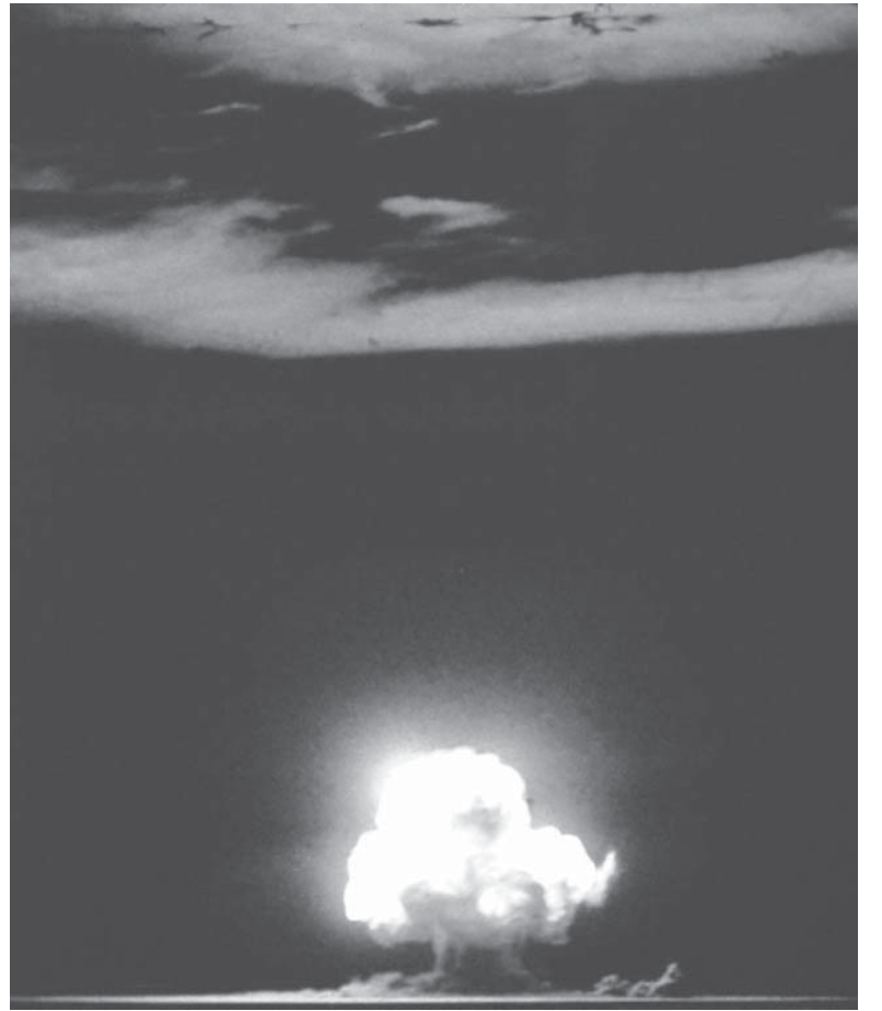
1945年7月16日に行われた人類初の核実験