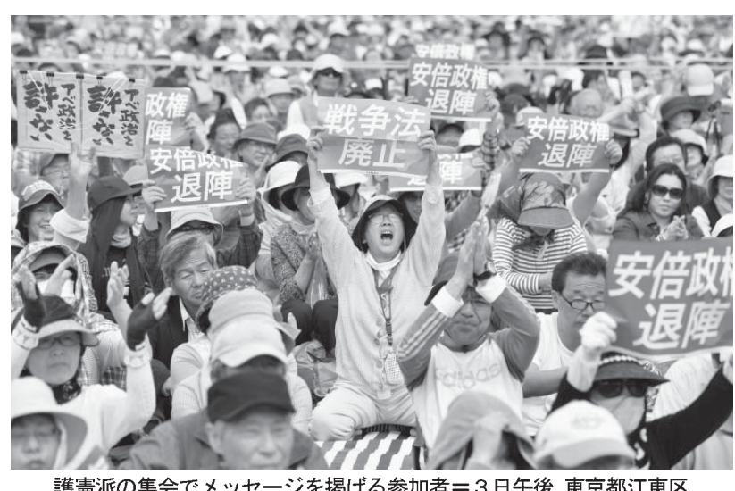
護憲派の集会でメッセージを掲げる参加者=3日午後、東京都江東区

【共同】日本国憲法が施行から69年となった憲法記念日の3日、各地でさまざまな集会が開かれた。護憲派は安倍政権が憲法を軽視しているとして「主権者は私たちだ」と声を上げ、改憲派は大災害時などに内閣に権力を集中させる「緊急事態条項」の創設を訴えた。安倍晋三首相が憲法改正への意欲を繰り返して表明する中、夏の参院選では、その是非が争点となりそうだ。公布から70年。安全保障関連法制定の過程で焦点となった「立憲主義」が改めて問われている。