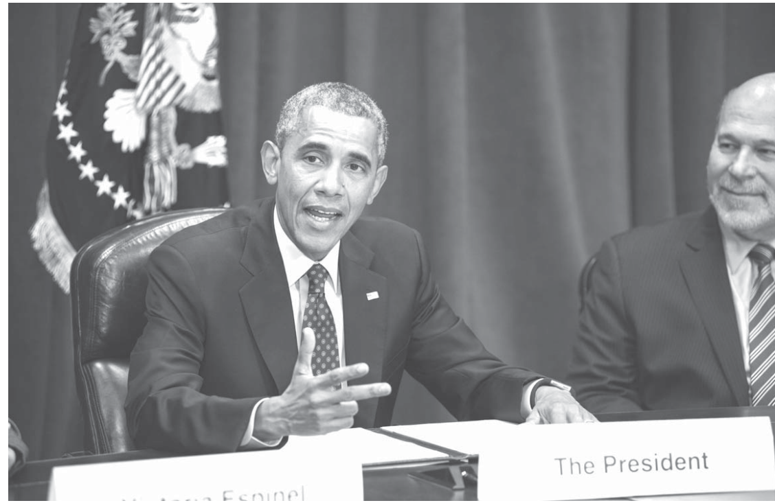
ワシントンのPTT閣連会議で発言するオバマ米大統領(15年10月6日)