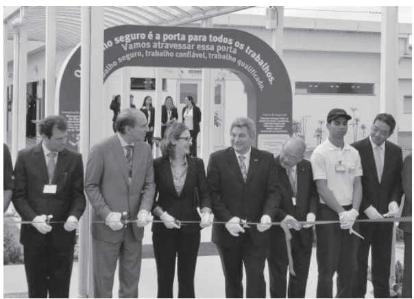
（上）新工場でのテープカットの様子。左端が本社の嵯峨専務。右端がアウキミン州知事。左端が本社の嵯峨専務。

同式典には、連邦政府・アウキミン聖州知事、レオナルド・マリア・ホドリゲス同市長、中前隆博総領事ら省参事官、ジェラルド・アウキミン知事が招聘され、2000人が参加した。