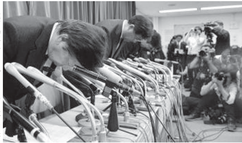
燃費不正問題の調査状況を国交省に報告後、記者会見で謝罪する(手前から)三菱自動車の相川哲郎社長、益子修会長ら=11日午後、国交省

【共同】三菱自動車は11日、燃費データを改ざんしていた軽自動車4車種以外に、スポーツタイプ多目的車(SUV)「RVR」などで必要な走行試験を実施せず、机上計算でデータを得るなどの偽装が行われていた疑いがあると発表した。