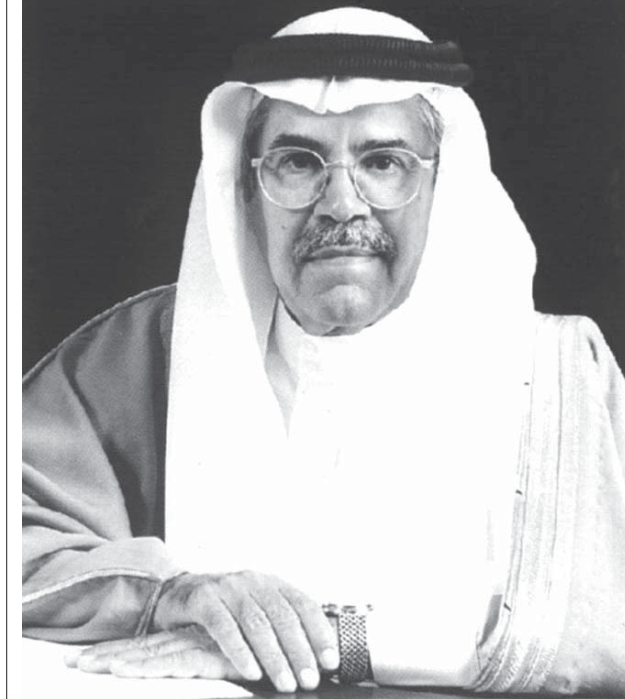
21年間続投していたのに5月に解任されたサウジのアル・ナイミ石油相

最近、トルコ、サウジ、アラビア、イスラエルと中東の主要な3ヶ国で、地政学的な転換を意味する閣僚人事が、相次いでおこなわれた。トルコで5月5日「新オスマン主義」を掲げて強硬な外交を展開した独裁的なエルドアン大統領の側近だったアフメト・ダウトオール首相が、同日大統領によって解任。5月7日にはサウジでは、21年間続投していたアル・ナイミ石油相が解任された。