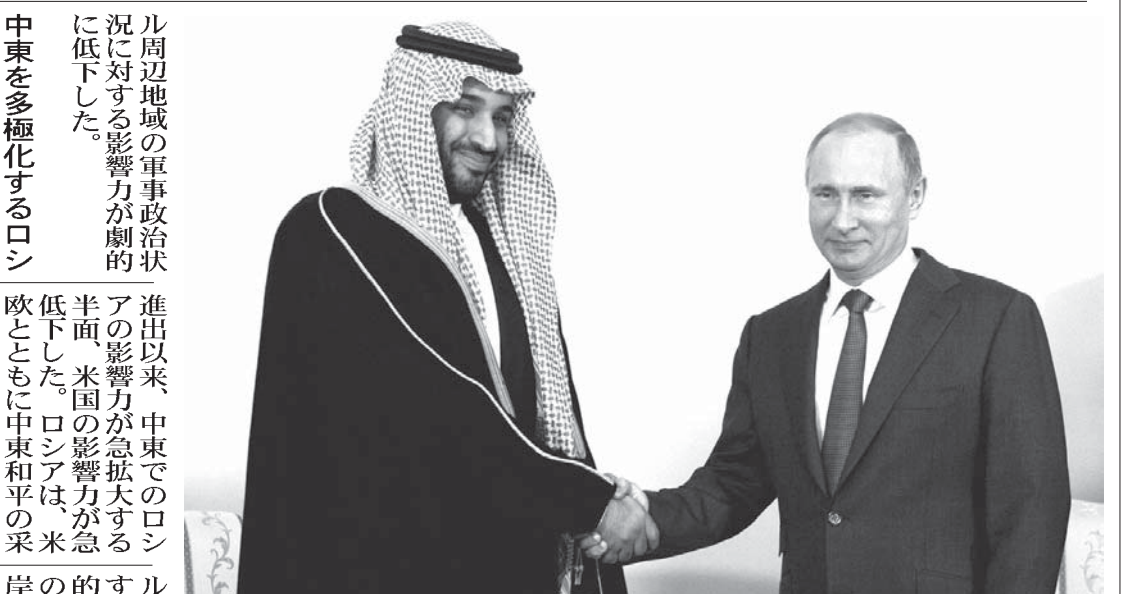
プーチン露大統領と握手するモハメド・サルマン副皇太子

リーベルマンの戦略は、親ロシアと中東和平の放棄を抱き合わせにしている。イスラエルはこれまで、表面上だけでもパレスチナ国家の創設(2国式)による中東和平の実現を目標として掲げること、2国式の達成を目標とする米欧との協調態勢を国家戦略としてきた。EUが本気で2国式を推進したいと考える傾向が強いのに、米国とイスラエルは、推進するふりをするだけで本気の推進を望まなかった。マスコミは、こうした実情を隠蔽し、欧米イスラエルが2国式の実現を「強く」望んでいるのに「パレスチナ人のテロ」のせいで進展しないと流布してきた。2国式の建前を守ってきた欧米が、イスラエルの利益に目を向けて、イスラエルと仲良くしている