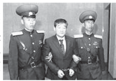
中国でスパイ行為に及んだとして起訴された愛知県の50代男性

【北京共同】中国でスパイ行為に及んだとして、浙江省で昨年5月に拘束された愛知県50代の男性を中国当局が起訴したことが23日、分かった。日本政府関係者が明らかにした。4人の中で起訴が明らかになったのは初めて。