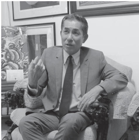
「日本政府へ強く支援の声を求めたい」と熱を込めた福島大使

前駐米大使の福島教雄氏(57)が19日午後、ブラジル出張にあたり本紙に來社した。中米各国に駐在する大使の会議で、安倍首相から直々に「日系社会と相思相愛で働け」という言葉があったと明かし、「今こそ日系社会との関係を再構築する時。連携強化、日本政府の政策見直しを図り、将来を担う人材を育てたい」と意気込みを語った。