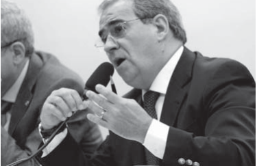
ウジミナスのロメル・デ・ソウザ社長