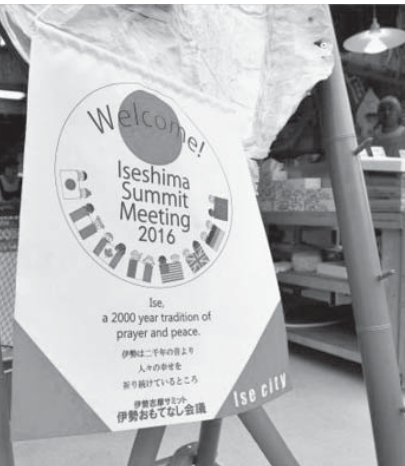
伊勢志摩サミット歓迎の旗を掲げた。24日午後、三重県伊勢市。

【共同】先進7カ国(G7)は主要国首脳会議(伊勢志摩サミット)で発表する首脳宣言「経済イニシアチブ」の骨格を固めた。最大のテーマは世界経済で、持続的成長のための金融政策、財政出動、構造改革の三つの政策を各国の事情に配慮して「総動員する」と明記し「G7版三本の矢」を打ち出す。多角的貿易体制の強化に向け環太平洋連携協定(TPP)の重要性も盛り込む方向だ。サミットは26日、三重県伊勢、志摩市で開幕。首脳宣言は最終日の27日に安倍晋三首相が発表する。