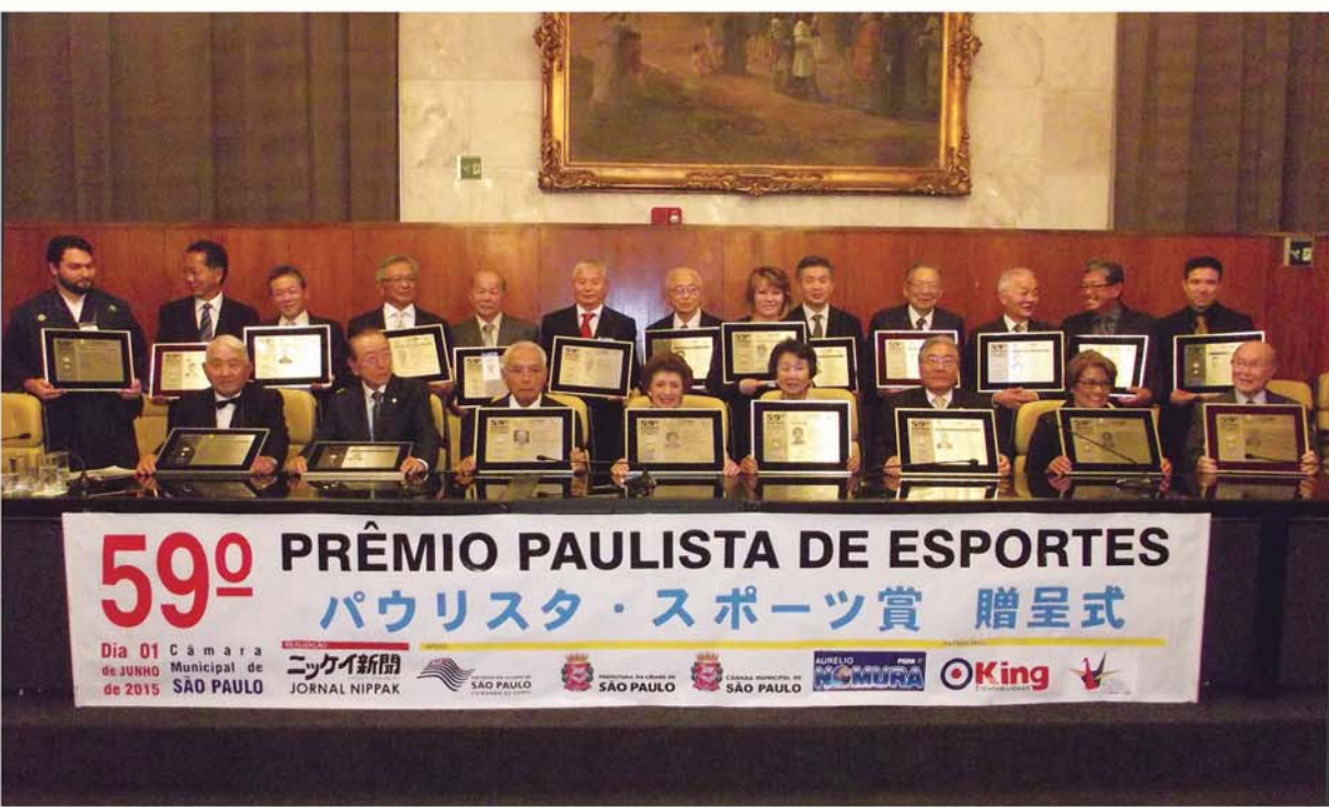
前回の贈呈式には、受賞者の家族や友人、約300人が駆けつけ、祝賀ムード一色となった。

75歳、聖州イビウナ市生まれ。フルヤ農場で初めてマレットゴルフをプレイし、ブラジルで最初に夢中になった。以来、競技の普及に協力した。パウリスタマレットゴルフ連盟設立者の一人であり、複数の役職を経験し、現在は副会長として活躍している。