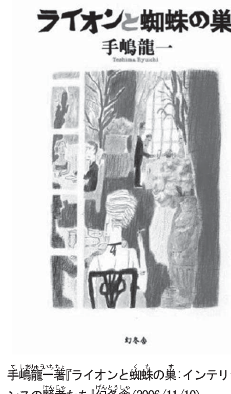
手嶋龍一著『ライオンと蜘蛛の巣: インテリジェンスの賢者たち』幻冬舎 (2006/11/10)

同時多発テロ事件の際に11日連続の中継放送を担当した元NHKワシントン支局長。ベストセラーとなったインテリジェンス小説『ウルトラ・ダラー』の著者が、世界29の都市で見た、歴史的事件の裏側、政治家、スパイたちの素顔を描く連作ノンフィクション集。