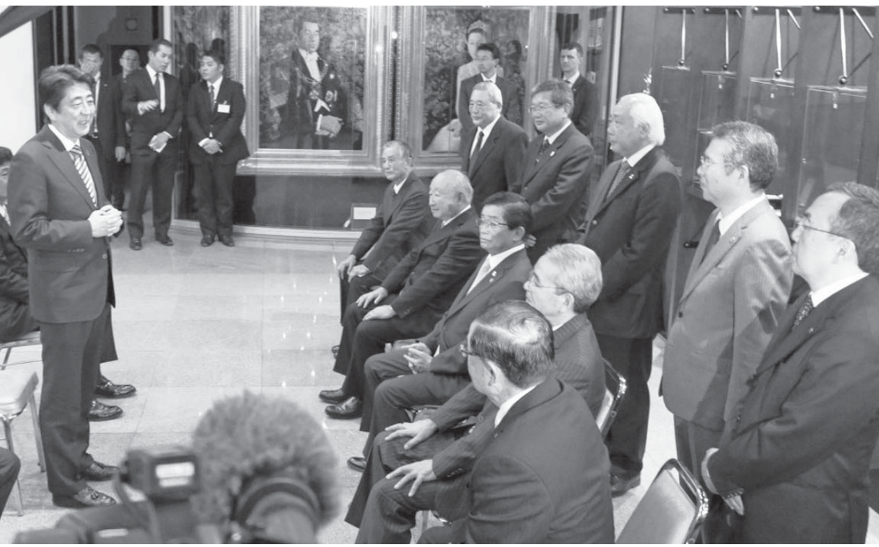
2014年8月2日、聖市の移民史料館を訪れた安倍晋三首相は、日系5団体代表を前に「日伯の太い関係を作りたい」と語った