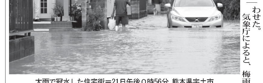
大雨で冠水した住宅街＝21日午後0時56分、熊本県宇土市