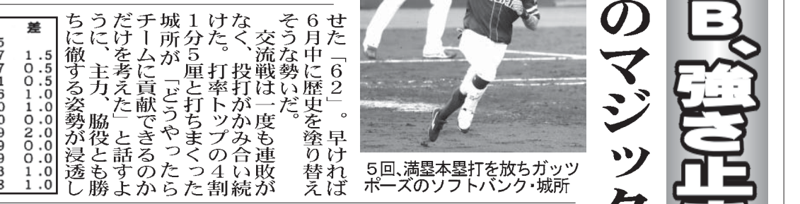
5回、満塁本塁打を打ち放ち、ソフトバンクのマジック点灯も

【共同】止まらない強さを誇るソフトバンクは得意の交流戦で13勝4敗1分けと大きく勝ち越して2年連続6度目の最高勝率に輝き、2位ロッテに7・5ゲーム差と独走態勢を築いている。工藤監督は最高勝率を喜びながら「交流戦でシーズンは終わりでない」と24日のパ・リーグ再開を見据えた。