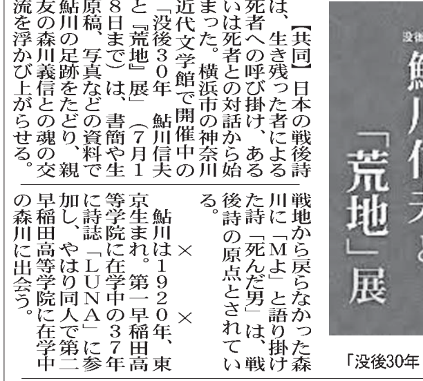
「没後30年 鮎川信夫と『荒地』展」のポスター

「共同」日本の戦後詩は、生き残った者による死者への呼び掛け、あるいは死者との対話から始まった。横浜市の神奈川近代文学館で開催中の「没後30年 鮎川信夫と『荒地』展」(7月18日まで)で、書簡や生原稿、写真などの資料で鮎川の足跡をたどり、親友の森川義信との魂の交流を浮かびあがらせる。 「没後30年 鮎川信夫と『荒地』展」(7月18日まで)で、書簡や生原稿、写真などの資料で鮎川の足跡をたどり、親友の森川義信との魂の交流を浮かびあがらせる。