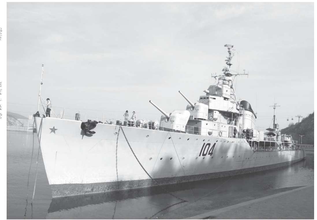
中国の駆潜艦6607/07型「鞍山」(グネヴヌイ)

展示の目玉の一つは「戦中手記」だ。鮎川は42年に入営、43年にスマトラ島北部に送られるが、44年に傷病兵として帰還。手記は福井県の傷病軍人療養所で45年2月24日から3月3日にかけて書かれた。巻紙5本、長さ計19メートル、約5万8千字。「荒地」を巡る交友、友人たちの死、思い出す「地獄の責苦がある」という軍隊教育。非情な生活を記録した。しかし、それだけでは足りない。「民族と見据え、戦後を展望する」という強烈な執着と、ひびくような魂の交流。なつこく、今年に入ってからついに終幕に近づいたことを感じしめる。0月「戦中手記」を改稿して、400字詰め原稿用紙104枚に書いた「荒地」の蘇生も初めて公開されている。