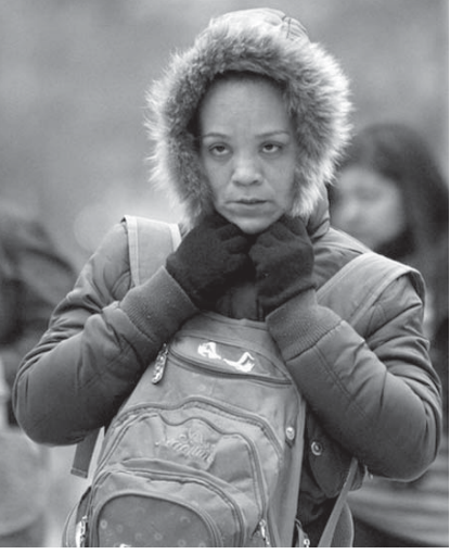
寒さに震えるサンパウロ市民

サンパウロ市内では、6月第2週に入って最低気温が5度を下回るなど、冷え込みが厳しくなっている。冬の到来を前に寒波が押し寄せ、冬物衣料を買い急ぐ消費者が増えている。