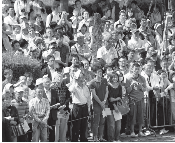
参院選公示後初の日曜日を迎え、候補者の街頭演説を聞く大勢の有権者ら=26日午後、長野県茅野市