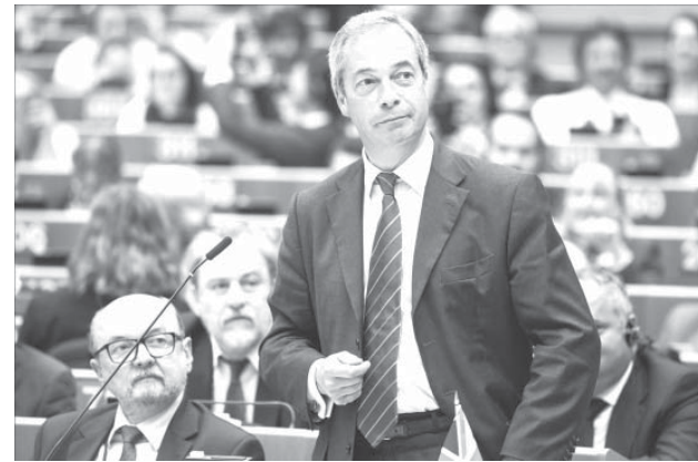
英国国民投票後の28日、英国離脱を話し合うEU臨時理事会に出席したイギリス独立党党首のナイジェル・ファラージ氏(欧州議会議員)

状況を逆手に取り、EUを脆弱にしていた。独仏が国家統合の加速を目論見た2011年前後から、英国の破壊策が功を奏し、ギリシャ危機、難民危機、パリのテロなど、周縁部の脆弱性がEU全体の混乱や弱体化につながり、EUを潰すための17年未だに国民投票を実施すると約束した。それが今回の投票実施につながる動きとなった。 国民投票は、英国がEUに対して放つ新たなEU破壊策でもあった。英国がEUに残留するかどうかを問う国民投票をやれば、国民の間にはEUへの反感が募る他の諸国でも国民投票をやろうということになる。世論調査(Pew)によると、英