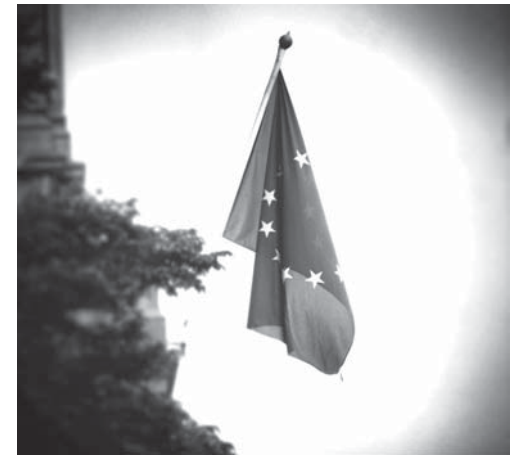
解体の危機にあるEUの旗

が脅威だった(欧州を統一した強国は、次に英国を侵略したがる)。英国の戦略は500年前から、外交術を磨き、欧州の支配下に置く冷戦構造を作り上げた。 その反動で、米国の中心に、英国のくびきを逃れたいと考える勢力が出てきて、それが90年前のレーガン政権による冷戦終結、東西ドイツ再統一、EU創設という英国を困らせる流れになった。 EUの国家統合が成功すると、それを主導するのは欧州最大の経済大国であるドイツであり、事実上ドイツが全欧を支配する隠然ドイツ帝国の誕生となる。米国は、独仏にEUを作らせ、英国を