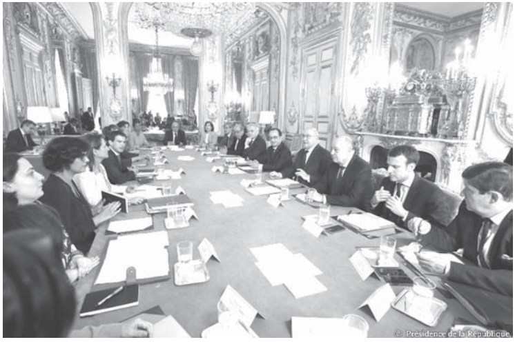
EU議会の様子

6月23日に英国でEUへの加盟継続の可否を問う国民投票が行われた。背景にあったのは、EUが政治経済の国家統合を加速しようとしていたことだった。 EUの目標は、発足以来、加盟する諸国の国家主権を剥奪してEUに集中し、EUを事実上の「欧州合衆国」にすることだった。 欧州大陸の2大国であるドイツとフランスは、歴史的に欧州大陸の覇権を争い続けてきたが、第2次大戦後、米国の提唱で独仏が国家統合していったことで欧州を安定した強い地域にする計画がEUのECとして進められ、冷戦終結で東西ドイツが再統一するとともに、欧州の国家統合計画が加速した。 92年のマーストリヒト条約で通貨と財政の統合を決め、02年からユーロが流通したが、2011年に英米投機筋がユーロを破壊する目的で引き起こしたギリシャ危機が始まったあたりから、国家統合が進まず逆にEUが崩壊しそうな流れになった。 欧州大陸を安定した強い地域にしたい独仏と対照的に、欧州の沖合にある島国の英国は、昔から大陸諸国が強くなること