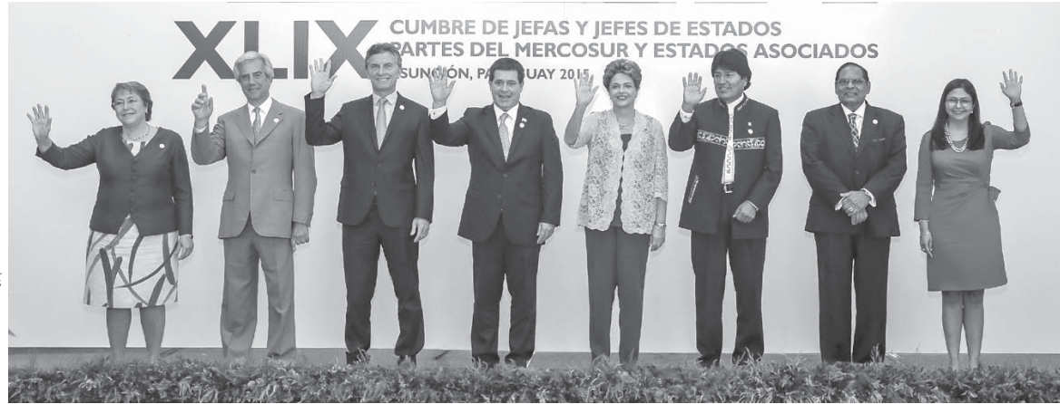
英EU離脱でメルコスールはどうなるのか (21 de dezembro de 2015, Foto: Roberto Stuckert Filho/PR)

「EU離脱は、世界の金融市場に衝撃を与え、英国にも大なり小なり、その波及はありうる。他に、EU