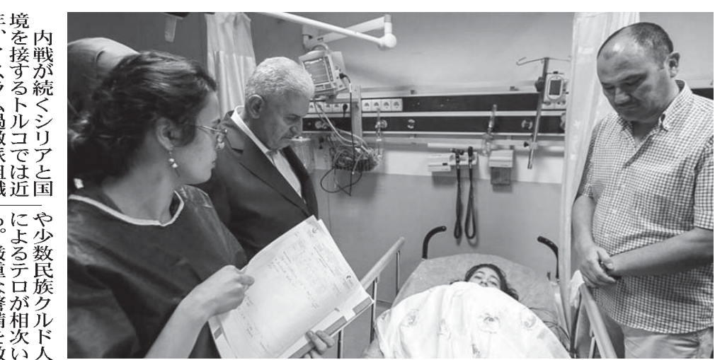
テロ事件で負傷した人々が手当てを受けている病院に見舞いに訪れたトルコ首相(左から2人目)