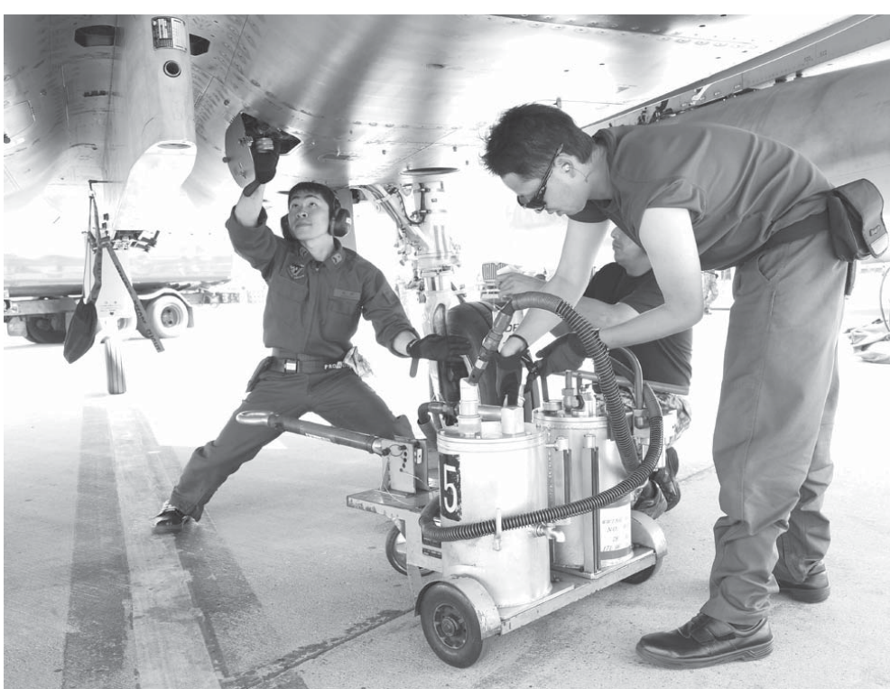
F-15Jの整備を行う航空自衛官

中国は、1970年代に入ってから「尖閣は中国固有の領土だ」と主張しはじめました。中国の調査で、尖閣周辺に石油があることがわかったのだ。