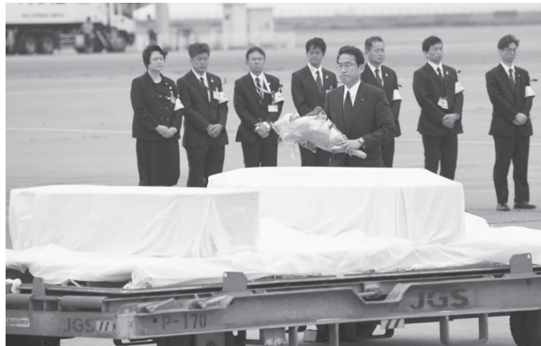
バン格拉デシュ飲食店襲撃テロの犠牲者のひつぎに献花する岸田外相=5日午前6時55分、羽田空港