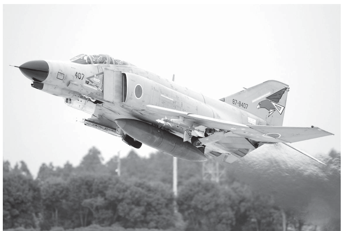
F-15Jの整備を行う航空自衛官

6月15日には、鹿児島・口永良部島周辺の領海に入った。これは海の話ですが、「空」の挑発も、ひどくなっています。最近、とても危険な事件が起きました。「中国軍機と追尾合戦か」空自機が一時、東シナ海で（時事通信6月29日水）17時9分配信。