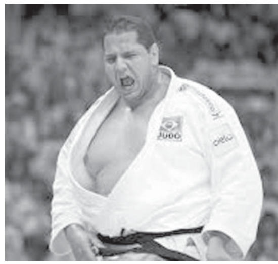
リオ五輪期待の柔道のラファエル・シウヴァ選手

半期(1-6月期)はさらに低調で、2億2900万レアルの適用承認額のうち、実際に契約までこぎつけたのは、わずか5030万レアルだ。スポーツ振興法の適用を受ければ、法人は最大1%、個人は6%を上限に、所得税(I.R.)の減税を受けることができる。こうして集められた資金は、一般的にスポーツ大会の開催費用や、インフラへの投資、団体運営費、管理者やトレーナーの給与として利用されている。