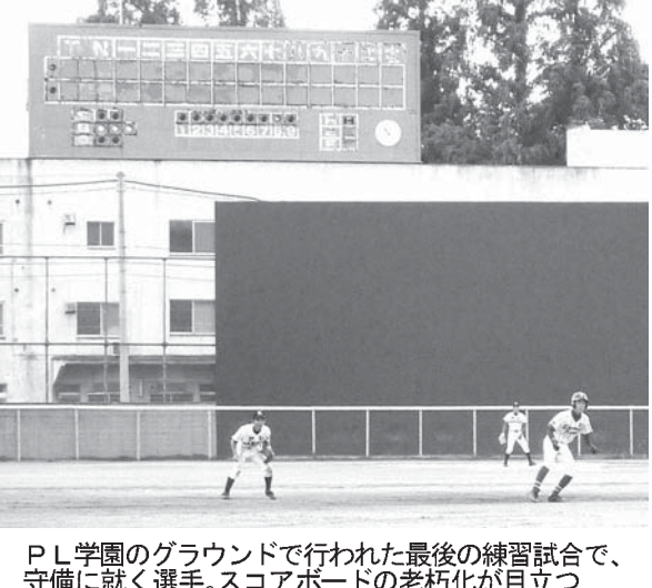
PL学園のグラウンドで行われた最後の練習試合で、守備に就く選手。スコアボードの老朽化が目立つ

【共同】高校野球の甲子園大会を春夏通じて7度制し、一時代を築いたPL学園（大阪）が今夏をもって硬式野球部の活動を休止する。甲子園出場が懸かる全国選手権大会は9日に開幕。甲子園出場資格がある11人の3年生は名門のプライドを胸に最後の夏に挑む。 ▽学校存続を危ぶむ声 3日、チームは大阪府