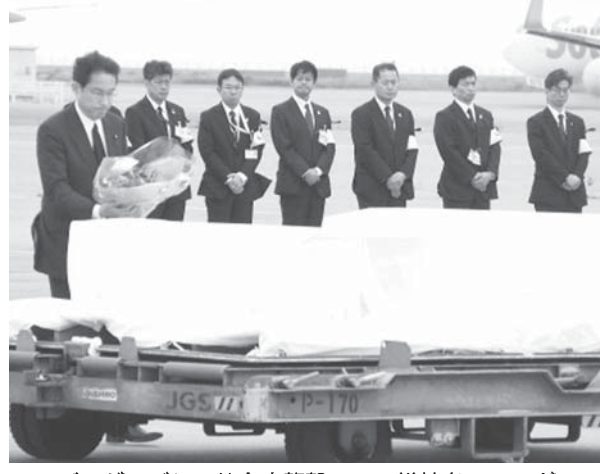
バングラデシュ飲食店襲撃テロの犠牲者のひつぎに献花する岸田文雄外相(左)

【タツカ共同】角田隆二「バングラデシュは縫製品の輸出で世界2位の「縫製大国」だ。安く豊富な労働力で、アパレル産業の集積地として急成長を続けてきた。しかし日本人7人を含む2人が犠牲になった飲食店襲撃テロは、経済に暗い影を落とす。野党との激しい政争に明け暮れるハシナ政権のテロ対策が、後手に回ったことは否めない。海外からの投資にも影響が出そうだ。