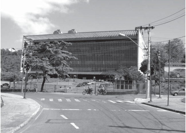
ミナス州都ペロオリゾンデにあるウジミナス本社