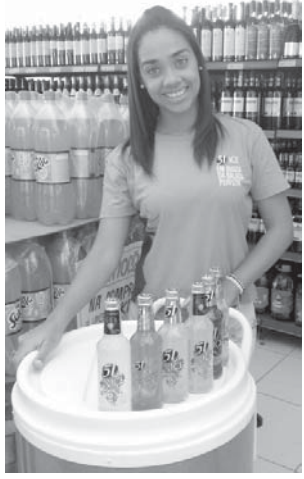
アイスクリームが売られる光景

二ルセンによると、2016年5月までの過去12カ月間に酒類の販売は、4.2%落ち込んだ。数量ベースで蒸留酒市場の78%を占めるカシヤツサは、この期間に3.1%落ち込んだ。ビール(マイナス3.5%)、ウイスキー(マイナス4.9%)、ウオッカ(マイナス5.5%)、冷製のオーソブル(マイナス4.9%)、コニヤック(マイナス9.4%)、ラム酒(マイナス26.9%)と、アルコール飲料を取り巻く製品は、軒並み販売が落ち込んだ。