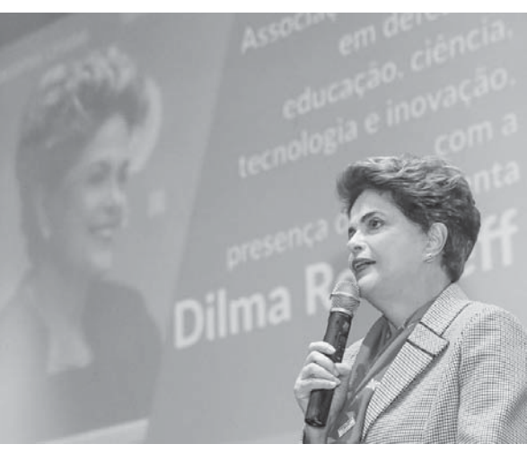
18日の講演でのジウマ氏

停職中のジウマ大統領は18日、大聖市圏サンベルナルド・ド・カ ンポのABC連邦大学で講演を行い、ミシェル・テメル大統領代行の 政治を批判すると同時に、自身の境遇をトルコの軍事クーデターとも 比較した。19日付付字紙が報じている。