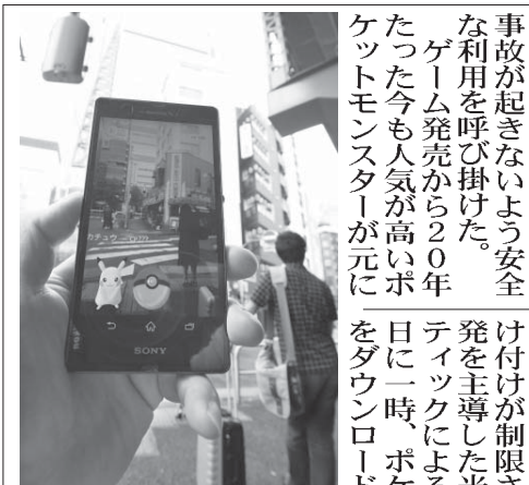
「ポケモンGO」の国内配信が始まり、東京都港区六本木に現れたポケモンGOの画面を撮影した人

DIRETOR PRESIDENTE RAUL M. TAKAKI JORNALISTA RESPONSÁVEL TAKAO MIYAGUI