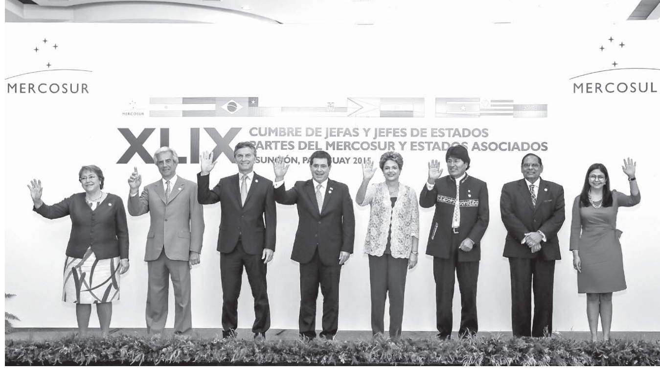
2015年12月21日のメルコスールおよび関係国会議に出席した南米各国の大統領ら

南米南部共同市場(メルコスール)は加盟国国名の頭文字の(ABC)順に沿って輪番議長国の座を6カ月に持ち回りで交代する制度である。本来なら規定に従ってこの7月にウルグアイからウエネスエラに議長国の席が引継がれるはずのところ、パラグアイとブラジルの反対で延び延びになっている事態が続いている。