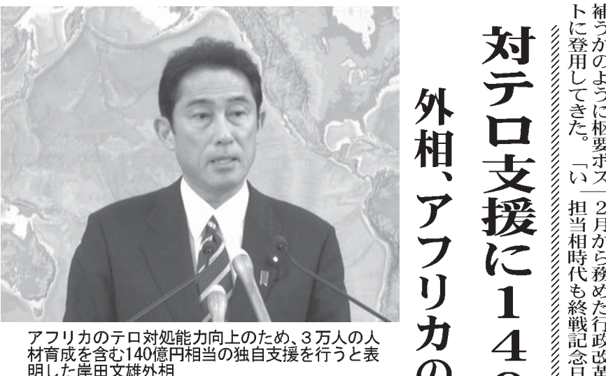
アフリカ支援に140億円 外相、アフリカの平和構築

【ニューデリー共同】日本人7人が殺害されたバンラデシの飲食店襲撃事件を受け、同国政府は7月下旬に予定していた日本の政府開発援助(ODA)による最新鋭石炭火力発電所建設など大型プロジェクトの最終入札を延期したことが28日、分かった。入札に応じる日系企業の安全対策を強化する必要があると判断した。複数の関係者