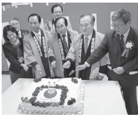
ケーキカットで創立祝う関係者。左から2人目が小川議長、小林会長、橋本知事

茨城県人会(小林博会長)の創立55周年記念式典が、31日午前10時から文協小講堂で行われた。母県から橋本昌昭知事、小川一成県議会議長ら慶賀団12人が駆けつけたほか、中前隆博在任総領事、各県人会会長らが多数出席し、延べ150人を超える参加者で盛大に祝われた。