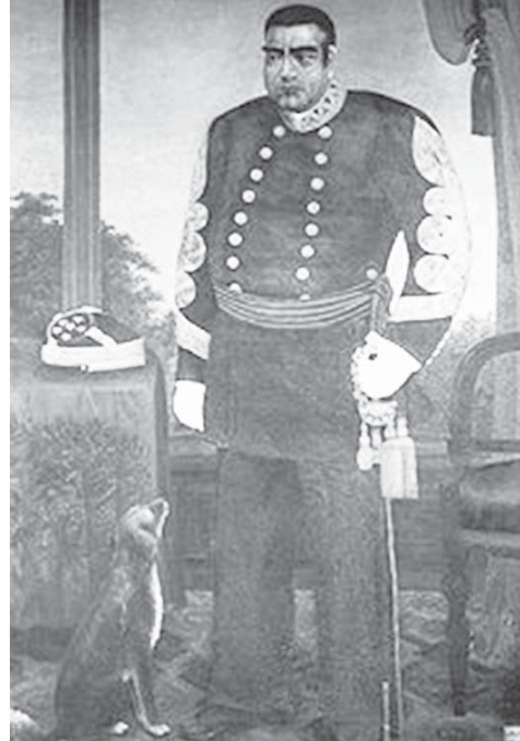
軍服姿の西郷隆盛

この疑問を氷解させてくれたのが、岩田温氏の『日本人の歴史哲学』なぜ彼らは立ち上がったのか。まるでアメリカが黒船による脅しをかけて日本に開国を迫つたのと同様のことを、日本が朝鮮に行つてもりだつたかのようなのである。西郷はそのような「征韓論者」だったのか?西郷が征韓論者であつたという説は、次の板垣退助にあてた手紙を根拠としている。