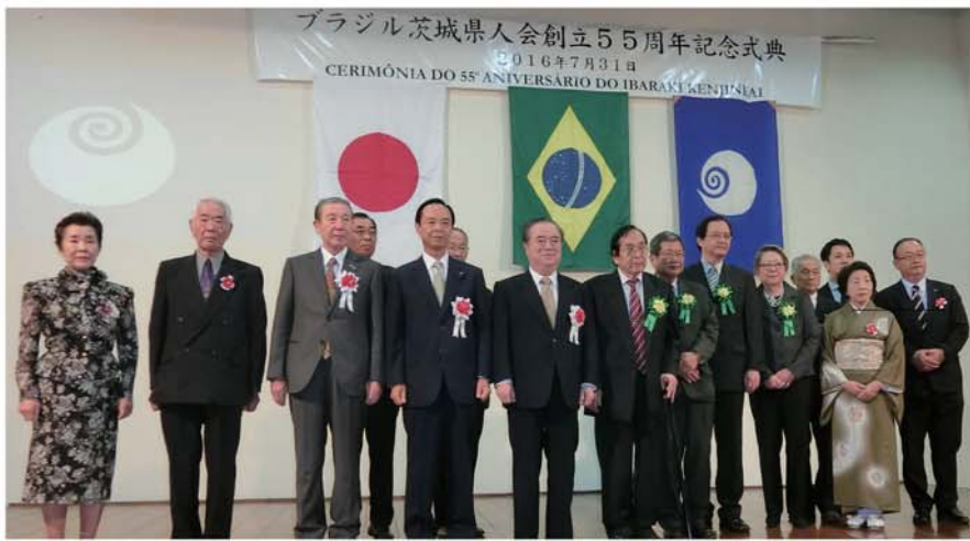
母県から橋本昌 茨城県知事ら12人の慶祝団も駆けつけ、茨城県人会の節目を祝した

茨城県人会(小林操会長)は7月31日に母市の文協小講堂で創立55周年記念式典を盛大に挙げて、6期連続で県政を担い、20年以上もの深い繋がりを誇る橋本昌知事ら12人の慶祝団を含め、延べ150人を越える参加者で会場は満員になった。前後祭も100人超の大盛況。式典後の祝賀会では遠方から会員が駆けつけたほか、橋本知事の周りには再会を喜ぶ参加者が終始集まり、各々が旧交を温め、母県との絆に思いを馳せた。