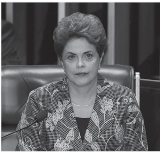
弁明を行うジウマ大統領