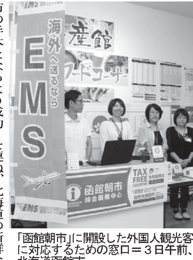
「函館朝市」に開設した外国人観光客対応のための窓口。3日午前、北海道函館市。

【共同】熊本市（熊本県）にある堀の一部が熊本市内で震度5弱を観測した先月31日の地震で、約20メートルにわたって倒壊した。市の担当者が1日に確認した。熊本地震で傾いた状態に