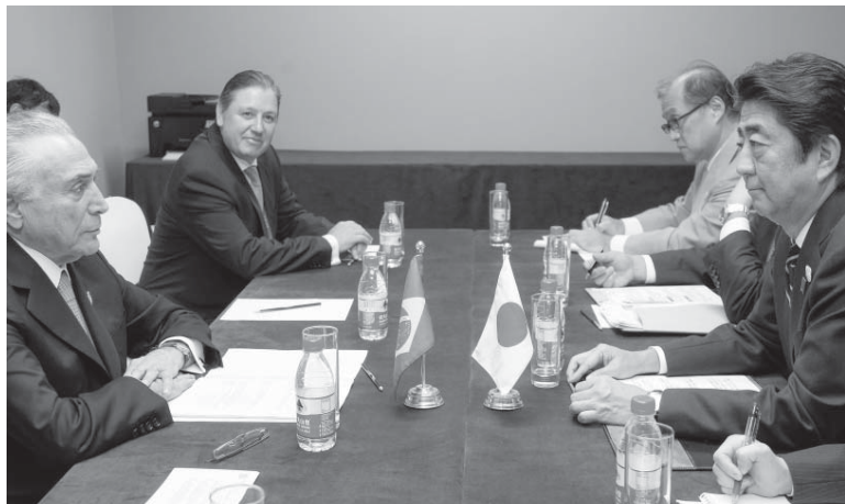
テメル大統領と会談する安倍首相(05/09/2016)

安倍首相「緊密な協力深めたい」 テメル大統領と首脳会談 G20杭州サミット出席のため中国の杭州を訪問中の安倍首相は5日午前(現地時間)、テメル大統領と首脳会談を行った。 5日付日本国外務省サイトによれば、首相はまずリオ五輪の成功を祝福し、「ブラジルは世界最大の日系社会を有し、民主主義、法の支配といった基本的価値観を共有する共通点が多く、もっと絆を深めたい」と述べた。 また、技術革新などの分野で日本の経験を学び、協力を深めたいと発言し、肉類や果物も日本に輸出したいと発言したことを伝えた。 さらに、港、空港、鉄道などのインフラ投資を呼び込みたい旨を要請したという。