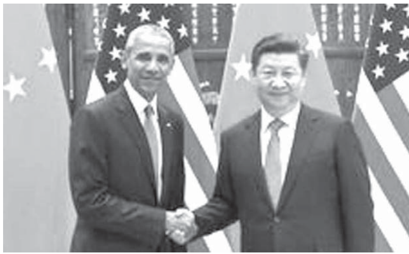
会談前に握手を交わすオバマ米大統領(左)と中国の習近平国家主席

【杭州共同】オバマ米大統領と中国の習近平国家主席は3日午後、20カ国・地域(G20)首脳会合が開かれる中国・杭州で、昨年末に採択された地球温暖化対策の新枠組み「パリ協定」を批准したと正式発表した。批准文書を国連の潘基文事務総長に手渡し、地球規模の課題で協調する姿勢を誇示した。温室効果ガスの二大排出国の批准により協定は年内発効へ大きく前進した。