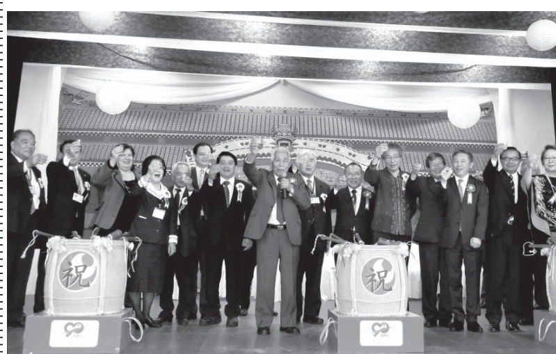
乾杯する関係者ら

1等はトヨタのエティオス 援協リッファが販売開始 豪華賞品があたる援協リッファ(協賛券)の販売が開始された。1枚15レアル、1冊(10枚綴り)は1割引きで135(トヨタ)、2、3等オートバイ(ホンダ)、4等冷蔵庫、5等洗濯機(ともにパナソニック)。 抽選は10月22日、当選発表は紙面にて発表する。贈呈式は11月に援協本部ほか傘下の各施設で購入者に実施される。