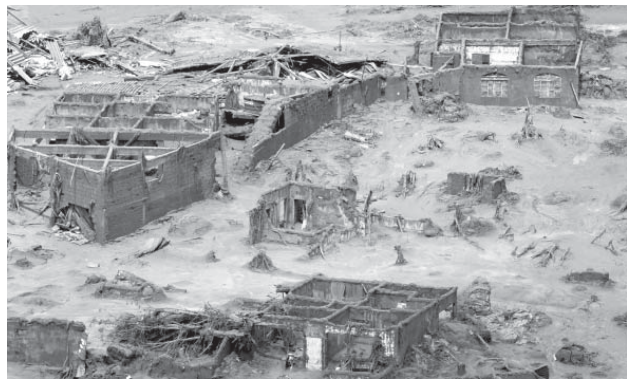
鉦澤ダムの決壊の様相

ミナス・ジェライス州マリリアーナで鉦澤ダムの決壊事故が発生してからおよそ1年が経過し、専門家らは、事故につながった構造的問題は2009年から蓄積されていたと指摘している。