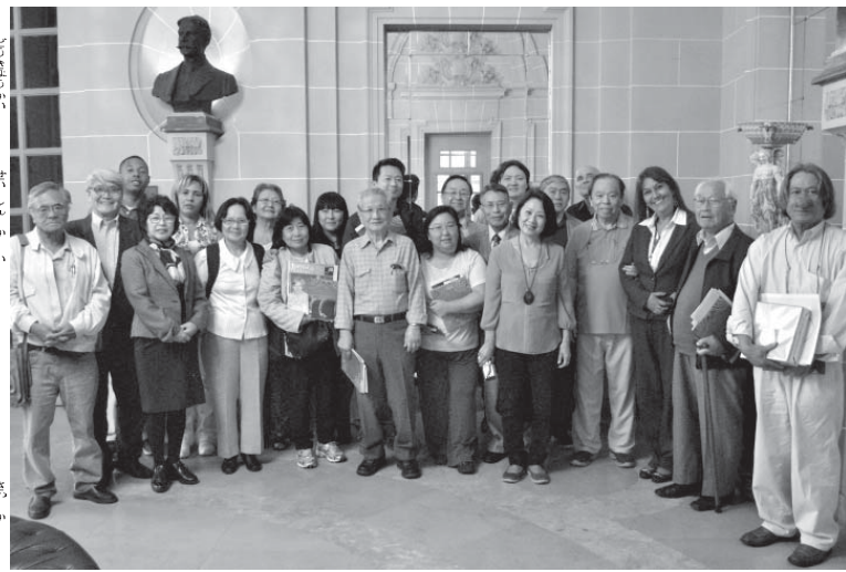
玄関で記念撮影する作家協会の関係者

「リオ発」小倉祐貴記者 昨年3月に発足したブラジル日系人作家協会(Academia Nipô-Brasileira de Letras)の19人が先月26日午後、文学界で最も権威のある「ブラジル文学アカデミー」の招待を受け、リオの同本部を訪れた。同施設に足を踏み入れた日系人は少なく、団体での招待はさらに異例の出来事といえそうだ。