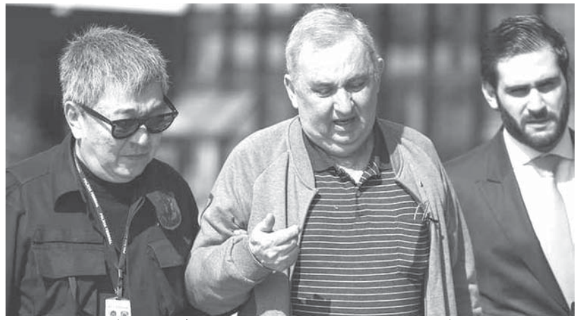
左から「連邦警察のジャポネース」、ブライ容疑者

ラヴァ・ジャット作戦で逮捕された容疑者「ルーラ元大統領の友人」として有名なブライ容疑者を連行しているのは、あの「連邦警察のジャポネース」イシイです。