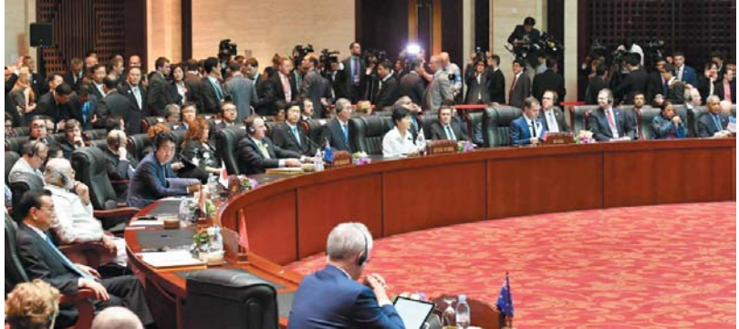
東アジアサミットに出席した(左から)中国の李克強首相、インドのモディ首相、安倍首相ら各国首脳。右端は米国のオバマ大統領=8日、ラオス・ビエンチャン