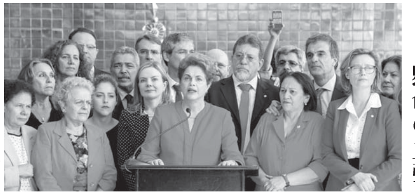
8月31日に声明を発表したジウマ氏

スポーツ界の強豪である米国やオーストラリアを超えるだろう。我々は09年に作られた大きな目標実現に向かって進んでいる。08年の北京五輪では、4位入賞には24個のメダル獲得が必要だった。12年のロンドン五輪は34個獲得しなければならなかったが、伯国の獲得数は低かった。これまで獲得したメダルは12個で、これは目標達成には遠く及ばないと言った。