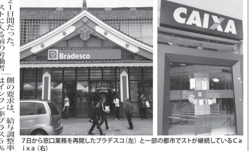
7日から窓口業務を再開したブラデスコ(左)と一部の都市でストが継続しているCaixa(右)

全伯で31日間に渡って続いた銀行員のストが終了し、7日から営業を再開することで合意した。6日付G1サイトが報じた。一部例外もあり、6日夜の時点で、アマパライ州、バイア州、マラニオン州、ペルナンブコ州、リオ州、北大河州、聖州の州都の連邦貯蓄銀行(Caixa)では、ストは継続されると報じられた。ストは伯国全土の銀行サービスに影響し、自動支払機や、その他の代替手段ではカバーできない窓口業務は、その間利用できなかった。5日午後、銀行連盟(Fenaban)が出した3度目の調停案は、8%の給与調整と、3500レのボーナス支給、ランチ支給額10%増、育児援助支給額は、10%増、一般食費支給額15%増、さらにその他全ての手当で1%増が含まれていた。銀行側から提案は2年間有効で、給与調整は毎年、インフレ率プラス1%となる。聖州各都市の貯蓄銀行の中で、6日夜までに合意が成立せず、7日に営業再開されなかったのは、聖市、オザスコ、モジズ・ダ・ジカリア、サントスの各都市の2004年に初めて銀行職員が全国ストを行った31日間の記録を破った。昨年、21日間だった。ストに入る前の労働者側の要求は、給与調整率5%増と、インフレ率プラス5%