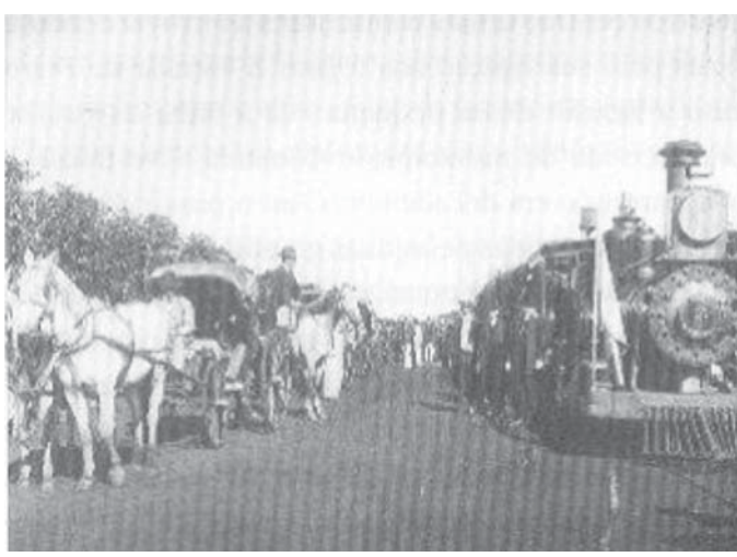
ツモン鉄道路線の機関車とトローリ(二頭引馬車)1970年頃