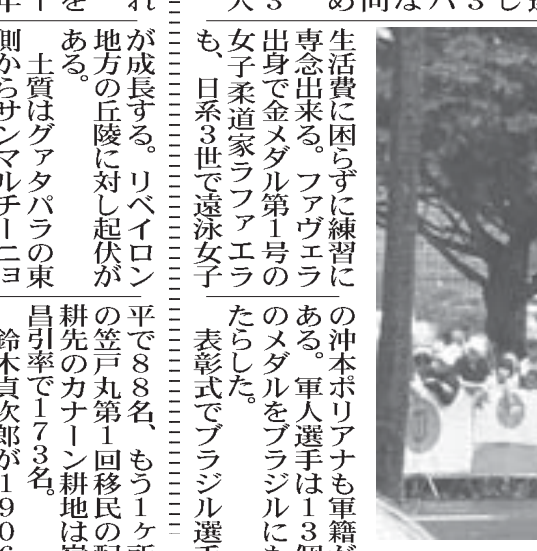
日本ががんばれ