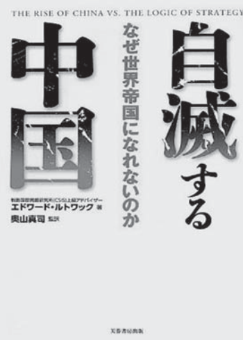
なぜ世界帝国になれないのか

『自滅する中国』(2013年、エドワード・ルトワック著、奥山真司・翻訳、芙蓉書房出版)