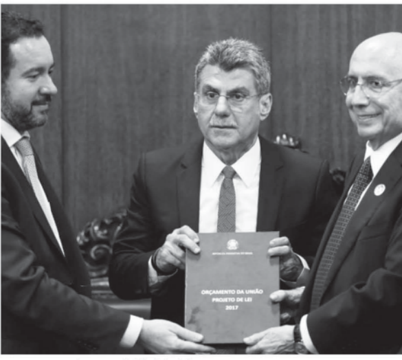
ロメロ・ジュカー上議 (中央)

【権威者侮辱防止法】(Lei de abuso de autoridade)の審議を、決選投票後の11月にも再開させる動きが上院で起きており、ラウアー・ジャット作戦の捜査妨害にもなりかねない問題視されている。しかもその法案を審議する特別委員会の報告官が、LJで疑惑をかけられるロメロ・ジュカー上議(民主運動党・PMDB)。同じく疑惑のあるレン・カリエイロス上院議長も急いで通過させようとしていたが、連邦検察庁などの強い反響を受けて7月に審議が中断されていた経緯がある。14日付の紙が報じている。