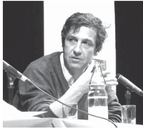
エマニュエル・トッド

「ソ連崩壊」「アメリカ没落」「EU危機」を、それが起るかなり前に予言した「予言者」エマニュエル・トッドさん。 トッドさんは、「トランプ現象」をどう見ているのでしょうか？ 世の中には、「予言がピタリとあたる」ので「予言者」と呼ばれる人がいます。 フランス人の人口学者、歴史人類学者、歴史学者エマニュエル・トッドさんは、まさに、予言者。 この方は、もう何十年も、大きな予言をはずしたことがありません。まず1976年、当時「永遠につづく」と思われていたソ連の崩壊を予言し、一躍有名になりました。 2002年、トッドさんは、「帝国以後」を出