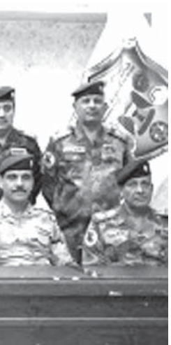
モスル奪還作戦の開始を宣言するイラクのアバディ首相(前列中央)

【テヘラン共同】イスラム教シーア派大団体のラスタンとスナ、同国と経済関係の強化を目指すイタリヤの軍艦と共に、ペルシャ湾の公海で演習を実施したイラン海軍