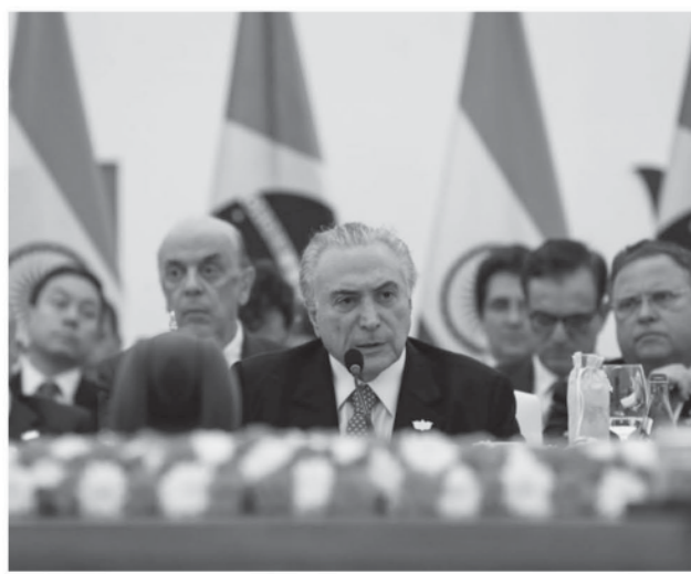
BRICS会議でのテメル大統領

テメル大統領は、自身・初となるBRICS会議で、ジウマ政権崩壊後、自政権が経済再建に向けて努力していることをアピールした。