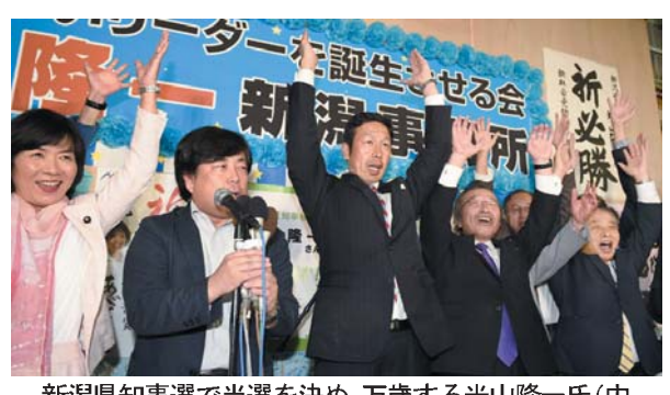
新潟県知事選で当選を決め、万歳する米山隆一氏(中央)=16日夜、新潟市中央区

【共同】事実上の与野党対決となった16日投票開票の新潟県知事選で与野党候補が敗れ、安倍政権に激震が走った。最大争点の新潟電力柏崎刈羽原発再稼働問題だけでなく、環太平洋洋連携協定(TPP)の国会審議の行方も影響を与えるのは避けられない。来年1月の衆院解散が取り沙汰される中、安倍首相の解散戦略を左右する可能性もある。勢いづく野党は「新潟ショック」を追い風に、政権に対し攻勢を強める考えだ。