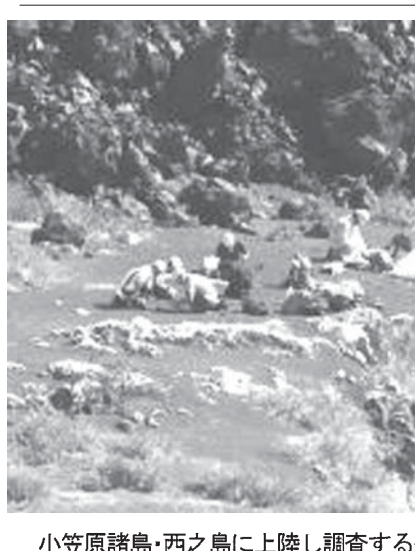
小笠原諸島・西之島に上陸し調査する研究者ら

【共同】2013年から噴火で面積が拡大した小笠原諸島・西之島(東京)の火山活動や生物を調査するため、調査船で現地に向かっていた東京大地震研究所などの研究チームが20日、噴火後初めて上陸した。チームは、島の西側の噴火前線から約200メートル離れた陸地部分で作業を開始。共同通信社機からは、溶岩が固まったとみられる黒い岩が上陸地点に迫る様子や、火山灰で覆われている