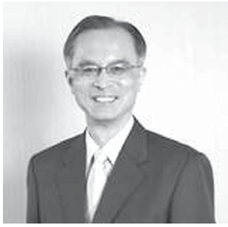
置かれた社会的状況にも、子どもも目を向ける必要があると訴える、日本小児科学会五十嵐隆理理事長

【共同】6人に1人が貧困状態にある日本の子どもに、正面から向き合おうとする小児科医が増えつつある。社会の中で子どもに近い位置にいる専門職として、深刻化する問題で役割を果たせるのが問われている。