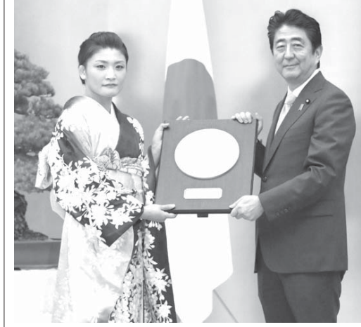
国民栄誉賞授与式で、安倍首相(右)から盾を受け取るレスリング女子58キロ級の伊調馨選手

【共同】リオデジャネイロ五輪で4連覇を達成したレスリング女子58キロ級の伊調馨選手(32)が、国民栄誉賞授与式で、安倍首相(右)から表彰状や記念品が贈られた。伊調選手は父親の春行さん、姉で五輪メダリストの千春さんらとともに出席し、安倍首相に「偉業を成し遂げ、多くの国民に深い感動と勇気を与えた」と表彰された。伊調選手は父親の春行さん、姉で五輪メダリストの千春さんらとともに出席し、安倍首相に「偉業を成し遂げ、多くの国民に深い感動と勇気を与えた」と表彰された。