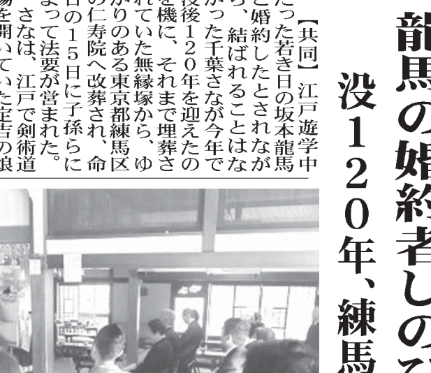
龍馬の婚約者千葉さなをしのび、仁寿院で営まれた法要

【共同】江戸遊学中だった若き日の坂本龍馬と婚約したとされる龍馬の婚約者千葉さなが、12月15日に江戸で没したと発表された。龍馬の婚約者千葉さなをしのび、仁寿院で営まれた法要