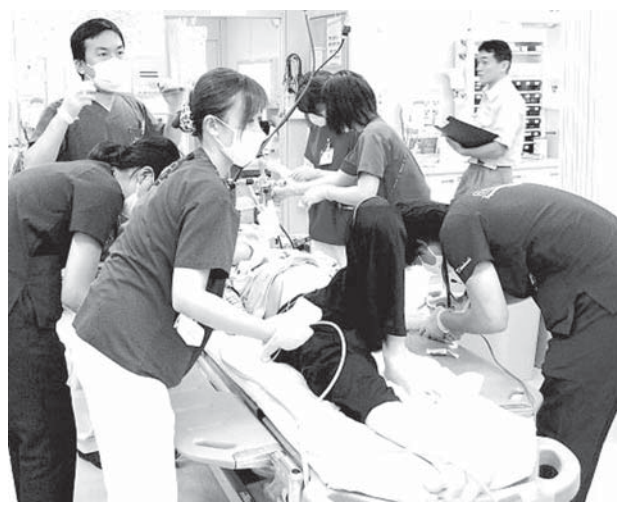
救急車で運ばれてきた患者に延命措置をする病院のスタッフ

【共同】高齢者の救急搬送を巡り、厚生労働省が医師らと救急隊の連携を後押しするのは、本人の意思が分からず蘇生・延命措置をすべきかどうか悩むケースが増え、医療現場で見逃せない問題になっている。患者が寿命を迎えつつある中で、望ましい終末期医療とは何か。重い選択を前に、関係学会も判断する際の指針づくりを進めている。