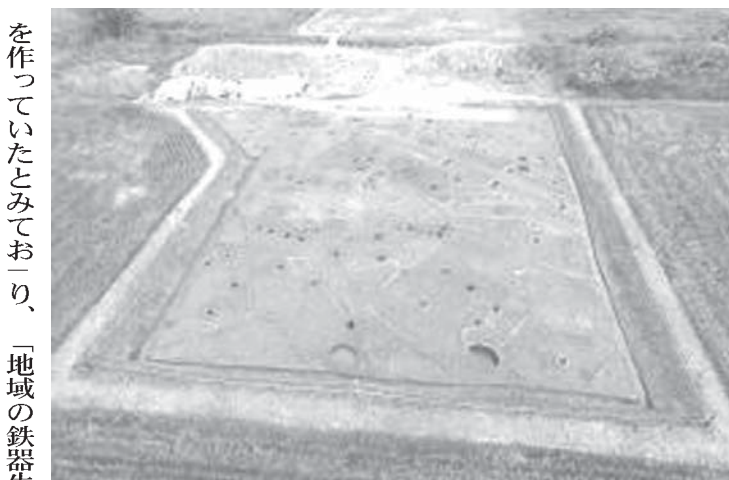
古墳時代前期の大型建物跡が見つかった滋賀県彦根市の稲部遺跡

【共同】滋賀県彦根市の稲部遺跡で、古墳時代の前期(3世紀中ごろ)の大型建物跡(面積188平方メートル)が見つかり、17日、市教育委員会が発表した。弥生時代末・古墳時代前期では、邪馬台国の有力候補地とされる稲部遺跡(奈良県桜井市)の大型建物跡(238平方メートル)に次ぐ規模だった。また、当時では国内最大規模の鍛冶工房とみられる遺構も見つかった。 遺跡は東日本と西日本をつなぐ交通の要衝に位置。邪馬台国の一つと見られる30国の一つとする見方もあり、邪馬台国から大和政権成立期に鉄と交易で栄えた一大勢力があったことを示す遺跡として注目される。 建物跡は縦16・2メートル、横11・6メートル、柱穴の大きさは1・5メートルと巨大で、柱の直径は0・3〜0・4メートル。そばには柵とみられる柱穴の列もあり、豪族居館などだった可能性もある。同じ場所、柱が多い総柱建物(145平方メートル)に建て替えられており、総柱建物は物流に関する巨大倉庫とみられる。鉄器生産を専門としたことから、市教委は、鉄器生産を専門とする工房で、鉄製武器などを