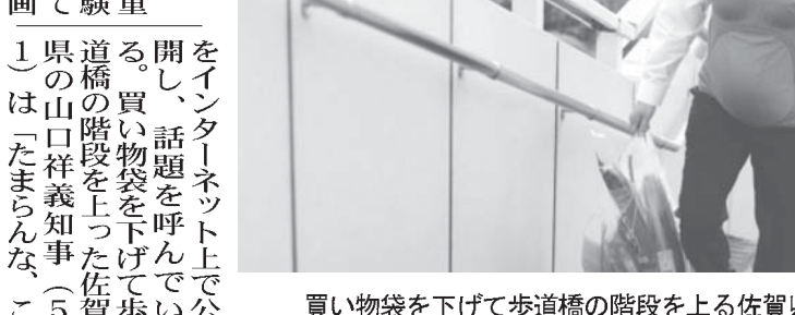
買い物袋を下げて歩道橋の階段を上る佐賀県の山口祥義知事

【共同】山口、佐賀、宮崎3県の男性知事が、妊娠7カ月に相当する重さ7・3キロの妊婦体験ジャケットを身に付けて家事や買い物をする動画