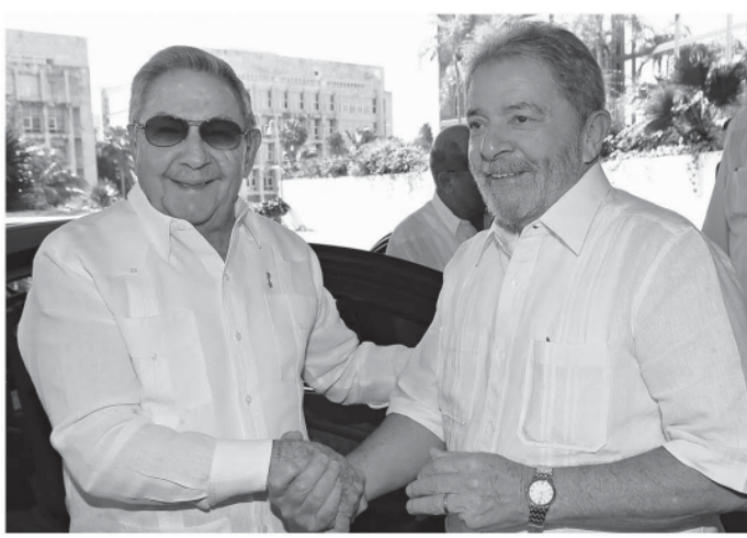
2014年2月にキューバを訪れた際のルーラ氏

今回の連署の推論は、ジウマ政権の官房長官ルーラ政権時の財相で、9月26日に逮捕された