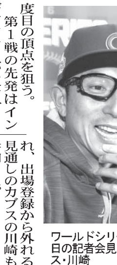
ワールドシリーズ前日の記者会見をする監督