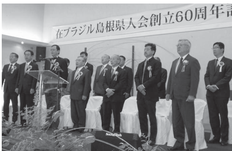
式典は午前10時から始まり、日伯国歌、島根県人会の歌、先達者への献花が行われた。