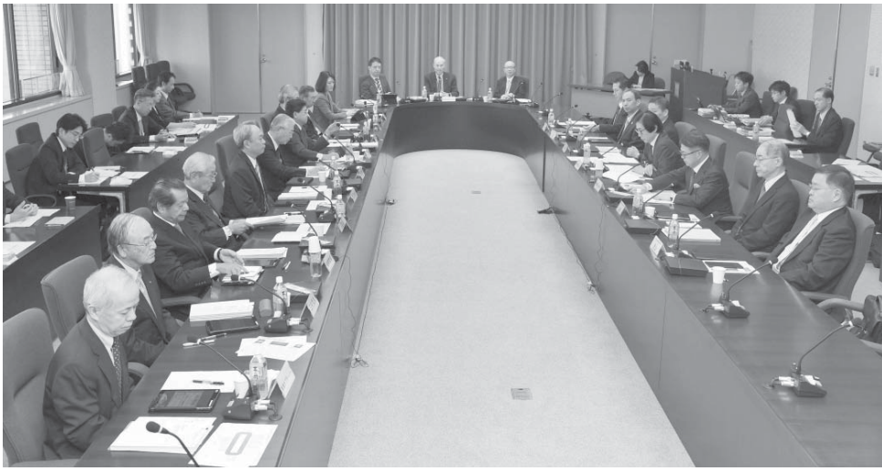
「東電改革・1-F問題委員会」の会合=25日午前、東京・霞が関

【共同】経済産業省は25日、東京電力福島第1原発の廃炉に必要な費用が、現在想定している年間800億円から年間数千億円に拡大するとの試算を示した。廃炉には30年以上を要するとみられており、東電が試算した総額2兆円を大幅に上回ることが確実となった。新たに東電の原子力事業を分社化する案も提示。送配電事業を含めた他の大手電力との再編を通じ、廃炉費用などを捻出させる考えだ。事故処理の関連費用が増えるため国民負担につながる可能性がある。