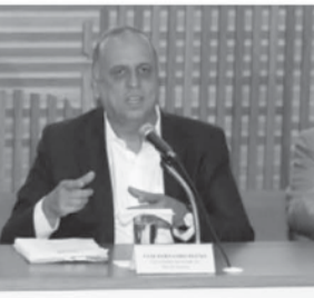
病療養から復職直後にも関わらず、財政建て直しの諸策を発表したベソン知事(Carlos Magno)

同州が財政破綻し、公務員への給与の支払いも滞っている事は、10月にジョゼ・ベルトラメ保安局長やフェルナン