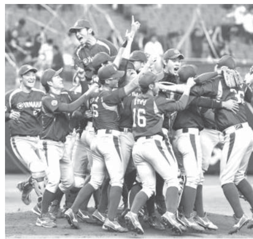
日本通運を破って初優勝を果たし、大喜びのヤマハナイン

秋場所では春日山部屋に23人の力士が在籍したが、消滅に伴って12人が引退届を提出した。さらに2人が引退を検討し、九州場所へ調整する力士は9人。部屋が再興するまでの措置で力士を預かる立場となった追手風親方(元幕内大翔山)は「早く新しい師匠が決まるといい」と話した。