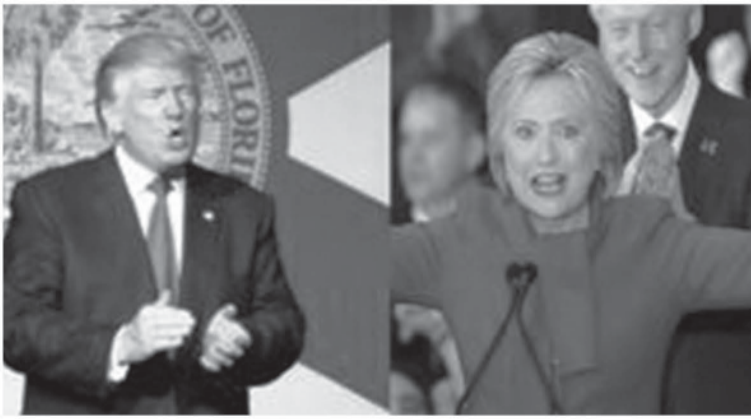
ヒラリー氏(右)とトランプ氏

G1サイトの取材に、当選した方が良い候補は、見たエゴノミストたちのヒラリー氏だという。見解では、伯国にとってそれは、ヒラリー氏が