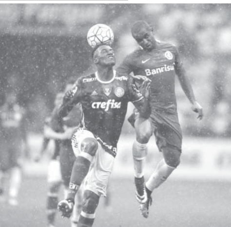
首位のパルメイラスは6日のインテル戦に勝利し、優勝に近づいた

サッカーブラジル全国選手権第34節が11月5日から7日にかけて行われ、首位のパルメイラスが勝って首位をキープしたのに対し、前節まで2位のフラメンゴが引き分けて3位に転落。代わりに2位にはサントスが浮上した。