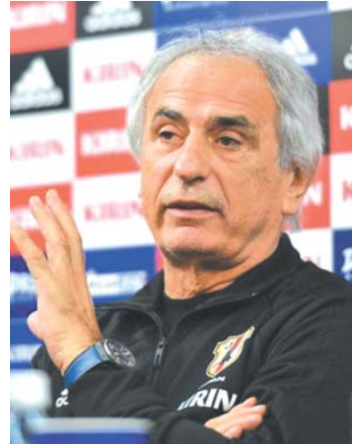
記者会見するハリルホジッチ監督

【共同】サッカー日本代表は11日午後7時20分から茨城県鹿嶋市のカシマスタジアムで行われる国際親善試合、キリン・チャレンジカップでオマーン代表と対戦する。10日は試合会場での記者会見が行われ、ハリルホジッチ監督はワールドカップ(W杯)アジア最終予選のサウジアラビア戦(15日・埼玉スタジアム)へ「われわれにとっていいテストマッチになる」と語った。