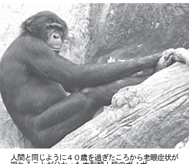
人間と同じように40歳を過ぎたころから老眼症状が現れることが分かった大型類人猿のボノボ

【共同】大型類人猿のボノボにも老眼があり、人間と同じように40歳を過ぎたころから症状が現れることが分かった。と、京都大霊長類研究所のチムが7日付の米科学誌「ネイチャー」に発表した。チムは「ボノボの老眼の原因は、読者の老眼の原因は、読み書きなど人間特有の作業だとされた。これは、同じ祖先から受け継いだ霊長類共通の現象とみられる」としている。