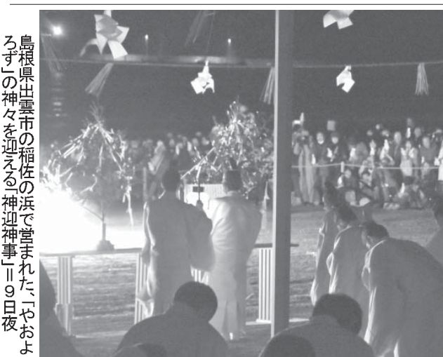
島根県出雲市の稲佐の浜で営まれた「やおよろず」の神迎神事。9日夜。

【共同】任天堂は10日、1983年に発売した大ヒットした家庭用ゲーム機「ファミコン」の復刻版「ファミコンミニ」を手のひらサイズで復刻した。販売店などで予約が殺到し、当時の熱狂ぶりをほうふつとさせている。