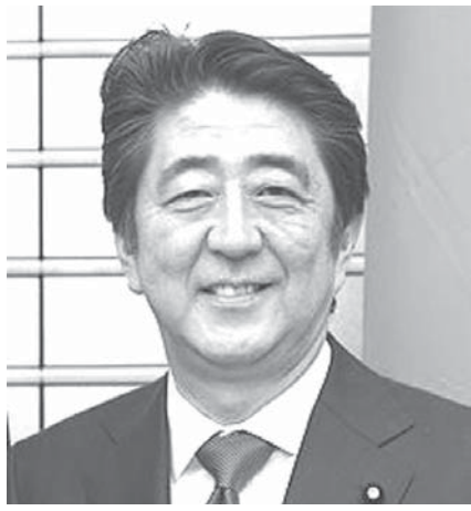
トランプ氏と会談する日程を自ら取り付けた安倍首相

【共同】安倍晋三首相が、米大統領選に勝利したトランプ氏と17日、ニューヨークで会談する日程を自ら電話で取り付けた。各国に先駆けた「電光石火」(政府高官)のアプローチはやる気持の裏にはクリントン氏勝利を見込んで、トランプ氏との関係構築を進んでいかなかった実情がある。大統領選直後の異例のスピードで、トランプ氏との関係構築を進んでいかなかった実情がある。大統領選直後の異例のスピードで、トランプ氏との関係構築を進んでいかなかった実情がある。