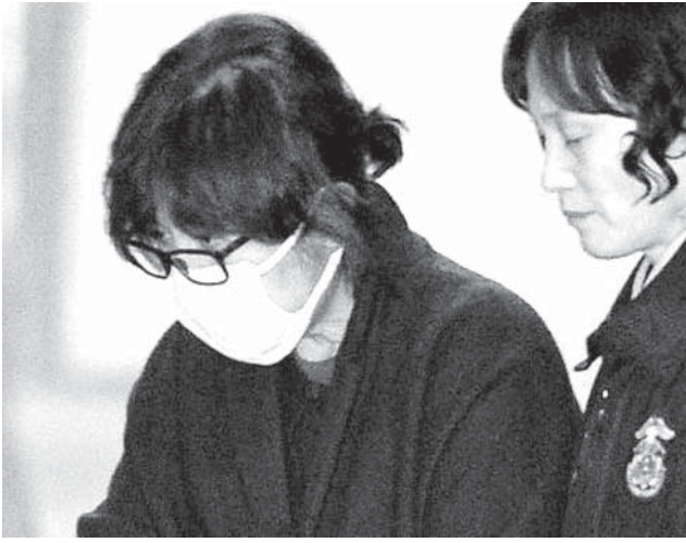
連行される崔順実容疑者

【ソウル共同】韓国の朴槿恵大統領の親友、崔順実容疑者の国政介入疑惑に絡み、韓国JTBCテレビは10日までに、崔容疑者が医療機関から朴氏のための注射薬などを処方され受け取っていたとの関係者の証言を伝えた。 薬はアンチエイジングが専門の医師が処方したという。薬が実際に朴氏に投与されたければ、大統領の健康管理に影響を与えた恐れがあり、韓国の医療法にも抵触する。また朴氏が、崔容疑者のスキンケアをしていた