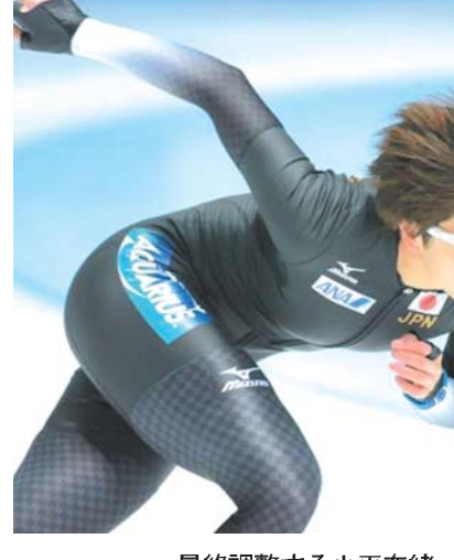
最終調整する小平奈緒

【共同】米大リーグは7日に各球団の幹部がアリゾナ州スコッツデールに集い、移籍市場が動き出した。レッドソックスでプレーした上原、田沢を含む150人以上がフリーエージェント(FA)になる。各球団が水面下で駆け引きを繰り返している。