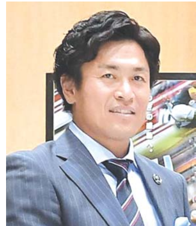
ワールドラグビーの殿堂入りを果たす見通しの大畑大介氏

【共同】ラグビーの元日本代表でテストマッチ69トライの世界記録を持つ大畑大介氏がワールドラグビー(WR)の殿堂入りを果たす見通しであることが10日、分かった。大畑氏が17日の表彰式に、WRから招待された関係者が明らかにした。