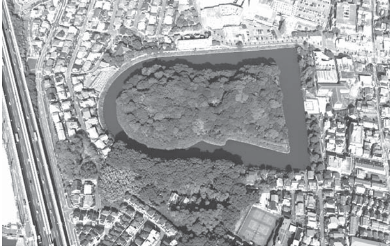
継体天皇陵とされる大阪府高槻市の今城塚古墳

【共同】真の継体天皇とされる大阪府高槻市の今城塚古墳(6世紀前半)の近くで石棺に使われていた石材(長さ110センチ)は、同古墳の石棺の一部だった可能性があることが分かった。10日、市立今城塚古墳歴史館が発表した。これまでも、石棺とみられる破片は数百点出土していたが、長さ197