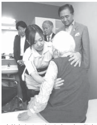
高齢者をベッドから車いすに移すのは介護者の体に大きな負担

【共同】高齢者の生活や介護作業を支援するロボットやIT技術の普及が進んでいる。最新の機器を見に行き、先端技術を活用している現場も訪ねた。介護で当事者のリスクが最も大きいとされるのが、ベッドから車いすに移るなどの「移乗」の動作。高齢者が転倒したり、介護者が腰痛に襲われたりする危険性がある。