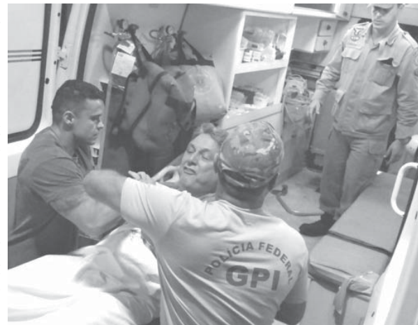
ガロチーニヨ元知事(右)が、伯国中を駆け回った。アントニオ・ガロチーニヨ(元知事)の乗った車(左)は、リオ州知事府の車(右)に追いついた。

刑務所移送時に醜態を晒す 16日に選挙違反で逮捕された、元リオ州知事のアントニオ・ガロチーニヨ氏が、17日夜、入院先の市立ソウザ・アギアル病院からリオ市バングーの複合刑務所に移送されるため、救急車に載せられる際に大立ち回りを演じ、伯国中でニュースになった。