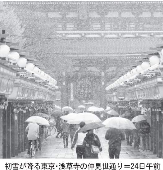
初雪が降る東京・浅草寺の仲見世通り=24日午前

関東甲信、大雪の恐れ 鉄道など交通機関に乱れ 【共同】日本列島は24日、上空に真冬並みの寒気が入った影響で東日本から北日本にかけて厳しい寒さに見舞われた。関東甲信では各地で雪になり、東京都心部でも初雪が観測され、積雪を