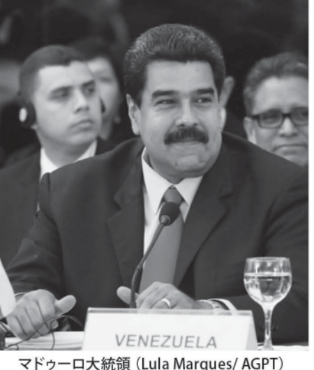
マドゥロ大統領

だが、9月以降も、ニコラス・マドゥロ大統領の罷免を問う国民投票を求めるための国民から