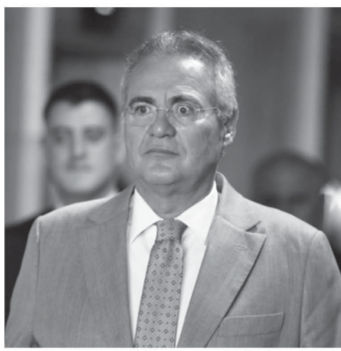
レナン・カリエイロス上院議長

レナン議長が被告となった1日、LJ作戦を指揮するパラナ連邦地裁は、上院本会議に招かれ