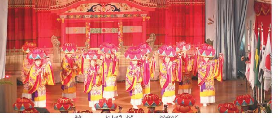
華やかな衣装で踊られた「女踊り」