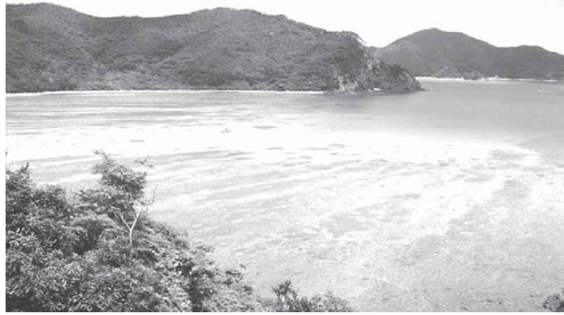
奄美大島のマネン崎

2年ぶりに日本へ一時帰国した私は、離伯間際になって、39年ぶりに奄美大島在住の家族に会いに行くことを思い立っていた。帰る支度も控えているため、わずか1泊2日の短い旅であった。 「思い立ったが吉日」と、早速電話をしてその旨を告げると、お互いが人生後半に差し掛かり、これが最後かとの思いをひそかに抱きつつ、大歓迎してくれた。 その時の電話でなにげなく、奄美大島出身の日系移民の情報がほしいことを短く伝えた。