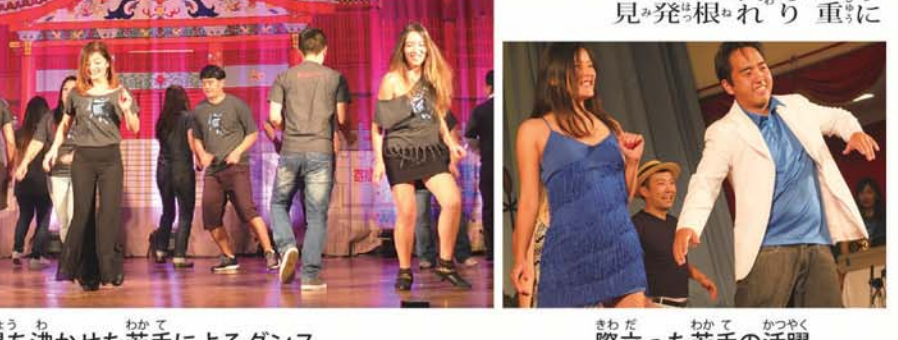
会場を沸かせた若手によるダンス