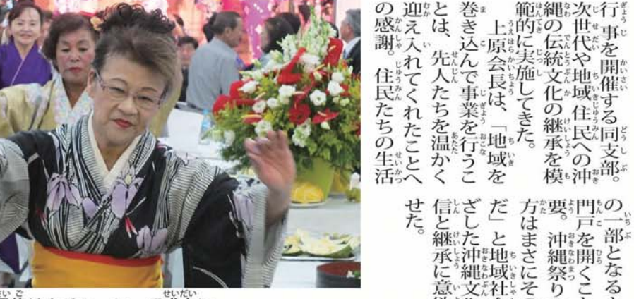
最後はカチャーシーで盛大に