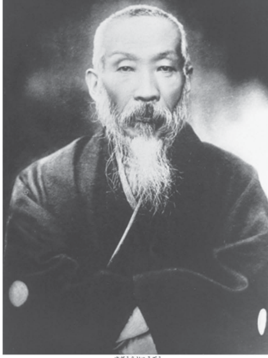
杉浦重剛 (1855 - 1924,)

死を伴うほどの責任、それも、明らかに天皇（立憲君主）に帰すべきでない責任を引き受けようとする、この勇氣に満ちた（天皇の）態度が、私の骨の髄までも揺り動かした。私はその瞬間、私の前にいる天皇が、個人の資格においても日本の最上の紳士であることを感じた。[1, p179]