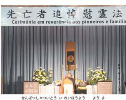
先覚者追悼慰霊法要の様子

と適応においても厳しい時代でありました。頼りとなるのは、働く意欲と勝たなければならぬという強い意思のみ、それでも、すべての困難を克服して、輝かしい歴史を書き上げてこられました。そうした全ての英雄的行動は、尊敬に余りあるもので、先覚者の汗と涙が、私達の人格形成に大きな影響を及ぼした事は間違いありません。 私達には、先輩が遺した勤勉さや敬老精神、忍