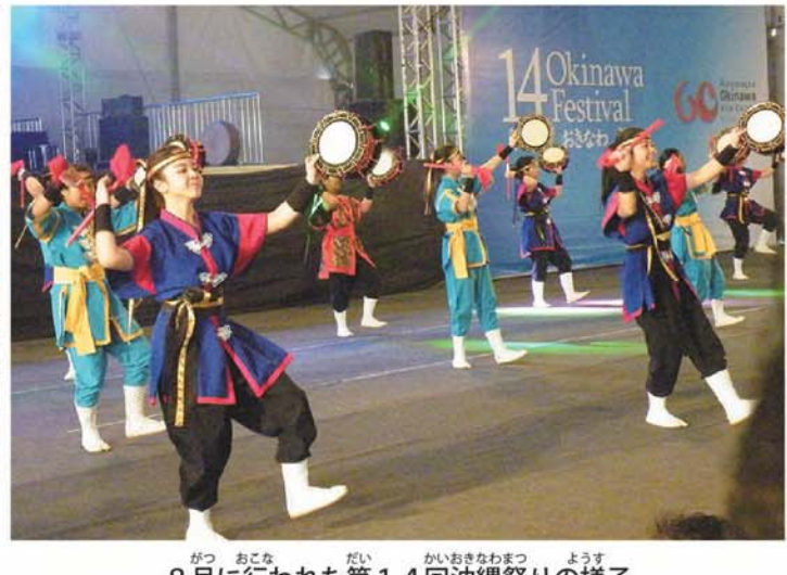
8月に行われた第14回沖縄祭りの様子