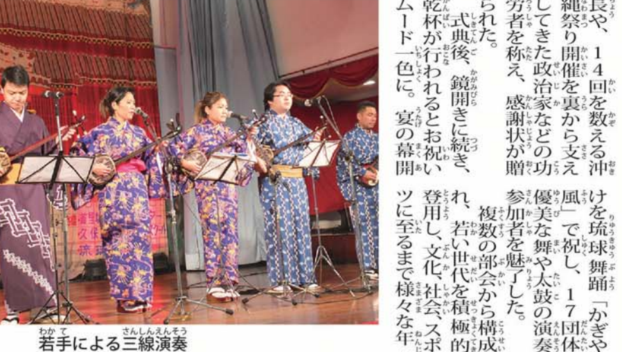
若手による三線演奏