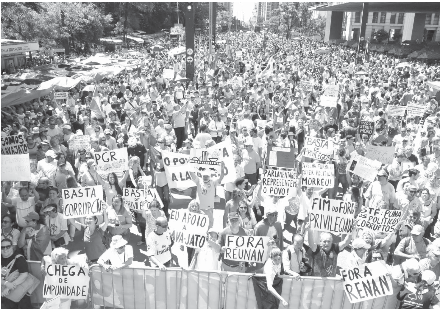
Vem Pra Rua 街車庫の前(MASP側)に集まった群衆