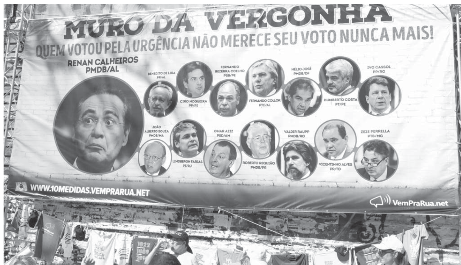
「恥の壁」と名付けられ、今回の標的とした政治家の顔写真が張り出された