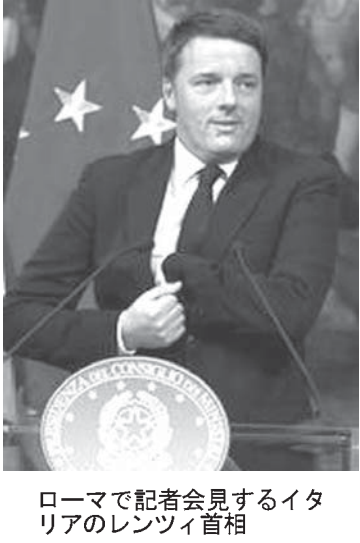
ローマで記者会見するイタリアのレンツイ首相

敗北を認め、辞意を表明した。今後政局が混乱し、金融不安の解消が遅れて欧州だけでなく世界経済に混乱が広がる可能性がある。既存政治を批判する新興の政治組織「五つ星運動」など主要野党は「首相の権限強化につながる」として反対運動を展開した。英国の欧州連合(EU)離脱や米大統領選のトランプ氏勝利で世界的合政治の勢いが増す