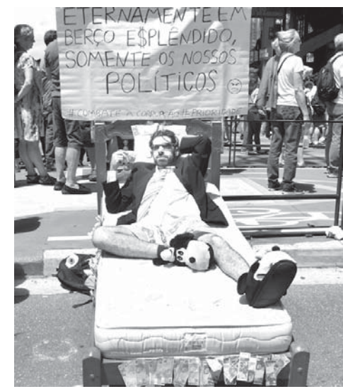
汚職を御座した「政治家だけが使える素晴らしいベットに永遠に横たわる」の図