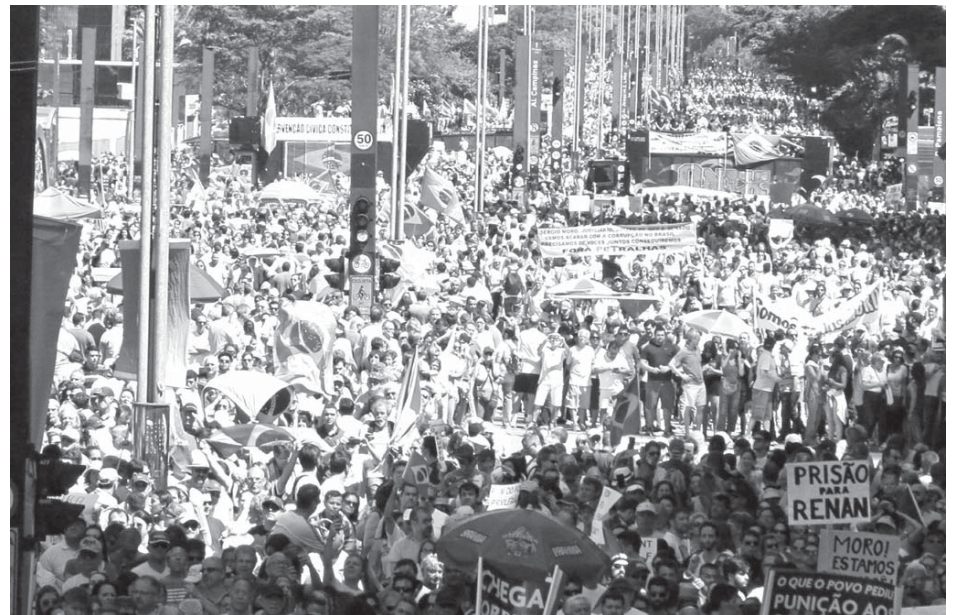
黄色、緑に身を包んだ人々が集まった様子