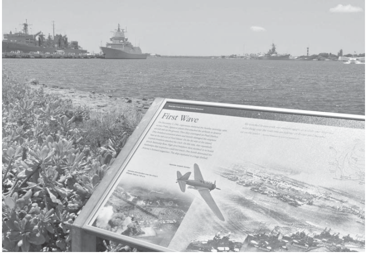
米ハワイの真珠湾と旧日本軍による攻撃を説明するプレート

【共同】安倍晋三首相は5日、今日26、27日に米ハワイを訪問し、オバマ大統領と日米開戦の発端となった地である真珠湾で戦争犠牲者を慰霊する意向を明らかにした。