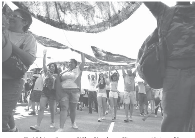
「汚職議会」と書かれた巨大な幕を持って楽しそうに行進する若者たち