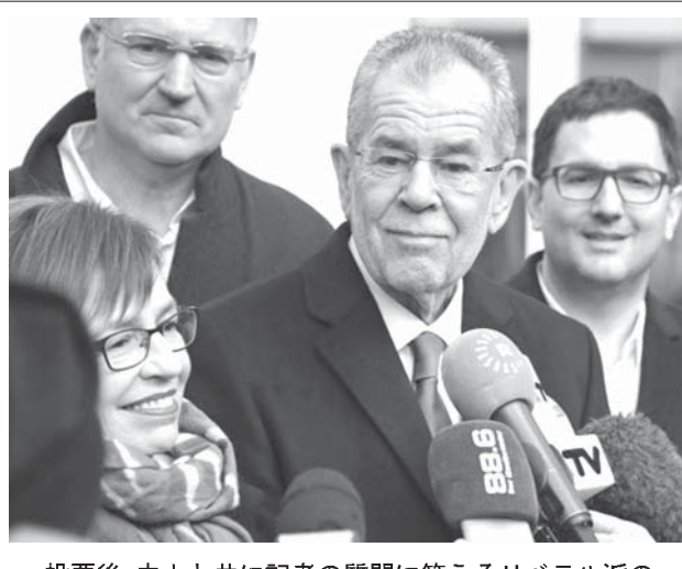
投票後、夫人と共に記者の質問に答えるリベラル派のファン・デア・ペレン氏(中央)

ア・ペレン氏(72)が、国家の右傾化を懸念する有権者の支持を得て勝利した。西欧諸国から「極右」と非難されてきた移民規制派の右翼勢力、自由党のホーファー(45)を破った。第3議院の議席を確保したファン・デア・ペレン氏は、オーストリアで経済が低迷、労働者らが失業への不安や、移民らの手厚い保護で生じる国民の負担増に不満を募らせ、ホーファー氏勝利の可能性も指摘されたが、欧州連合(EU)の旧西側諸国で初めて移民規制派の元首が誕生する事態とはならなかった。ホーファー氏は4日、敗北を認めた。