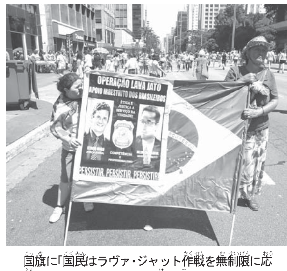
国旗に「国民はラヴァ・ジャット作戦を無制限に応援する」とのメッセージを張り付けてアピール