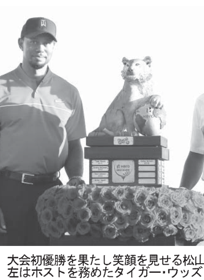
大会初優勝を果たし笑顔を見せる松山英樹(右)。左はホストを務めたタイガー・ウッズ

【共同】世界のつわもの、松山英樹は、松山英樹が5度目の受賞。最優秀新人賞はシヨーン・ノリス(南アフリカ)が選ばれた。