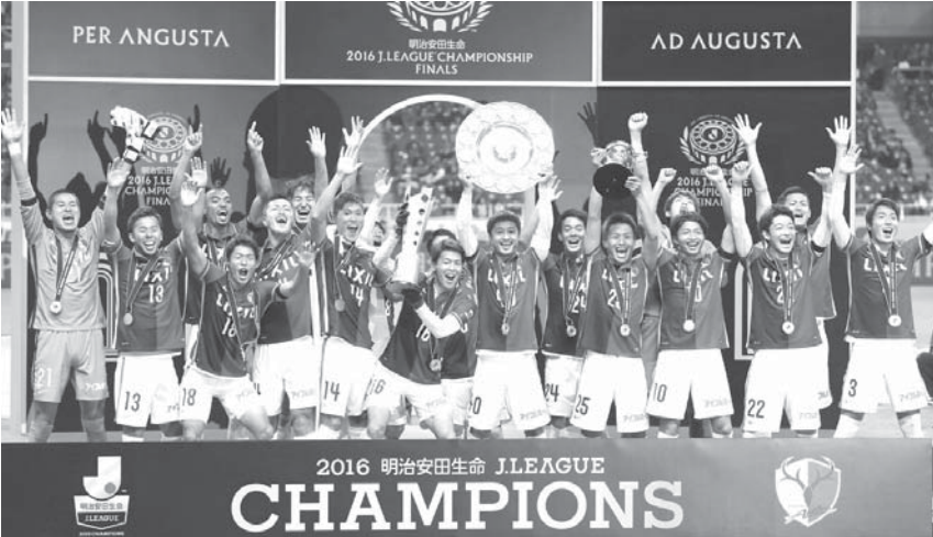
リーグ最多となる8度目の年間優勝を果たし、喜ぶ鹿島イレブン

【共同】J1年間王者を決める明治安田チャンピオンシップは3日、埼玉スタジアムでホームアドアウェイ方式の決勝 第2戦が行われ、年間勝ち点3位で第1ステージ優勝の鹿島が同1位、第2ステージ優勝の浦和を破り7年ぶり、リーグ最多の8度目の優勝を果たした。第1戦で敗れた鹿島は2-1で競り勝ち、