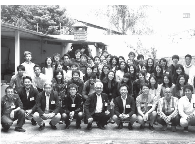
留学生の会参加者で集合写真