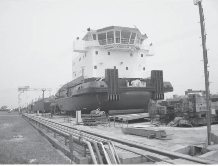
パラグアイ常設造船所で、進水間際の4千馬力級のフッシャーボート