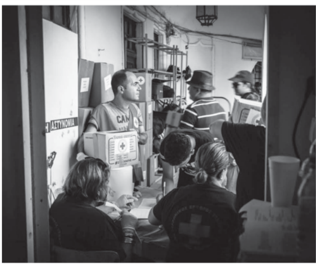
移民急増中のギリシャ (2015年、)