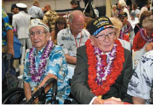
7日、米ハワイ州ホノルルで真珠湾攻撃から75年の追悼式典に参加した米退役軍人と関係者

【ホノルル共同】旧日本軍がハワイの真珠湾を攻撃してから75年となる7日朝（日本時間8日未明）、犠牲者を追悼し、攻撃を生き延びた米退役軍人をたたえる式典が真珠湾の米海軍施設で開かれ、攻撃が始まった午前7時55分（日本時間8日午前2時55分）に合せて約4千人が黙とうをささげた。