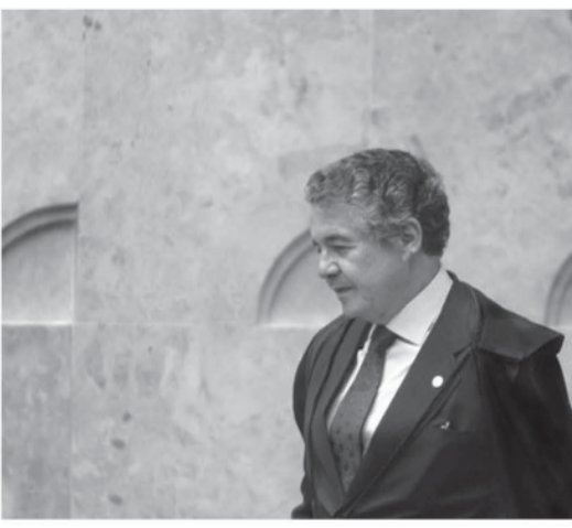
7日、暫定令を覆されたアウレリオ最高裁判事

7日の投票では、5日ナン氏の停職を薦めた。停職処分を覆す暫定令を出したが、その直後、最高裁のアウレリオ判事が「長官以外の判事の最後は報告官を務め、改めて」投票するはずのセウソ・デ・メロ判事が発言を求め、「レナン氏が裁判の被告にならなければ、この見解は与えないが、議長の職権は認めない」という意見を出した。アウレリオ判事は「この見解は与えないが、議長の職権は認めない」という意見を出した。アウレリオ判事は「この見解は与えないが、議長の職権は認めない」という意見を出した。