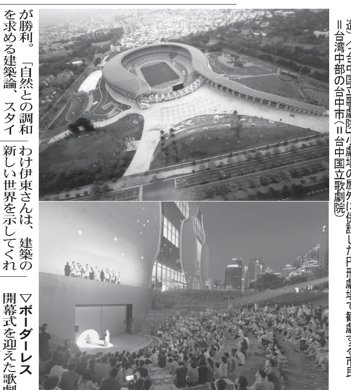
「台湾国立歌劇院」の1階ロビー。開演式を迎えて喜ぶ市民。台湾中部の台中市共同。