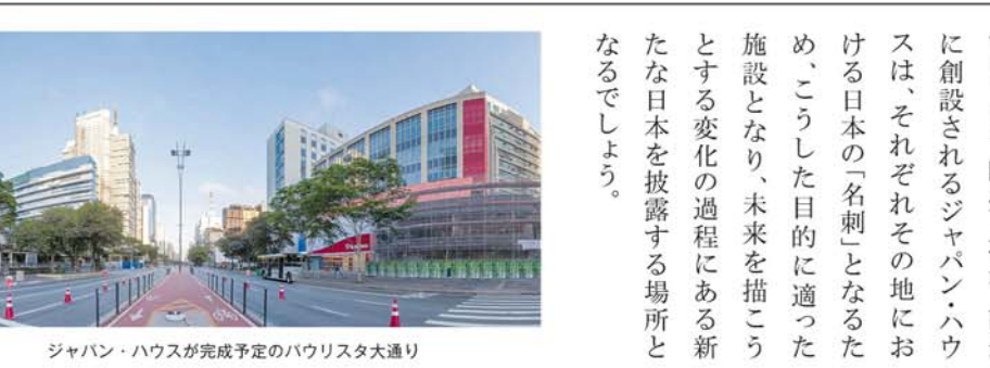
ジャパン・ハウスが完成予定のパウリスタ大通り

バンディランテス・グループからの支援 ジャパン・ハウスの準備段階を始め、落成時の取材や企画展、イベントの広報に至るまで、バンディランテス専門チャンネル「Arte 1」を