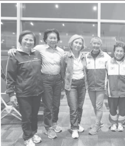
世界マスターズ陸上大会の帰路、中東のアブダビ国際空港にて撮影(11月15日掲載より)