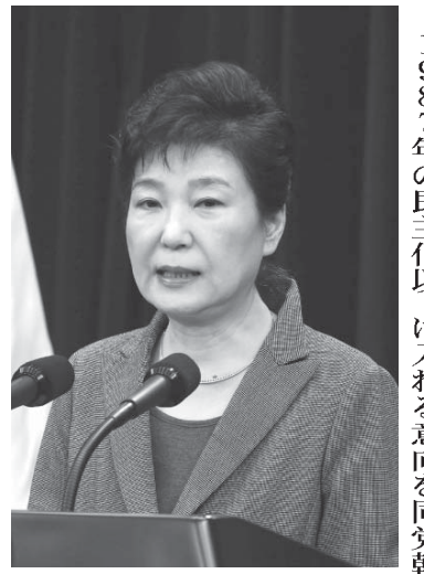
朴槿恵大統領

韓国大統領の弾劾可決は2004年の盧武鉉大統領に続き2例目。憲法裁判所に訴えられた朴氏は職務停止となり、黄教安首相が権限を代行。憲法裁判所が180日以内に罷免するか否かを判断する。朴氏の親友による国政介入疑惑は国家トランプの不在という異例の事態に発展、国政の混乱長期化は必至だ。賛成は8割弱に上り、与野党議員も約半数が賛成した。朴氏は閣僚らとの会場で「不徳」と陳謝したが、辞任時期には触れなかった。