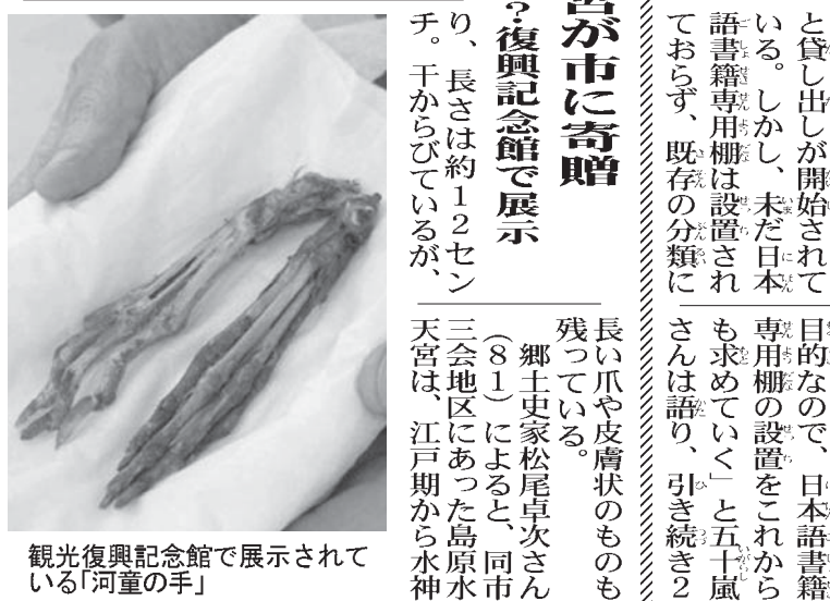
観光復興記念館で展示されている「河童の手」

「河童の手」水天宮が市に奇贈 江戸期から伝承？復興記念館で展示 【共同】島原市の「島原水天宮」で古くから受け継がれてきた「河童(かづぼ)の手」が市に奇贈され、島原城内の観光復興記念館で展示されている。江戸期から伝わる「河童の手」は、来館者が好奇の視線を注いでいる。河童の手は二つあり、ともに細長い指の骨状のものが4本ずつあり、