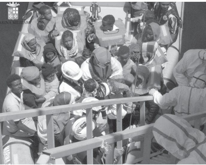
地中海でイタリア海軍に救出された難民の子供