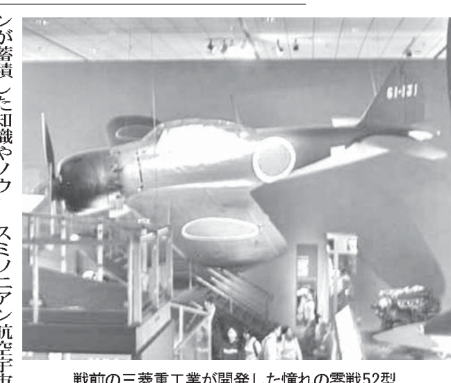
戦前の三菱重工業が開発した憧れの零戦52型

【ワシントン共同】世界の飛行機が展示されている米スミソニアン航空宇宙博物館が、岐阜県や同県各務原市と連携協定を結んだ。スミソニアン航空史を物語る貴重な史料、大幅に増床し2017年度中のリニューアルを予定する「かみかみ」が航空宇宙科学博物館（各務原市）と連携する。この連携は、航空史の発展に貢献する。スミソニアン航空宇宙博物館は、航空史の発展に貢献する。