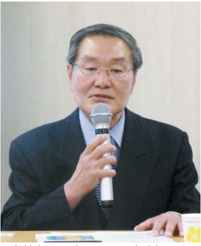
提言を直接見ると、高齢者が75歳以上で社会を支えるべきという。...