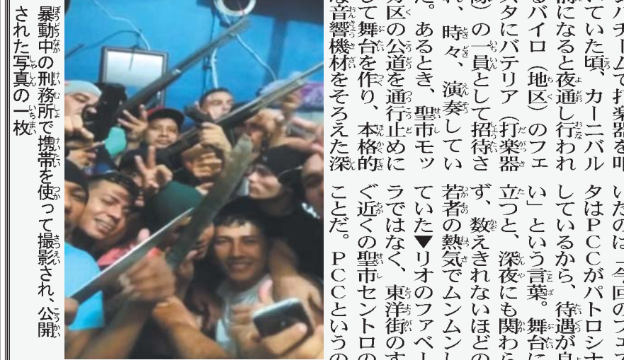
暴動中の職務所で携帯を使って撮影された公職者。...