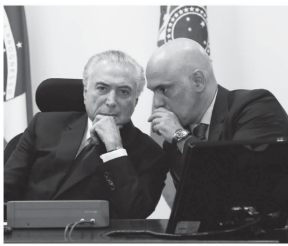
テメル大統領(左) モラエス法相(右)

5日付のニュースサイトは、昨年5月に囚人同士の抗争から14人が死亡した北東部のセアラ州の50人で、2位はペルナンブコ州の43人