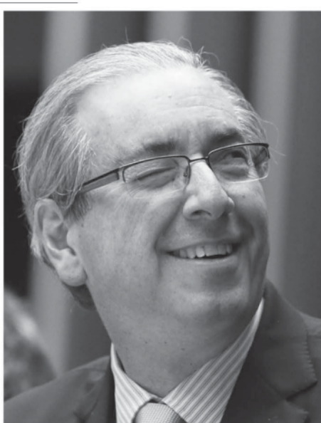
クーニャ氏

え書きがつけられている。これらの情報は、スイスの裁判所が「秘密口座の現金差し押さえを継続することを決めた判決文」の中で言及されていた。スイス検察庁は16年10月、クーニャ氏の口座に計2320万ドル(約16億9千万円)の振込みがあったこと