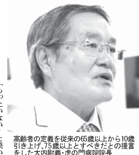
10歳引き上げ、75歳以上とするべきだとの提言をした。日本老年学会の代表者。

【共同】日本老年学会などは5日、高齢者の定義を従来の65歳以上から10歳引き上げ、75歳以上とするべきだとの提言をした。かつての高齢者と比べ健康状態が改善し「生涯現役」が時代の流れとなっている。少子高齢化が進み労働人口が減少している日本では、元氣な高齢者の活用が企業にもあり、社会の担い手としての期待が高まっている。