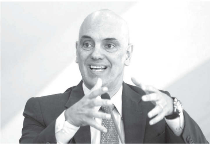
アレシャンドレ・デ・モラエス法相

これは、新年早々に同市の刑務所4カ所で暴動が発生し、60人の死者が出た事を受けて、受刑者を隔離し、安全性を高めるべく、A.M.州政府が緊急で使用する再開した刑務所での出来事だ。