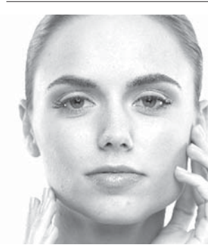
西欧人の代表例=女性モデル