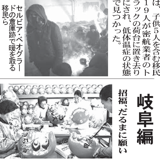
セルビアの首都ベオグラドでトランプ次期政権下で