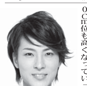
今どきの日本人若者像(その二) 演歌の貴公子=山内惠介