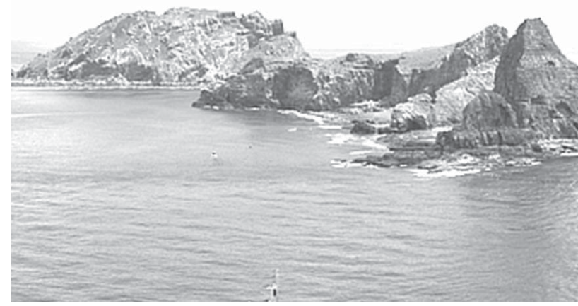
沖縄県・尖閣諸島