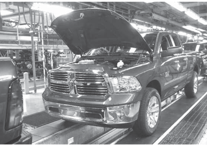
フィアット・クライスラー・オートモービルズの米シガン州の工場