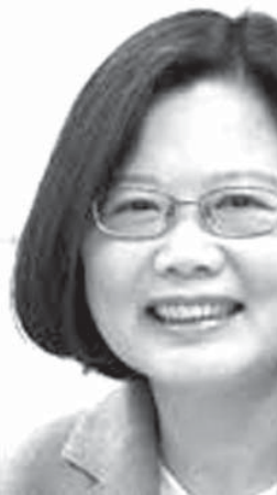
蔡英文総統がヒューストンに到着した台湾の蔡英文総統

【ワシントン共同】台湾の蔡英文総統は8日、米南部テキサス州ヒューストンで、同州選出のクルーズ上院議員と会談する。共和党内でトランプ次期政権下で