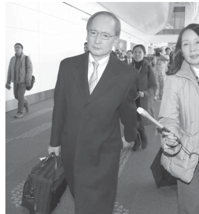
駐韓大使の一時帰国を象徴する少女像が設置されたことへの対抗措置として、長嶺安政・駐韓大使と森本康敬・釜山総領事を一時帰国させた。長嶺氏は10日に安倍晋三首相に現状を報告し、今後の対外方針について指示を受ける見通しだ。両国の対立が長期化するれば、北朝鮮対応のため強化してきた日韓や日米韓の連携に悪影響が出る懸念もあり、首相の判断が焦点となる。

慰安婦少女像設置に對抗 北朝鮮対応、悪影響懸念 【共同】政府は9日、韓国・釜山の日本総領事館前に慰安婦被害を象徴する少女像が設置されたことへの対抗措置として、長嶺安政・駐韓大使と森本康敬・釜山総領事を一時帰国させた。長嶺氏は10日に安倍晋三首相に現状を報告し、今後の対外方針について指示を受ける見通しだ。両国の対立が長期化するれば、北朝鮮対応のため強化してきた日韓や日米韓の連携に悪影響が出る懸念もあり、首相の判断が焦点となる。