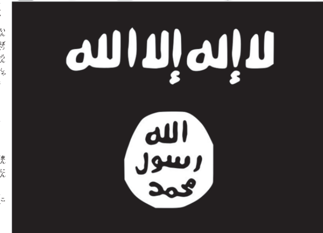
自稱イスラム国

しかし、「タークサイド」(悪い面)も明らかにあります。「お金の移動」が自由になった。それで、世界の大企業、大富豪は、普通にオフショアを使っていま「パナマ文書」は記憶に新しいですね。そして、大企業、大富豪は、「合法的に税金を払わなくていい」。さらに「人の移動」が自由になったことで、貧しい国から豊かな国(たとえば欧米)に、人が大挙して移ってきている。いわゆる「労働移民」です。結果、労働市場に毎年大量の「労働力」が供給され、元から住んでいる人たちの給料が下がって