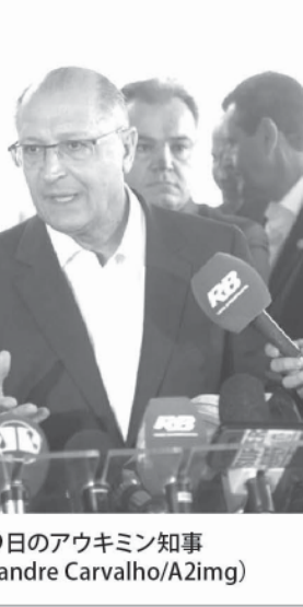
9日のアウキミン知事