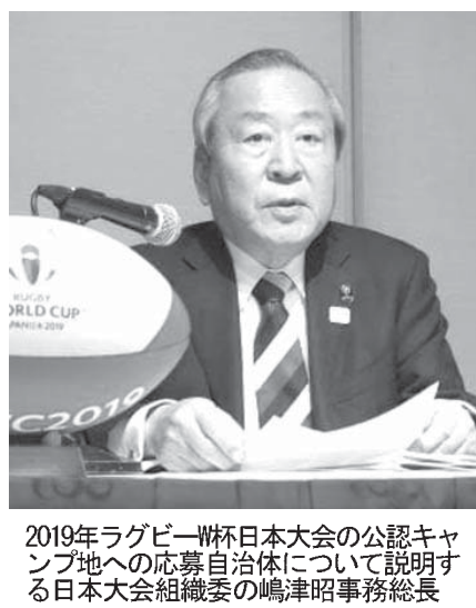
2019年ラグビーW杯日本大会組織委員長

【共同】ラグビーの2019年W杯日本大会組織委員長は、5070年代は16チームで争われた。昨季は56試合にとどまる。昨季は56試合にとどまる。昨季は56試合にとどまる。