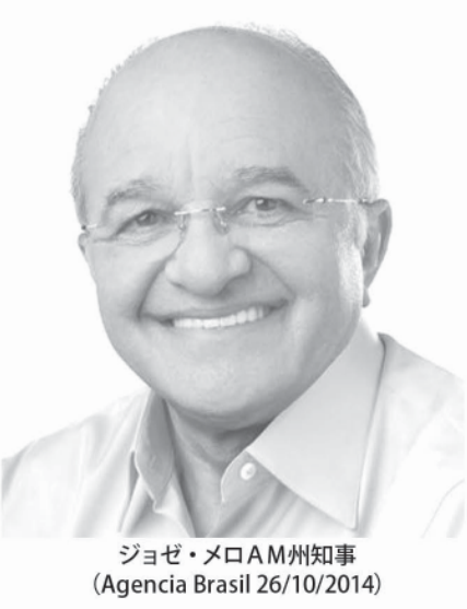
ジョゼ・メロAM州知事 (Agencia Brasil 26/10/2014)

シウヴァ氏の停職処分は、同刑務所内にいた囚人が書いた、同氏を告発する手紙2通が公開されたことが原因だ。手紙によると、同氏は犯罪集団「アマリア・ド・ノルテ」(FDN)から賄賂を受け取り、刑務所への薬物