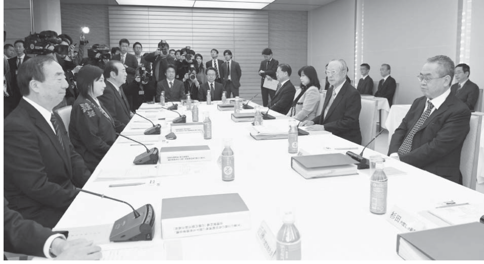
首相官邸で開かれた、天皇陛下の退位を巡る有識者会議の第8回会合=11日