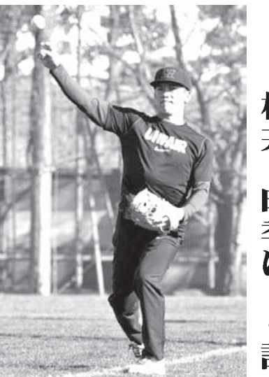
練習を公開した楽天・松井稼

【共同】楽天の松井稼頭央外野手が11日、東京市内のグラウンドで練習を公開した。昨季は56試合の出場で、24年目のシーズンに向けた練習を公開した。昨季は56試合の出場で、24年目のシーズンに向けた練習を公開した。