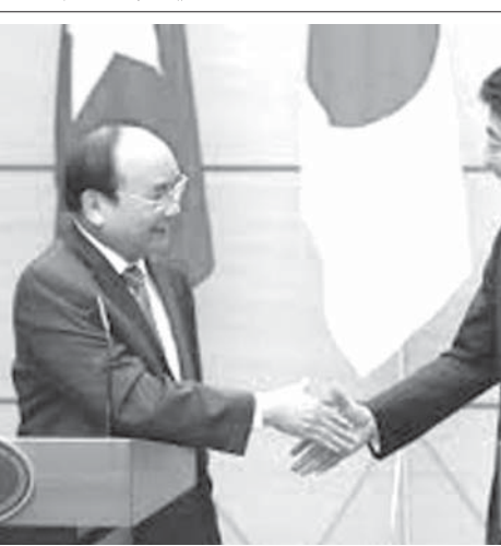
ハノイの首相府で会談後握手する、安倍首相とベトナムのグエン・スアン・フック首相

【ハノイ共同】安倍晋三首相は16日午後(日本時間)、ベトナムのグエン・スアン・フック首相とハノイの首相府で会談し、新造巡視船6隻