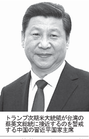
中国の習近平国家主席がトランプ次期米大統領に電話で挨拶する

【ワシントン共同】トランプ次期米大統領は米より蔡政権を厳しく監視するかもしれない。台湾紙、中国時報とのインタビューで、トランプ氏の「一つの中国」原則見直し発言も、同原則を受け入れていない与野の民主進歩党(民進党)政権にはうしろ半面、心配もある。トランプ氏は対中交渉のカードとして利用する姿勢が強い。中国が買収問題などで米台との貿易問題など米台との妥協に成功すれば、米台の政治的緊張は台湾の代議政治の研究者、台湾の懸念もある。蔡政権は米中台の三角関係の変化は台湾の命運を左右しかねず、蔡政権は米台との連携を深めつつ中国に刺激しないよう慎重に対応せざるを得ない。