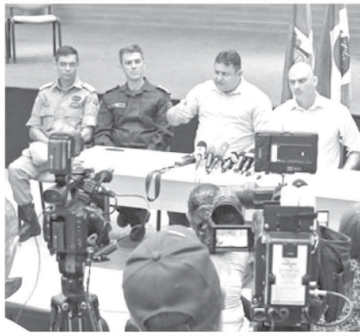
15日の会見で暴動の首謀者6人を割りだしたと発表する北大河州治安当局者達

この事件は、67人が死亡したアマソナス州、33人が死亡したロライマ州に続き、今年に入ってから3件目の大規模な暴動で、2017年が明けてわずか15日で達した数字を、2016年を通して発生した刑務所内の死者数372人(フォーリャ紙より、G1サイトでは392人と比較すると、事態の深刻さがより際立つ。