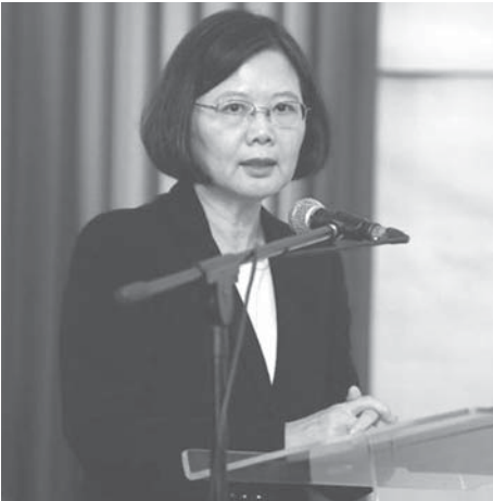
米中関係の苦慮に苦慮する蔡英文総統

【台北共同】台湾の蔡英文総統はトランプ次期米政権関係者とも交流し、中台は不可分の領土とする「一つの中国」原則へ