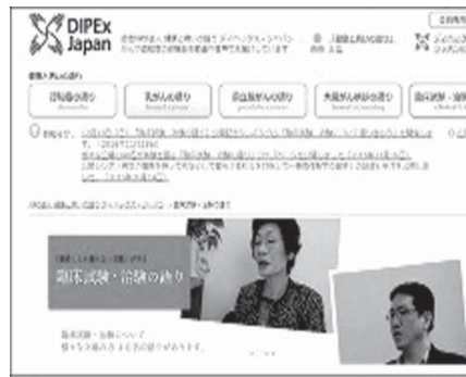
「臨床試験・治験の語り」のページ

【共同】ある日主治医から「新薬の治験（臨床試験）に参加しませんか」と言われたら、あなたはどう感じるだろうか。最先端の新薬を試せるかもしれない。だが予想外の副作用が出るリスクもある。経験者の話を聞いてよく考えたい。そんなとき見てほしい。研究者らが治験に関する40人の体験談をウェブサイトで公開した。一般の医療と治験とは何が違うのか。理解を深めてほしいとの狙いだ。 ▽偽薬の場合も サイトの名称は「臨床試験・治験の語り」。研究倫理が専門の武藤香織・東京大医学研究所教授が、さまざまな病気の体験談を集めて公開してきたNPO法人ディベックス・ジャパンと協力して作成した。実際に参加した人、中止した人、希望したが参加できなかった人など、さまざまな形で治験との接点があった 20〜80代の男性14人、女性26人にインタビューし、結果を動画や音声にまとめた。治験とは、通常10年以上かかる薬の開発の最終段階で、人に使用してもらって試験のこと。すべての薬は治験の後、国の承認を得て販売される。第1相から第3相まで3段階あり、対象を広げながら安全性、有効性を確認していく。治験に至るまでに安全性、有効性も一定の評価は得ているが、治験で十分な効果が確認できなかったり、新たな副作用が見つかったりする可能性がある。安全性や有効性の確認には別の物質との比較が必要で、比較対象は既存薬のこと。比較対象の有効成分を全く含まないプラセボ（偽薬）も、公平な比較のため医師も患者も、どちらの薬を飲んでいるかわからない状態で行う場合もある。参加して治療も受ける場合、治療費が免除されることが多い。治験で副作用が出た場合は、実施医療機関が適切に対応し、製薬会社から一定の補償が受けられる。 このように、本人の利益のために行う一般医療とは異なり、治験の基本は「将来の医学に貢献するボランティア」（武藤さん）だ。だから治験への参加・不参加は患者の自由で、途中でやめてもいい。他方、参加したくても性別、年齢や体調など、その治験の募集基準を満たしていなければ参加できない。比較対象は既存薬のこと。比較対象の有効成分を全く含まないプラセボ（偽薬）も、公平な比較のため医師も患者も、どちらの薬を飲んでいるかわからない状態で行う場合もある。参加して治療も受ける場合、治療費が免除されることが多い。治験で副作用が出た場合は、実施医療機関が適切に対応し、製薬会社から一定の補償が受けられる。