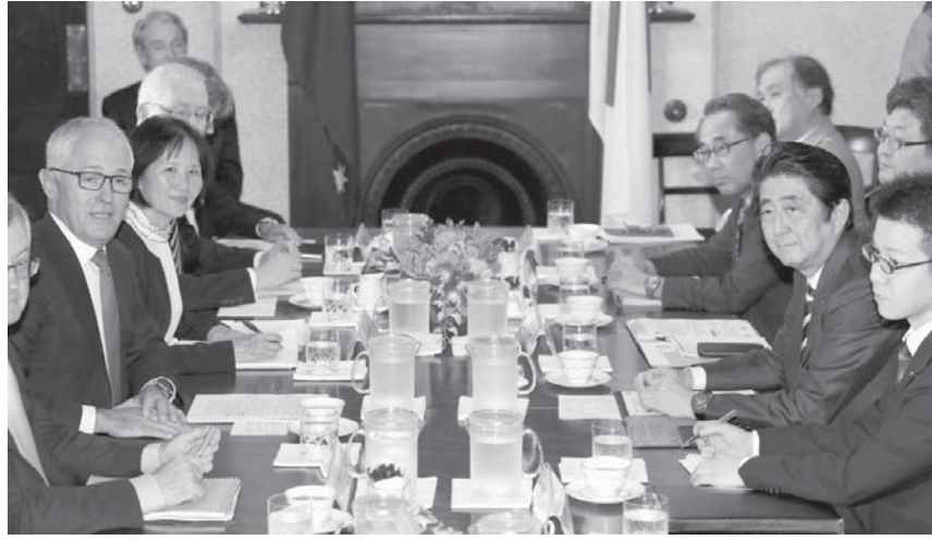
共同記者発表を終えたオーストラリアのターンブル首相(左)と安倍首相=14日、シドニー

シドニー、東京共同 安倍晋三首相が、日本と同様に米国と同盟を結ぶオーストラリアのターンブル首相と会談し、アジア太平洋地域における米国の役割の重要性を再確認した。