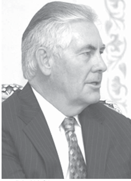
次期国務長官のレックス・ティラーソンさん

「尖閣有事の際、日本を守る！」と超重大発言したレックス・ティラーソン次期国務長官。この発言は、米中関係に重大な影響を及ぼす可能性がある。