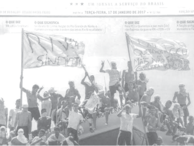
刑務所の屋根に上り旗を掲げ示威行為をする囚人たち (17日付フォーリャ紙より)