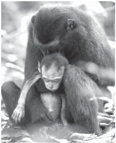
マカクサル=死んだ自分の子をつつまでもあやしている

【共同】自分の記憶や知識がどの程度正しいか客観的に判断する力をサルが持っているとの研究