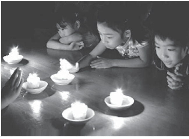
「火育」=火を扱うことは、人間の歴史の中で最大の発明のひとつ

【共同】正しい食を身に付けさせる「食育」は、教育用語としてすっかり定着したが、最近では、他にも「火育」「木育」「水育」と、さまざまな「育」が広がりを見せている。身近な単語の後に「育」を付けると勉強の強い印象がやわらぎ、子どもたちも親しみやすさを感じるようになった。大手企業が専門性を生かして開く、人気の体験学習を訪ねた。