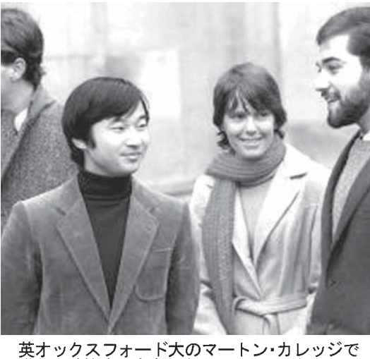
英外務省の記録によると、皇太子さまは1983年12月、オックスフォード大のマーティン・カレッジで友人と談笑する

宮の研究は当初の英語の問題(克服済み)を除いて順調」と評し、テニスが好きだった。ピオラとテロ、ピアノを弾くこと、紹介。「いくぶんシャイだが好感が持てる。若者、最初はためらうが、その後は打ち解ける」と説明した。