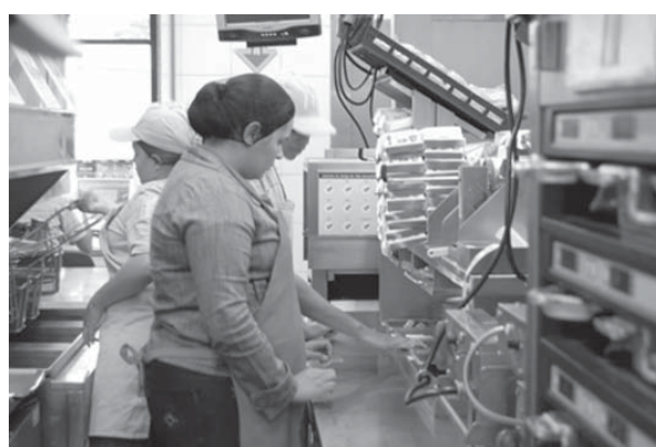
ブラジルのマクドナルドの調理現場

最大のマクドナルドが、両社が「領土」拡大を狙う標的になっていた。年間300億レアルと1600億レアルの売上をそれぞれ確保するBRFとJBSにとって、マクドナルドは重要な存在だ。