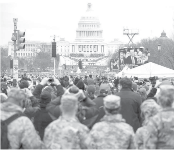
20日の米大統領就任式の様子

米国保護主義への警戒も TPP離脱はトランプ 確に表す行為だ。大統領の選挙公約の一つ「24日付フオリア紙」で、米国の保護主義は「短期的に見れば、国間交渉優先の姿勢を明らかに示す」とも農業部門には「警戒」を要する。TPP離脱は、肉の世界市場で事実上の競争状態にあり、TPPが予定通り発効していたら、その加盟国(予定では米国、カナダ、メキシコ、ペルー、チリ、日本、豪州、ニュージーランドなど12カ国)内の市場において、米産品が伯国産品より優位に立つはずだった。TPPが想定されていた12カ国での米産品は、関税を支払っていたにもかかわらず、農業生産物だけで570億ドルの輸出高をあげて、米産品がTPPに加盟してれば、それらの国々に低関税または無税で食料品を輸出できるはずだった。トランプ大統領は、TPPだけでなく、北米自由貿易協定(NAFTA)からの離脱も示唆している。米国、カナダ、メキシコではNAFTAゆえに域内関税がかからないため、日系の自動車会社はこれまで、人件費の安いメキシコに生産工場を建て、米国に輸出する戦略を採ってきた。だが、トランプ大統領は就任前にインターネット短文投稿サイト「ツイッタ」で「トヨタ自動車名指し」「米国に工場を建てろ。さもなければ巨額の関税を払わせる」と脅した。これはほんの一例だ。NAFTAが効力を失えば、カナダ、メキシコが伯国から穀物、食肉を輸入する条件は、米産品から輸入する条件と同様になりうる。短期的に見れば、伯国はトランプ大統領の政策