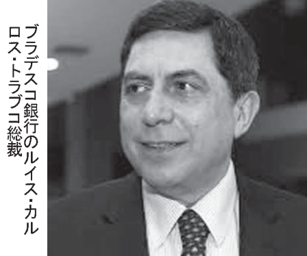
ブラジレスコ銀行のルイス・カルロス・トラブコ総裁

世界の平均は、前年の調査を3%ポイント上回る3.8%。同ポイントに達している。世界の平均は、前年の調査を3%ポイント上回る3.8%。同ポイントに達している。