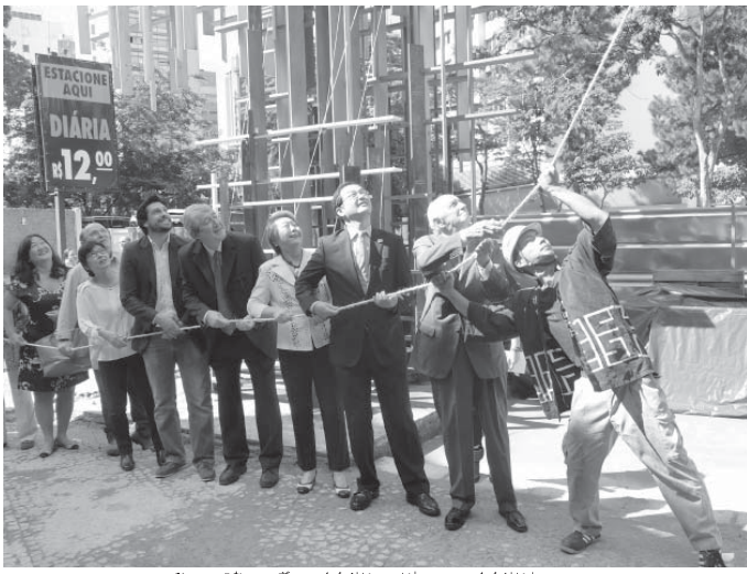
曳き綱の儀で完成を祝った関係者ら

聖市パウリスタ大通り52番に今年5月オープンを控える文化広報施設「ジャパン・ハウス」の「檜のファサード(建物の正面)」の完成を祝い、24日午前11時に上棟式が執り行われた。一週間降り続いた雨がバタリと止んで晴れ渡った青空のもと、足場が解体され、姿を現したファサードに感激が広がった。