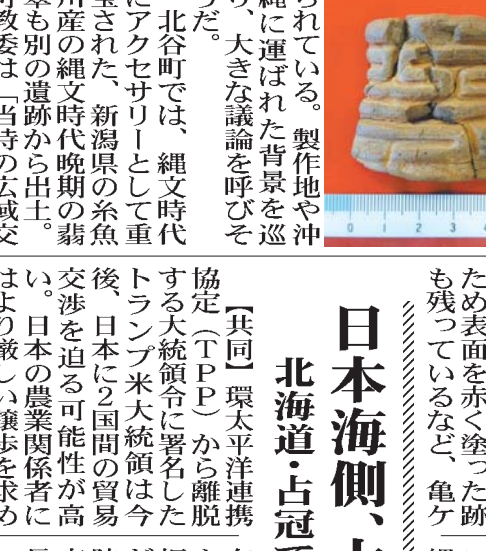
沖縄県北谷町の平安山原B遺跡で出土した亀ヶ岡式土器片。24日午後、同町教育委員会が明らかにした。

【共同】縄文時代晩期(3千〜2千数百年前)の東北地方を代表する「亀ヶ岡式土器」とみられる土器片が、沖縄県北谷町の米軍返還地にある平安山原B遺跡で出土した。24日、同町教育委員会が明らかにした。沖縄での発見は初めて。西日本でも出土は限られていた。製作地や沖縄に運ばれた背景を巡り、大きな議論を呼びそうだ。北谷町では、縄文時代晩期(3千〜2千数百年前)の東北地方を代表する「亀ヶ岡式土器」とみられる土器片が、沖縄県北谷町の米軍返還地にある平安山原B遺跡で出土した。24日、同町教育委員会が明らかにした。沖縄での発見は初めて。西日本でも出土は限られていた。製作地や沖縄に運ばれた背景を巡り、大きな議論を呼びそうだ。