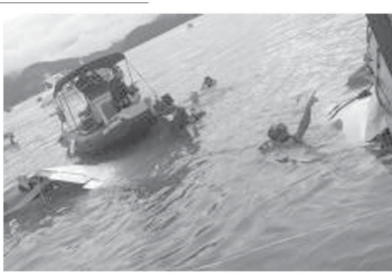
19日のテオリ判事の死亡事故現場

19日にリオ州パラチー沖で起きた、連邦最高裁のテオリ・ザヴァス判事らに乗せた小型機墜落事故を調査中の航空機事故調査予防センター(Cenipa)が23日、機内での録音内容は完全な状態で回復できたことを発表した。カルメン・オリシア最高裁長官は、テオリ判事の下でテオリ判事のラヴァ・ジャット作戦での報告付供述(デラソン・プレミアード)の検証作業を行っていた。録音の解析にあたった専門家によると、墜落時に海水に浸かったため、録音開始部分の痛みは激しかったものの、雑音を取り除く作業や聞き取り作業は成功した。それによると、操縦士は、小型機が煙をあげながら飛んでいたという。機内では、録音内容からは、飛行機の故障を心配するような言動や、機内がパニックに陥った様子は確認されていない。