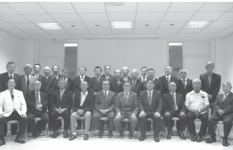
新体制となり記念撮影する役員ら

コレマツ氏は1919年、カリフォルニア州オークランドで日系2世として生まれ、41年12月の日米開戦でルーズベルト政権が大統領令により実施された日系人強制収容を拒否し逃亡、その後逮捕された。