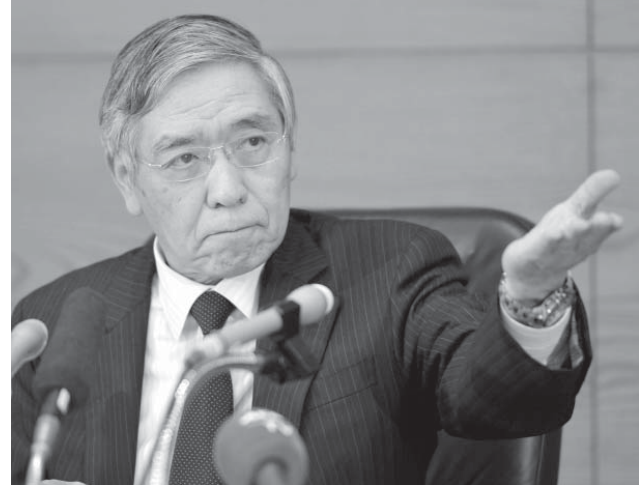
金融政策決定会合後に記者会見する日銀の黒田総裁