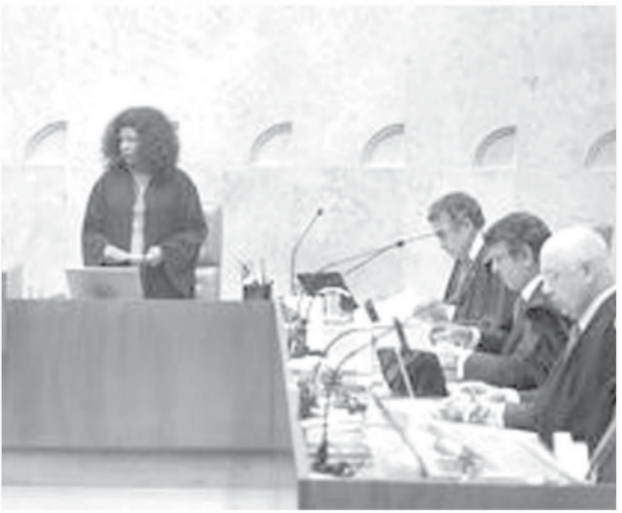
最高裁の様子

1月30日に行われた「プレミアード」の承認にLJでのオデレヒト社 続き、LJの後任報告官の報奨付供述(テラソン) 選びが注目されている。