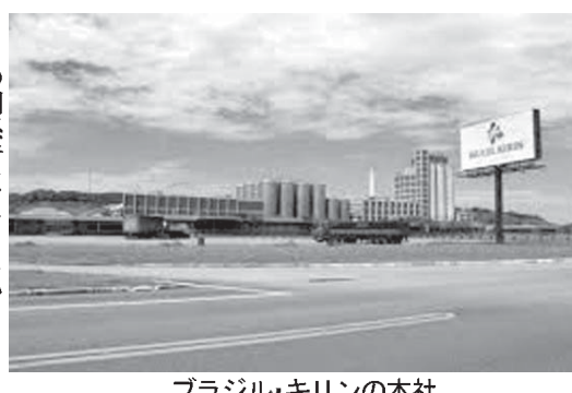
ブラジル・キリンの本社

ブラジル国内で、ビールスキンのデヴァアツサなどを展開する日本のキリンが、ブラジル国内事業から撤退する判断を下し、ハイネケンに事業を売却する方向で交渉を進めている。関係者によると、ブラジル・キリンの完全に売却する方向で、2月にも合意が発表される見通しだ。 ブラジル国内で、ビールスキンのデヴァアツサなどを展開する日本のキリンが、ブラジル国内事業から撤退する判断を下し、ハイネケンに事業を売却する方向で交渉を進めている。関係者によると、ブラジル・キリンの完全に売却する方向で、2月にも合意が発表される見通しだ。