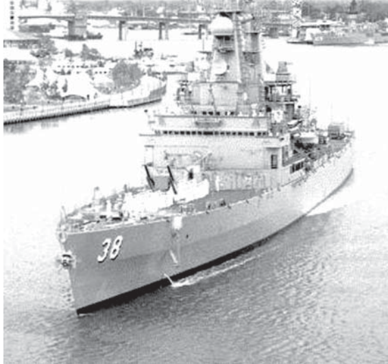
原子力ミサイル巡洋艦バージニア (USS Virginia, DGN/CGN-38)

アメリカは2つの海洋に挟まれた海洋国家である。海軍が世界最大であるだけでなく、その沿岸警備隊も「世界で12番目の規模を誇る海軍」であると言える。 米海軍はアメリカの第一級の戦略ツールであり、おそらく使われることのない核兵器よりもツールとしての有用性ははるかに高い。 米海軍は平時・戦時にかかわらず世界の公海にあり、海上交通路や主要海洋の choke point (戦略的に重要となる海上水路) を守っている。これによって実質的に世界の自由貿易体制を守っており、アメリカの同盟国たちに原油などのアクセスを保証している。 さらに米海軍は、内陸部への攻撃能力も担保している。 すなわち、イラク、アフガニスタン、そしてソマリアへの爆撃は、インド洋やアドリア海における艦隊からも行われたというのだ。 歴史的にみれば、アメリカのこのような立場は極めて特殊なものだったわけではなく、アテナイ、ヴェニス、そして大英帝国などはすべて偉大な世界的海洋国家であった。これにオランダやポルトガルを加えてもいい。海洋国家というのは、もちろん例外はあるが、一般的にドイツやロシアのようなランドパワー国家と比べて健康的であったという事は言える。 地上部隊は侵攻のために使われるのだが、艦隊は寄港訪問したり貿易を促進したりするものだからだ。 また、海軍は陸軍のように外国の領土を占領しない。陸軍は予備不能の事態に備えることが求められるが、海軍(と空軍)は毎日に戦力投射を行っているのだ。 アメリカはベトナムやイラクで不必要な戦争を行ってしまったのかもしれないが、アメリカのパワーそのものは減少しておらず、この主な理由は海軍と空軍の規模の大きさのおかげである。 他にも、米海軍はアメリカに、地域の紛争に際しては対外政策においても失策を少なくできるだろう。