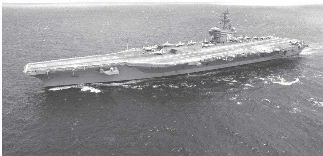
航空母艦ロナルド・レーガン (USS Ronald Reagan, CVN-76,)