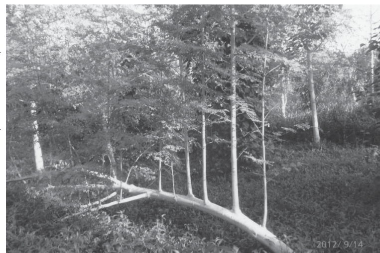
樹木した木自体からも分枝して、力強く成長するモリンガ

健康植物として注目を集めるモリンガの講演会が11日午前10時から、宮城県人会(Rua Paraguassu, 152, Liberdade)で行なわれる。進行