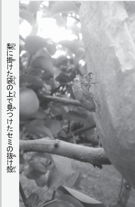
梨に掛けた袋の上で見つけたセミの抜け殻

「1月31日早朝に梨の収穫作業をしている最中に、梨に掛けた袋の上にセミの抜け殻を見つけた」とのこと。比較的に日本に近い気候を持つラーモス移住地だが、「日本と違って、蟬の種類と生息数が桁違いに少ないように