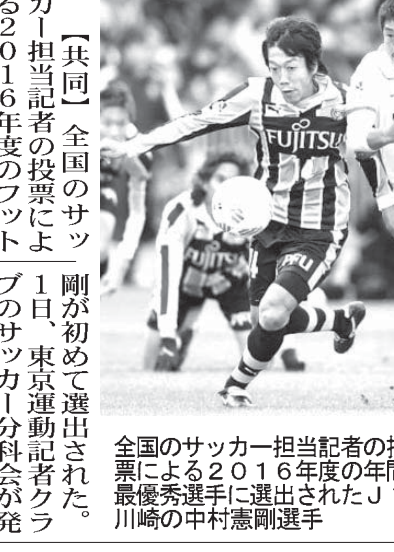
剛が初めて選出された。1日、東京運動記者クラブのサッカー分科会が発表

【共同】全国のサッカー2016年度の最優秀選手に、東京運動記者クラブのサッカー分科会が発表