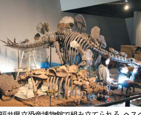
福井県立恐竜博物館で組み立てられる、ヘスペロサウルスの実物全身骨格。1日午前、福井県勝山市

「(6)が「鬼は外、福は内」と掛け声を出す。猫の舞台衣装などに身を包んだキャストの出演者が、手に持った升から殺付きの落花生をまいた。落花生は約5千袋(約100キロ)が準備された。