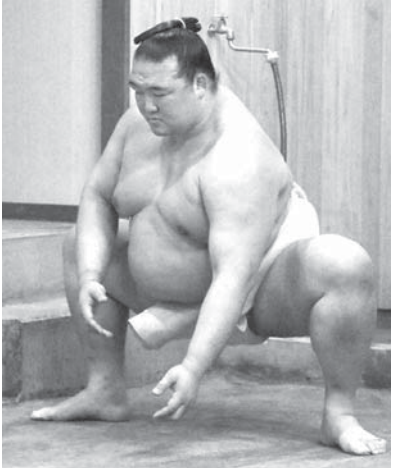
春場所に向け、稽古を再開した新横綱稀勢の里

部屋で稽古を再開した。初優勝した初場所後は諸行事で多忙だったが、体調もだいぶ戻った。いつか「しっっかり体をつくる」と語り、稽古再開を話した。稀勢の里は、春場所に向け、稽古を再開した。初優勝した初場所後は諸行事で多忙だったが、体調もだいぶ戻った。いつか「しっっかり体をつくる」と語り、稽古再開を話した。