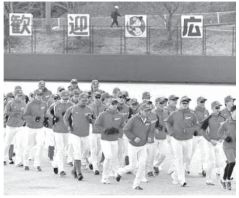
ランニングする広島選手ら

【共同】プロ野球の11球団が1日、宮崎と沖縄の両県でキャンプインした。昨季日本一の本拠地、宮崎県宮崎市に集まり、練習を開始した。日本時間2日未明にスタートを切る。