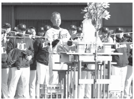
キャンプの無事を祈願する西武の辻監督ら