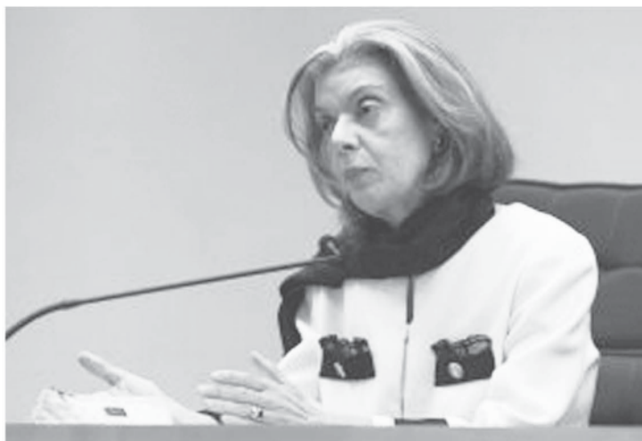
カルメン・ルシア最高裁長官

最高裁、議会は共に1日、今年開始の日となったが、共に重要な決定を求められた1日だった。