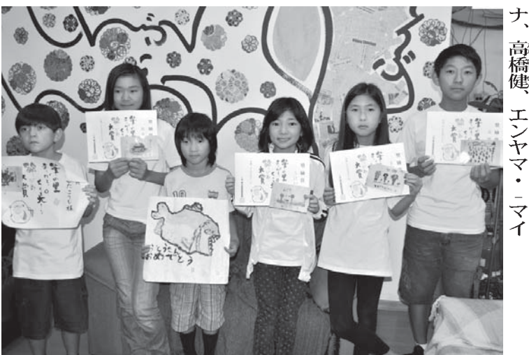
受賞者のみなさん

日本文化に親しむ場として、絵手紙を取り入れて、聖市のサウデ日本語学校から、多くの生徒が日本のコンクールで賞を果した。賞状を手にした生徒らが24日に来社し、喜びの声を届けた。応募したのは「第20回筆の里」があり、その中、熊野筆で有名な「大賞」。