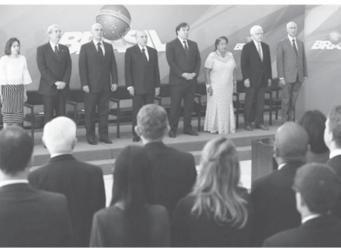
3日の就任式の模様

2日発表の新閣僚は、昨年11月のジェデル・ヴィエイラ・リマ氏辞任以来、空席となっていた大統領府総務長官にアントニオ・インバサイ氏(PSDB)、大統領府事務局長官にモレイラ・フランコ氏、人権局長官にルイス・ヴァロイス氏(PSDB)だ。大統領府事務局は現在の大統領府総務室の前身で、15年11月に廃止されていた。人権局長も16年5月の統合で廃止されていたが、今度の復活で、各々の長官は大規模の扱いとなる。中でも注目されるのはモレイラ氏の人事だ。これまで公私投資プログラムの局長を務めていた同氏は、エリゼウ・パジオリヤ官房長官やジェデル氏と並んでPMDBの二つの矢と称されており、PMDBの大統領府の信頼が厚い人物として知られている。今回の人事で、よりその重要性を増すことになる。