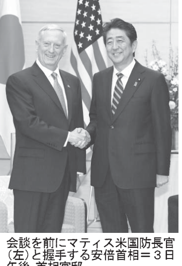
官邸で会談した安倍首相（左）と米国防長官マティス氏（右）。

【共同】安倍首相は3日、来日したマティス米国防長官と官邸で会談した。マティス氏は、中国が領有権を主張する沖縄県・尖閣諸島について、米国による対日防衛義務を定めた日米安全保障条約第5条の適用対象とする立場を確認し、米国の核の傘による抑止力の提供で日本の安全を保障する「拡大抑止」を含め、「米国の同盟上の関与を再確認する」とも述べた。首相は「日本は防衛力を強化し、自ら果たし得る役割の拡大を図っていく方針だ」と強調した。