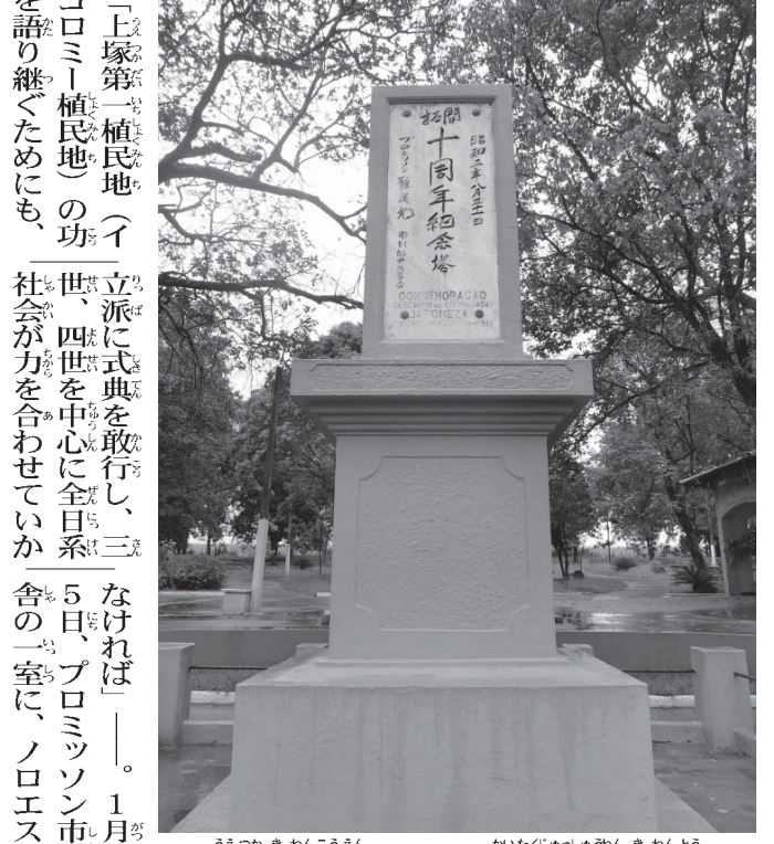
上塚記念公園にそびえる開拓110周年記念塔

いよいよ目前に迫った移民110周年。昨年1月に薨去された三宮宮殿下が移民50周年を祝し、皇室として初めて母国の地を踏まれ、聖州聖地を御訪問されたのを最後に半世紀の歳月が流れた。そんななか、移民の故郷とも言えるノロエステやパウリスタ沿岸から、皇室の方をお迎えしたいとの切なる声が上がっている。なかでも特に期待が高まるプロミソン、マリリアの2都市を訪ね、110周年に向け動き出す現地の日系社会の「今」を取柄とした。