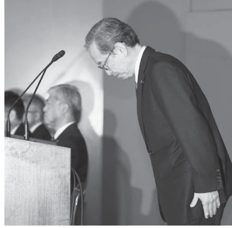
予定で記者会見を予定していた東芝の社長が、14日午後、東京都港区の本社で記者会見を開き、決算発表の遅れを謝罪した。

【共同】東芝が原発事業に絡む巨額損失を受けて昨年末時点で債務超過に転落した。東京電力福島第1原発事故後、厳しさを増した原発への風当たりを直視せず、拡大路線を突き進んだ判断が裏目に出た。原発事業の再編構想もさやかされるが、追加損失の恐れも抱えて現実味に乏しい。決算発表を巡っては混乱も生じ、名門企業は迷走の度合いを深めている。