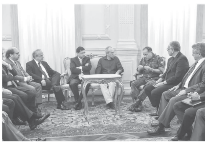
アルトゥンギES州知事は、保安対策会議を招集した

ストの最中に外出した行動に反逆罪に問われている。軍警は703人で、司法命令に従わなかったため。