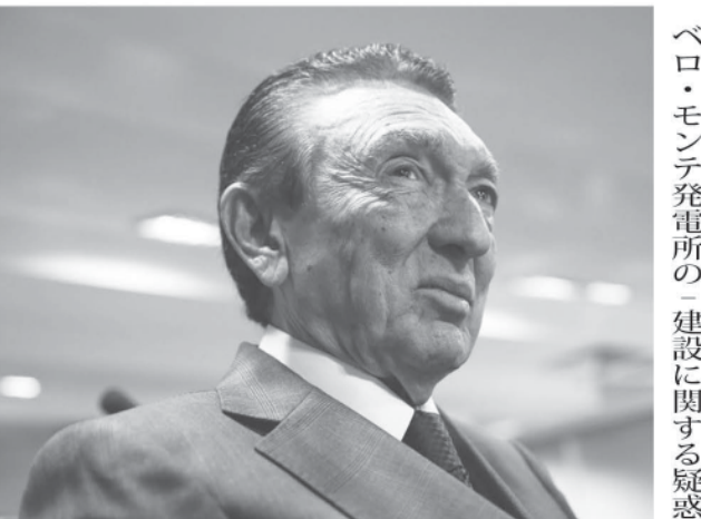
エジソン・ロボン氏

ベロ・モンテ発電所の建設に関する疑惑はLJの捜査中に浮上したものだ。連邦最高裁のLJ報告官だった故テオドール・ザヴァスキ判事は、電力事業での不正を(ベロ)ロボン上院議員のベロ・モンテ中心のLJとは切り離してエレットロと呼んでおり、同氏生中から現LJ報告官のエジソン・フアン判事に担当が振り分けられていた。今回、家宅捜索の対象となったのは、ロボン上院議員の息子マルシオ氏と、元パラ州選出の上院議員ルイス・オタヴィオ・オリヴェイラ・カンボス氏(PMDB)の2人に関する情報だ。2016年にアンドラーデ・ダチエ