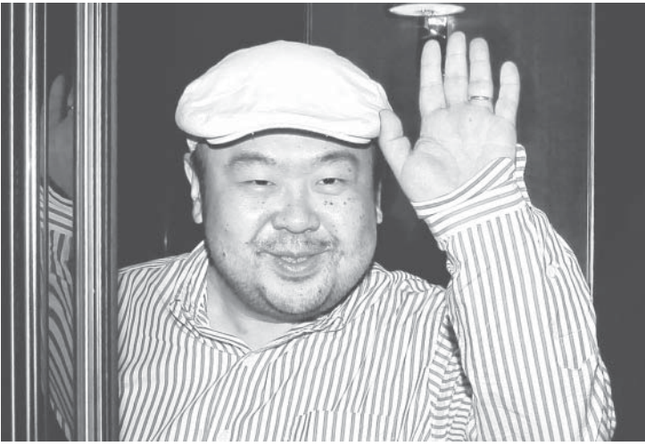
北朝鮮の金正男氏殺害事件は多くの謎が残る

【共同】北朝鮮の金正男氏殺害は、同国の数少ない友好国であるマレーシアで起きた。身の危険を意識しながら、一瞬の隙を突かれた正男氏。依然多くの謎が残る事件の裏には、複雑に入り組んだ各国の思惑も潜む。正男氏の後盾とされてきた中国、北朝鮮と対立する韓国、重大な関心を寄せる米国。国際社会の水面下の駆け引きは、事件の真相解明にも影を落とす。