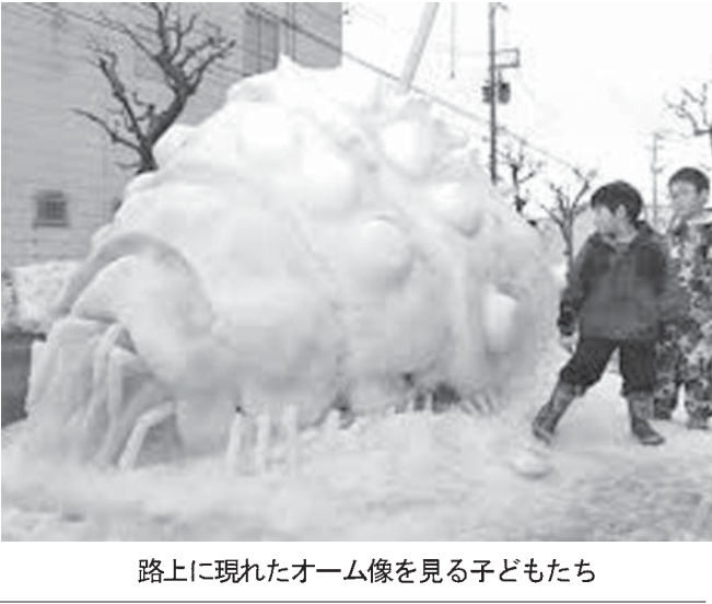
路上に現れたオーム像を見る子どもたち