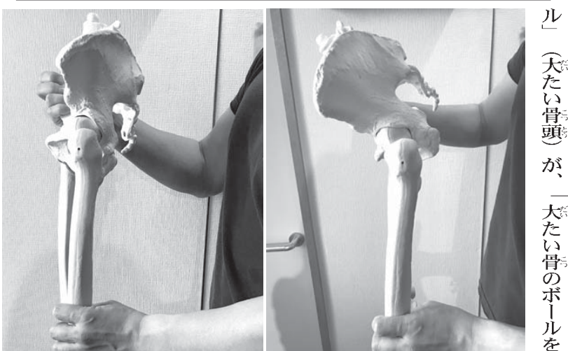
骨盤の動きの画像(間接がむき出しになった状態、かぶった状態)

【生命線は股関節】 先日、「腰痛」をテーマにした健康バラエティ番組に出演しました。スタジオのモニターにVTRが流れ、数人の整形外科医たちが次々と登場してインタビューに答えていました。各々が「85%の腰痛は原因がわかっていません」と、お手上げ的な表情でコメントしていました。 「原因が分からないのは画像検査の結果だけ見て、姿勢分析や下半身の機能テスト、触診をしていないからだろう」と発言していた骨の先端にある「ボール