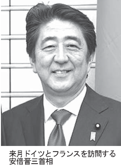
来日ドイツとフランスを訪問する安倍晋三首相

【共同】安倍晋三首相は3月19日、21日の日程でドイツとフランスを訪問し、メルケル首相とオランド大統領と個別に経済連携協定(EPA)の交渉する方向で調整に入