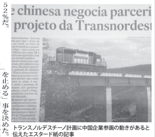
Transnordestina 計画に中国企業参加の動きがあると伝えたエスタード紙の記事

関係は良好とは言えず、今年1月には、連邦会計検査院(TCU)が工事進行を脅かす、不正な点の数々が解消されるまで、同計画への公金投入