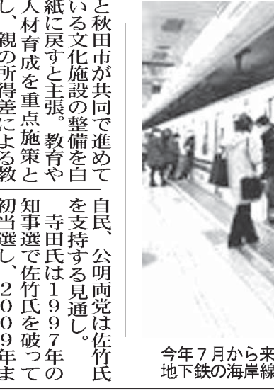
今年7月から来年3月まで中学生以下が無料になる神戸市営地下鉄の海岸線

【共同】元秋田県知事秋田知事選、現職と対決へ 補すると表明した。これまで出馬表明したのは3選を目指す現職の佐竹敬久氏(69)だけだ。知事経験者としての対決。寺田氏は「無競争は良くない」と、県民に選択の自由を求めたいと述べた。