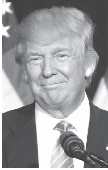
トランプ大統領(2016年8月31日、アリゾナ州フェニックスにて)

【ワシントン共同】トランプ米大統領は15日、イスラエルのネタニヤフ首相と米ホワイトハウスで初会談した。記者会見でトランプ氏は中東和平交渉について、パレスチナ国家を樹立しイスラエルとの共生を目指す「2国家共存」にこだわらない姿勢を示した。これまでの米政策を転換する姿勢を鮮明にした。パレスチナが反対するイスラエル大使館のテルアビブからエルサレムへの移転に意欲も見せ、注意深く状況を見ていると表明。両氏はイスラエルと敵対するイスラムの核開発阻止への協力でも一致した。