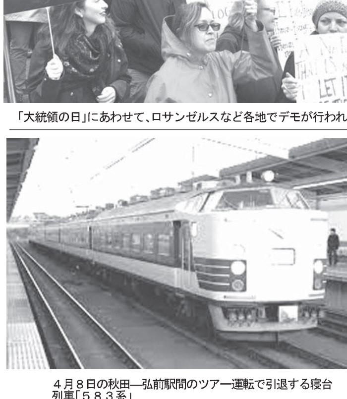
「大統領の日」にあわせて、ロサンゼルスなどでデモが行われた

【ニューヨーク共同】米国で歴代大統領の功績をたたえる祝日「ブレイジデンツデー」の20日、ニューヨークやロサンゼルスなど全米各地で反トランプデモが相次ぎ、参加者は「私の大統領ではない」と書かれたプラカードを持って行進した。米メディアによると、デモは少なくとも25都市であり、計1万人以上が参加した。ニューヨークのセントラルパーク近くのトランプ・インターナショナル・ホテル周辺に集まった数百人の参加者は、イストラム7カ国からの入国禁止を定めた大統領令やメキシコ国境の壁建設計画に抗議し、「規制にノー、壁にノー」などと声を上げた。