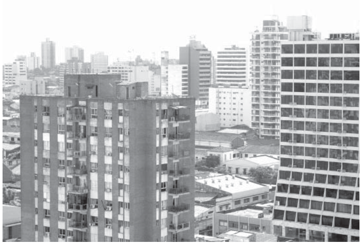
首都アスンシオン

パラグアイ中央銀行発表の公式指数は堅調な経済の増進を示すものだが、最近の国際労働機関・ILOの報告書ではパラグアイ労働者の就職事情は決して向上しているとは言えない。同「ラ米及びカリブ諸国2016年度雇用事情」は、昨年と同地域諸国の失業率は急激な増加を記録したと指摘している。かかる情勢は深刻な経済不況に悩むブラジルやアルゼンチン等ではいざ知らず、パラグアイの場合、2015年度は3%の失業率に達している。