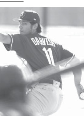
初めて打撃練習に登板したレンジャーズのダルビッシュ