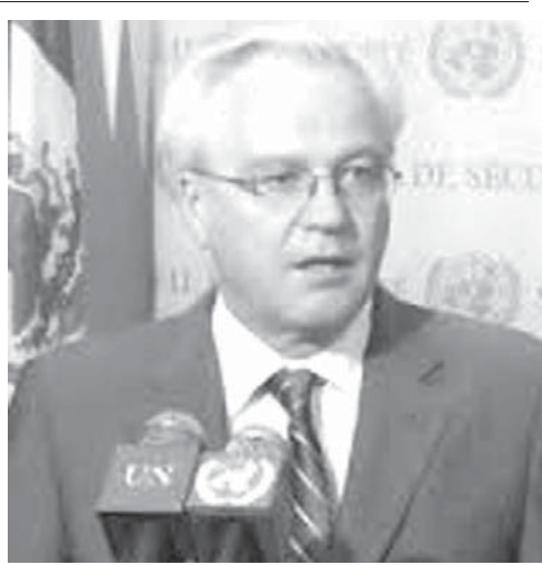
急死したロシアの国連大使チュルキン氏

【共同】国連内でこれほど欧米諸国を振り回した外交官はいない。20日、ニューヨーク市内で急死したチュルキン氏(64)はロシアの国連大使を10年以上務め、国連安全保障理事会の「影の仕切り役」として欧米諸国には手ごわい存在であり続けた。国連常任理事国のロシアが持つ決議案への拒否権という「伝家の宝刀」を最大限に活用し、シリア情勢などで対立する欧米の外交官から非難を浴びることも多かったが、毒舌をちりばめた反論と安保理の議事進行を知り尽くした老練さで独特の存在感を示した。