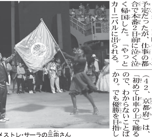
メストレ・サーラの三曲さん