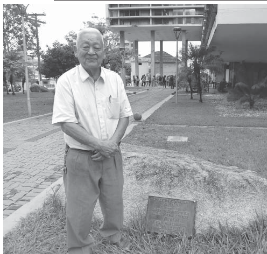
殿下の足跡を訪れた新宅名譽会長