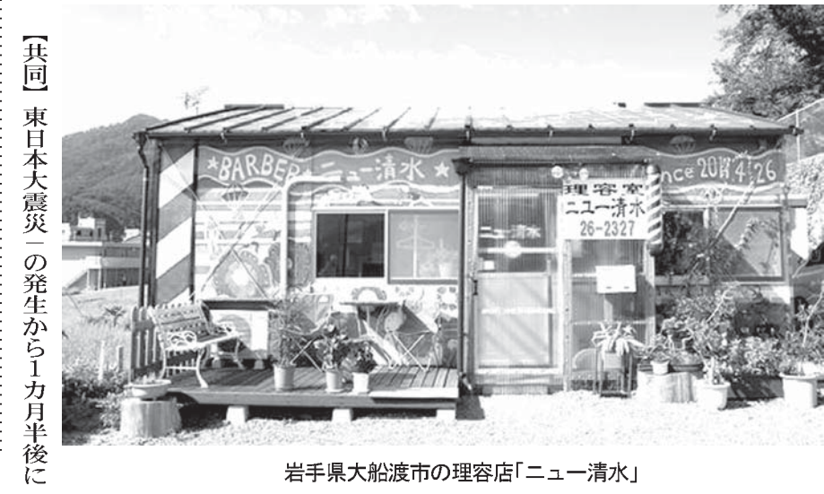
岩手県大船渡市の理容店「ニュー清水」

パラグアイの2015年度の失業率は7.2%で、2016年度は8.3%まで増大した。これはラ米諸国中、ブラジル、コロンビアとアルゼンチンに次ぐパラグアイの第4位の失業率であり、余り偉そうな事もない。国際労働機関・ILOの同報告書は、パラグアイの失業問題は特に女性労働者に厳しく反映している。この事態は、青少年が将来適切な良い就職を目指して日増しにレベルの高い勉学に勤む傾向にあるが、これに相応した公明な雇用創出政策を各当局が緊急に且つ適切に施さない限り、その改善は不可能な事を示すものである」と、国際労働機関・ILOは警告する。