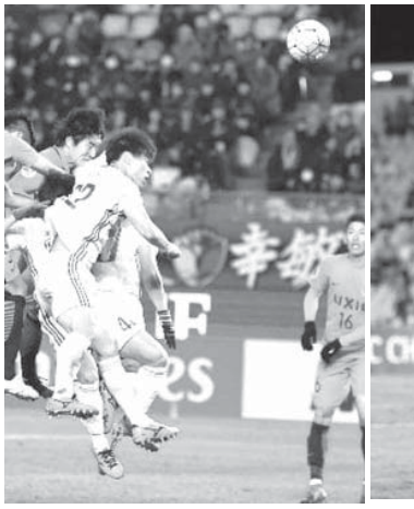
浦和が鹿島を破る

浦和は後半、興梠が先制ゴール。その後は李、横野らが加勢した。鹿島は0-0で迎えた後半に金崎が均衡を破り、鈴木が追加点を奪った。F組の上海上港(中国)はF組C(ソウル、韓国)に1-0で勝ち、E組のプリズベン(オーストラリア)は0-0で引き分けた。22日はG組の川崎が水原(韓国)と、H組のG大阪がアデレード(オーストラリア)と顔を合わせる。1次リーグは32チームが東西で4組ずつに分かれて行われ、各組上位2チームが決勝トーナメントに進む。