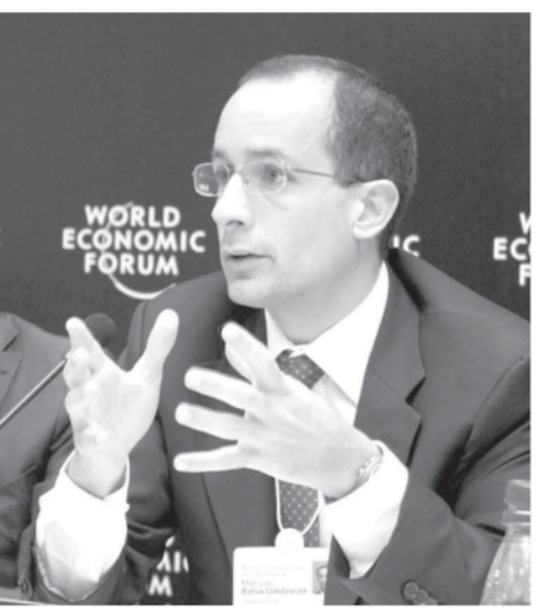
華々しかった頃のマルセロ・オデブレイト被告