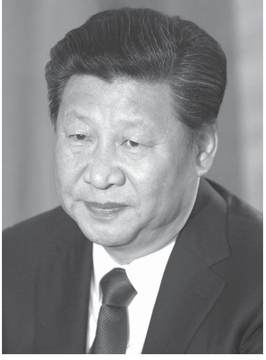
習近平中国主席

「対米貿易黒字」で批判されるドイツ。 「EUはアメリカに打撃を与えるために創設されたんじゃないか？」とライバル視し、「EUがばらばらになろうが、団結しよう