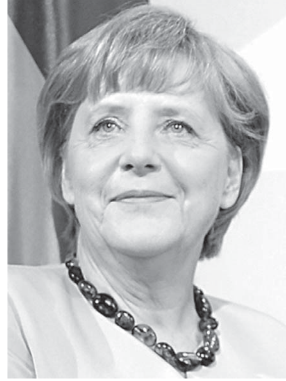
アンゲラ・メルケル独首相

この大事件は、独仏を中心とする西欧にとって大きな意味があった。 「反EU」なのでしょ 「EUは部分的に貿易で米国に打撃を与えるために創設されたんじゃないのか？」とライバル視し、「EUがばらばらになろうが、団結しよう