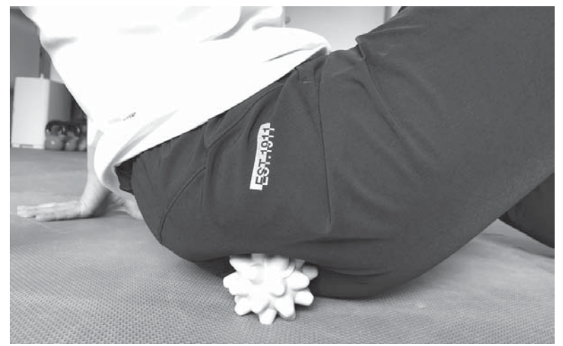
仙骨をほぐすマッサージの様子

筋肉の機能が衰えます。つまずきやすくなったり、深くしゃがめなくなったりするのは、スネの筋肉が硬くなっているサインです。 スネの筋肉の機能は、足関節とひざ関節の機能だけでなく、股関節の可動性にも大きな影響を与えます。仰向けで寝ると腰が反って痛みが出る場合は、スネの筋肉をほぐすと改善されるはずです。