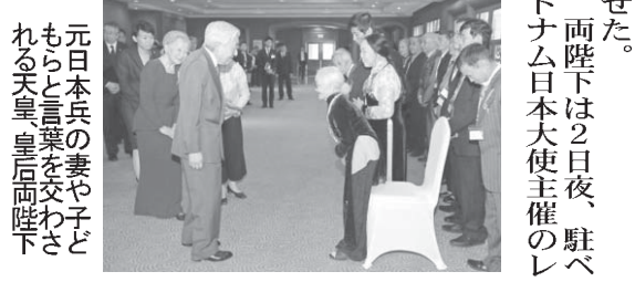
元日本兵の妻や子どもらと天皇皇后陛下

「EUはドイツの目的のための道具」ところを 「EUはドイツの目的のための道具」ところを