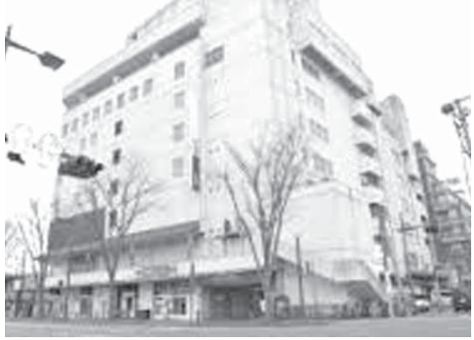
土木建築会社「大開工業」

【共同】環境省は2日、福島県警環境省の専門官を逮捕した。福島県警によると、福島県警は2日、福島県警環境省の専門官を逮捕した。福島県警によると、福島県警は2日、福島県警環境省の専門官を逮捕した。