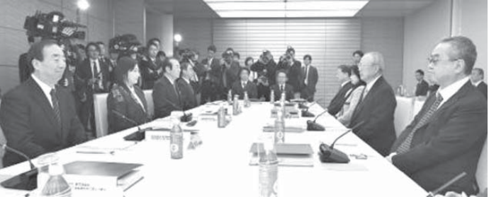
天皇陛下の退位を巡り、各党派の代表者を集めた全体会議

この日の会議は①昨年8月の陛下によるお言葉の受け止め②象徴天皇制に関する基本的考え方③皇位継承の安定化④退位の考え方⑤が議題となった。会議は3日も開催する予定だ。 民進党は2日の会議で、皇室活動の維持のため「女性宮家」創設などへ道筋をつける必要があるとして、国会に議論の場を設けるよう提案した。野田佳彦幹事長は今年の次期臨時国会から来年の通常国会で結論を得るべきだと訴えた。