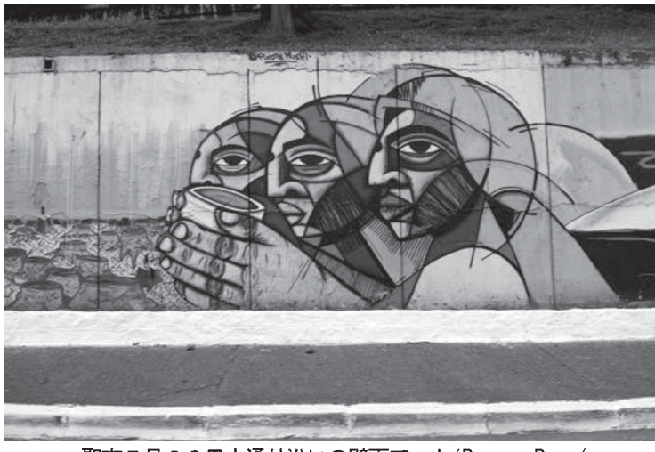
聖市5月23日大通り沿いの壁画アート

聖市に対し、「同市歴史、文化、環境遺産保護審議会の許可なく市内の落書きを消すことを禁ずる」としていた仮処分が、聖市高等裁判所によって棄却された。