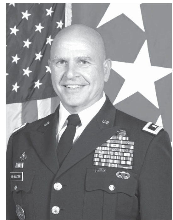
ハーバート・マクマスター中將(2013年)

「軍事における革命」(RMA)として知られる理論の信奉者たちは、1991年の湾岸戦争におけるアメリカ主導の多国軍による一方的な勝利をあげて、軍事技術のさらなる進歩はいかなる敵に対しても圧倒的な状態を維持して 「軍事における革命」(RMA)として知られる理論の信奉者たちは、1991年の湾岸戦争におけるアメリカ主導の多国軍による一方的な勝利をあげて、軍事技術のさらなる進歩はいかなる敵に対しても圧倒的な状態を維持して 「軍事における革命」(RMA)として知られる理論の信奉者たちは、1991年の湾岸戦争におけるアメリカ主導の多国軍による一方的な勝利をあげて、軍事技術のさらなる進歩はいかなる敵に対しても圧倒的な状態を維持して