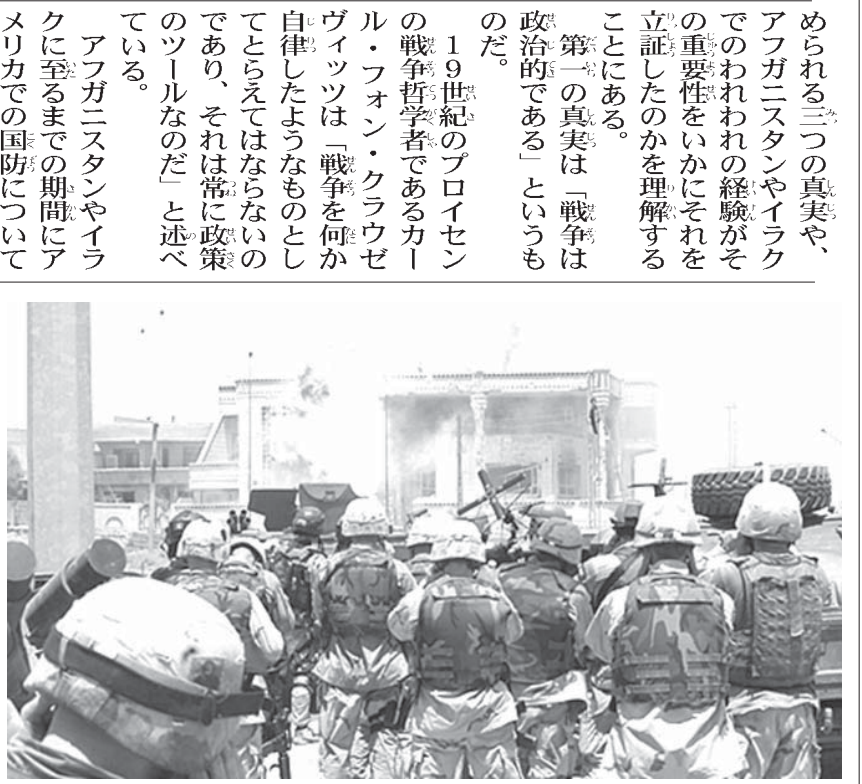
イラク戦争の戦闘の様子

小説家のソール・ペロウは、「幻想への欲求が深い場合、素晴らしい知性が無知のために気づき込まれることもある」と記したことがある。 われわれはイラクとアフガニスタンの戦争から得た教訓を考へる際に、このペロウの言葉を引用しておくべきであろう。 なぜならこの教訓は、将来の軍事計画の際に極めて重要となってくるからだ。 われわれの持つ、過去の経験からの学びの成績は、残念ながら、過去の経験からの学びの成績を、将来の戦争を簡単な ものとして考えたり、過去のものとは根本的に違うものだという希望的観測の思考の結果として、単純に適用したり、それを全部無視したりするからだ。 われわれは2001年9月11日のテロ攻撃以前にそのような考えにふけており、多くの人が「離れて安全な距離から敵のターゲットに対して精密攻撃を行える能力を持ったテクノロジー面で優位にある小規模の米軍の部隊は、短期的に勝利を得ることができる」という単なる思いつきを受け入れていたのだ。 新しいテクノロジーが戦争の新时代的幕開けとなし、われわれがアフガニスタンやイラクで直面