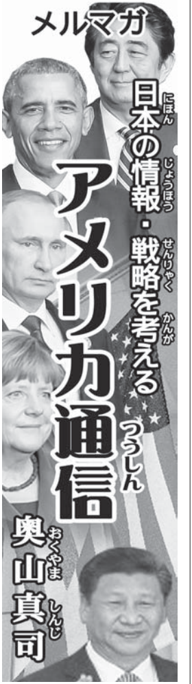
メルマガ 日本の情報・戦略を考える アメリカ通信 奥山真司 2月25日版