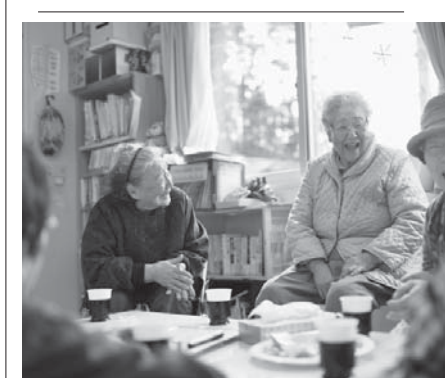
笑顔で交歓する被災者やボランティア。岩手県大槌町赤浜地区の仮設住宅にある談話室で、震災前からの顔見知りや地域情報交換の場として集まる。来月より3月まで、多くの仮設住宅が完成する。仮設住宅の集約を進める。仮設住宅の集約を進める。仮設住宅の集約を進める。

【共同】東日本大震災は11日、発生から6年を迎える。10日現在の警察庁のまとめでは、沿岸部に押し寄せた巨大津波などによる死者は1万5893人で、依然として25553人が行方不明。政府主催の追悼式のほか、全国各地で慰霊行事があり、午後2時46分の発生時刻に合わせて、犠牲者へ鎮魂の祈りがさげられる。行方不明者の発見は少なくなってきたというものの、昨年12月には福島県で遺骨が見つかり、津波に巻き込まれた女児(当時7)と判明した。被害が大きかった岩手、宮城、福島の3県警などは、手掛かりを求めて11日も沿岸部を捜索する。被災者の住まいの再建は、自治体によって進み具合の差が大きく、全ての人々が落ち着いている生活を取り戻すにはまだ時間がかかりそうだ。復興庁によると、3県の災害公営住宅は1月末現在、計画する約3万戸のうち2割超が完成。高台などの宅地造成は4割が終わっていない。未曾有の大災害は、東京電力福島第1原発事故を引き起こした。福島県飯館村など4町村では今春、放射線量が高い帰還困難区域を除いて避難指示が解除され、本格的な