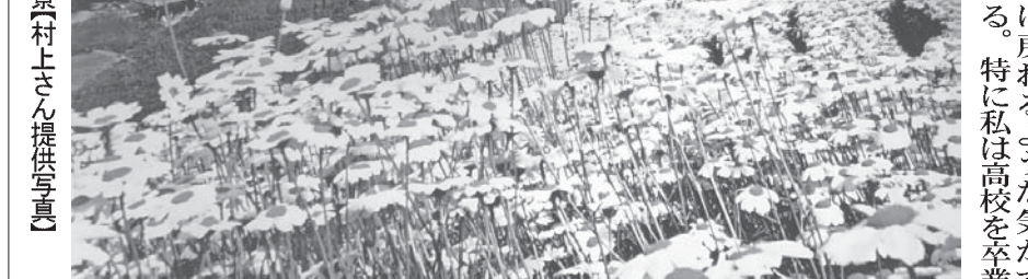
除虫菊と段々畑の風景