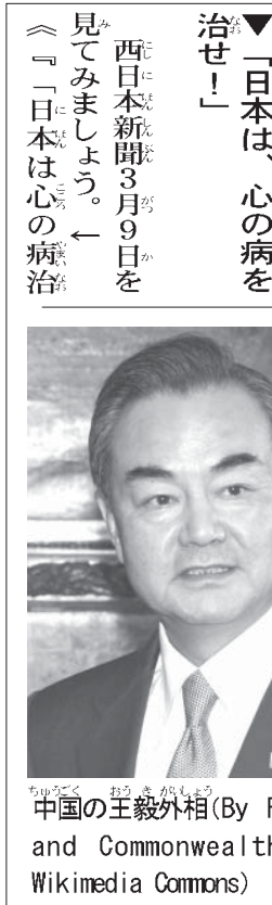
中国の王毅外相

中国は、「日本には尖閣だけなく、沖縄の領有権もない」という間違った情報を拡散している。どう考えても「日本の脅威」です。