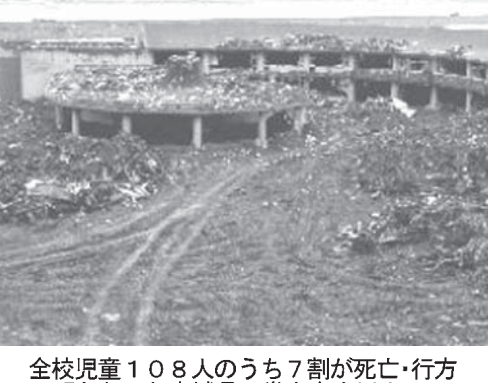
全校児童108人のうち7割が死亡・行方不明となった宮城県石巻市立大川小

【共同】東日本大震災の津波で、学校や企業にいた家族を亡くし、裁判を起こした遺族がいる。あの日から6年。「二度と私たちと同じ思いをする人を出さないでほしい」と、今も変わらず訴え続ける。仙台市でこのほど開かれた集まりで、遺族の切実な言葉に聞き入った。