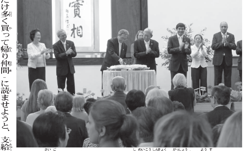
最後にケーキカットをして、使命行進曲を合唱する様子