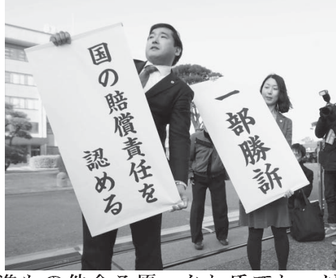
福島第1原発事故避難者の集団訴訟で国と東電電力の賠償責任が認められ前橋地裁前で垂れ幕を掲げた原告側弁護士ら117日午後

【共同】東京電力は2008年に巨大津波を予見していた。福島第1原発事故の責任追及で最大の焦点だった予見可能性について、前橋地裁が画期的な判決を言い渡した。甚大な被害をもたらす原発事故の特性を踏まえ、最大限の安全対策が必要だったとする司法判断。全国の避難者訴訟や強制起訴された旧経営陣らの刑事裁判の行方に影響する可能性もある。主張を一蹴された東電や国の衝撃は計り知れない。