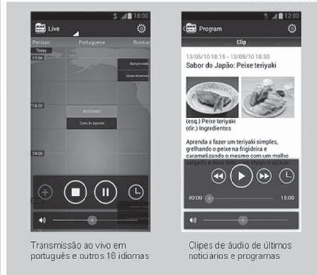
Transmissão ao vivo em português e outros 16 idiomas