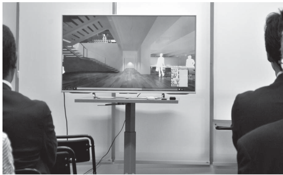
参加者向けに鑑賞されたイメージ映像(内部そのものは来月28日以降に解禁)