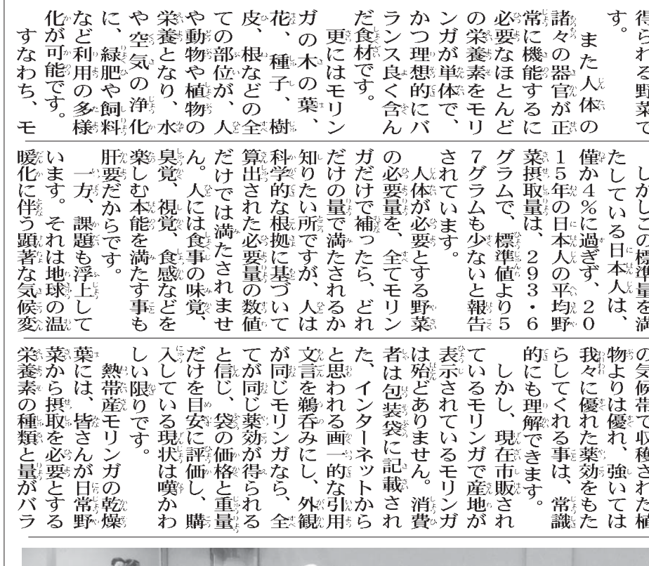
第2回モリンガの集いに参加した約70人のみなさん