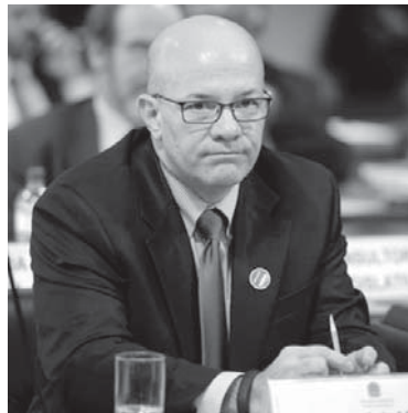
連邦検察庁のマルセロ・ムスコグリアット副長官

厳格に判断するならば、ラヴァ・ジャット作戦の制限を与えられたい。その結果、むしろビジネ環境において、法的安定性が脅かされる状況になっている。例えば、オデブレヒトのケースでは、同社が国立経済社会開発銀行(BNDDES)から融資の再開を認められるには、連邦検察庁との課徴金減免制度適用の合意だけでは不十分で、連邦総合内部統制局(CGU)に同制度での合意の及ぶ法的範囲の判断を仰いでいる。