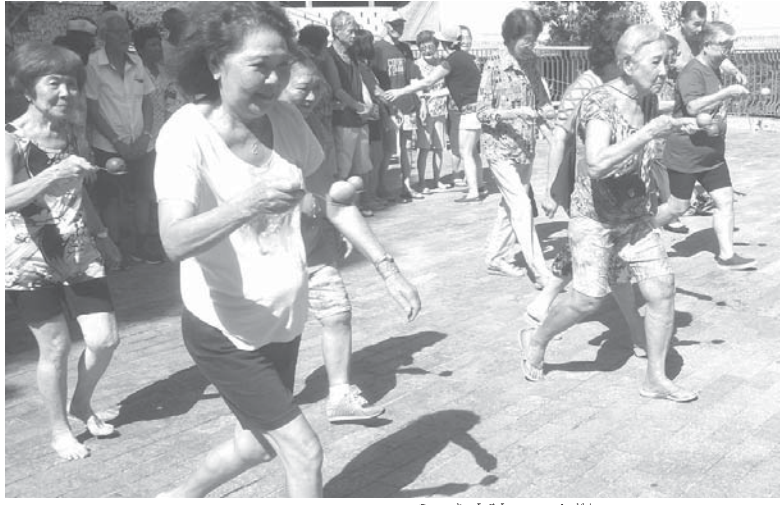
スプーンにレモンを乗せ競争する婦人ら