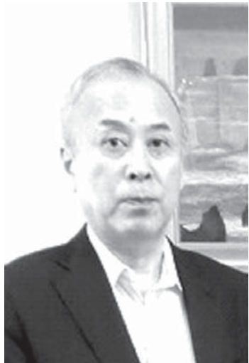
在ベレン日本国領事事務所小林雅彦所長