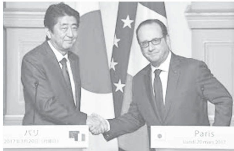
共同記者発表を終え、握手するフランスのオランダ大統領(右)と安倍首相

【パリ、ブリュッセル共同】安倍晋三首相はフランスの大統領府で20日夜(日本時間21日未明)、オランダ大統領と会談し、民生用原子力の研究開発で協力を進める方針で一致した。高速炉実用化に向けた協力加速を柱に据える。会談後の共同記者発表で首相は、防衛分野で海上自衛隊と仏米英の計4カ国が合同演習を初めて実施すると明かし、「意義深い」と歓迎した。米領グアムなどアジア太平洋地域で行う。海洋進出を強める中国が念頭にありとみられる。