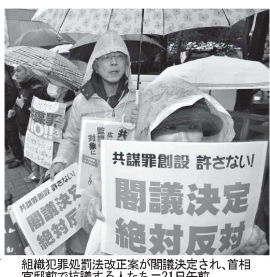
組織犯罪処罰法改正案が閣議決定され、首相官邸前で抗議する人たちは21日午前