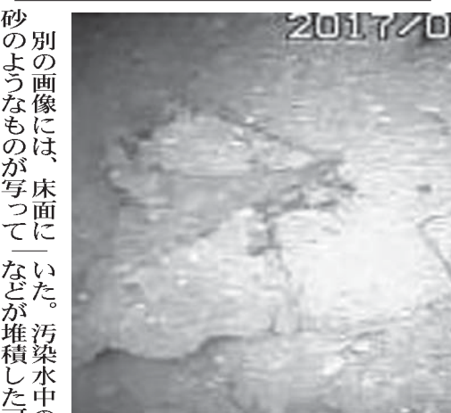
福島第1原発1号機の原子炉格納容器内部で、自走式ロボットが撮影した水中の画像。何らかの構造物が溶けて固まったような堆積物が見える

【共同】東京電力は21日、福島第1原発1号機の原子炉格納容器内部に自走式ロボットを投入した。20日までの調査の結果、格納容器底部に最大11シーベルトの高放射線量を測定したと発表した。水中で撮影した画像には、何らかの構造物が溶けて固まったような堆積物が写っていた。溶け落ちた核燃料が、格納容器の床面から高さ30センチの水の中