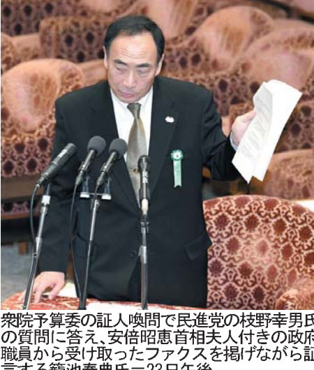
首相安倍晋三が記者会見で、籠池氏に謝罪する。23日午後

【共同】森友学園の籠池泰典氏が証人喚問で安倍昭恵首相夫人から100万円の寄付を受け取った際のやりとりを詳細に語り、安倍政権に激震を与えた。夫人担当の政府職員が財務省に問い合わせたことも証言。政府は「爆弾発言」を否定しているが、幕引きを狙った政権の思惑と疑念は拡大している。