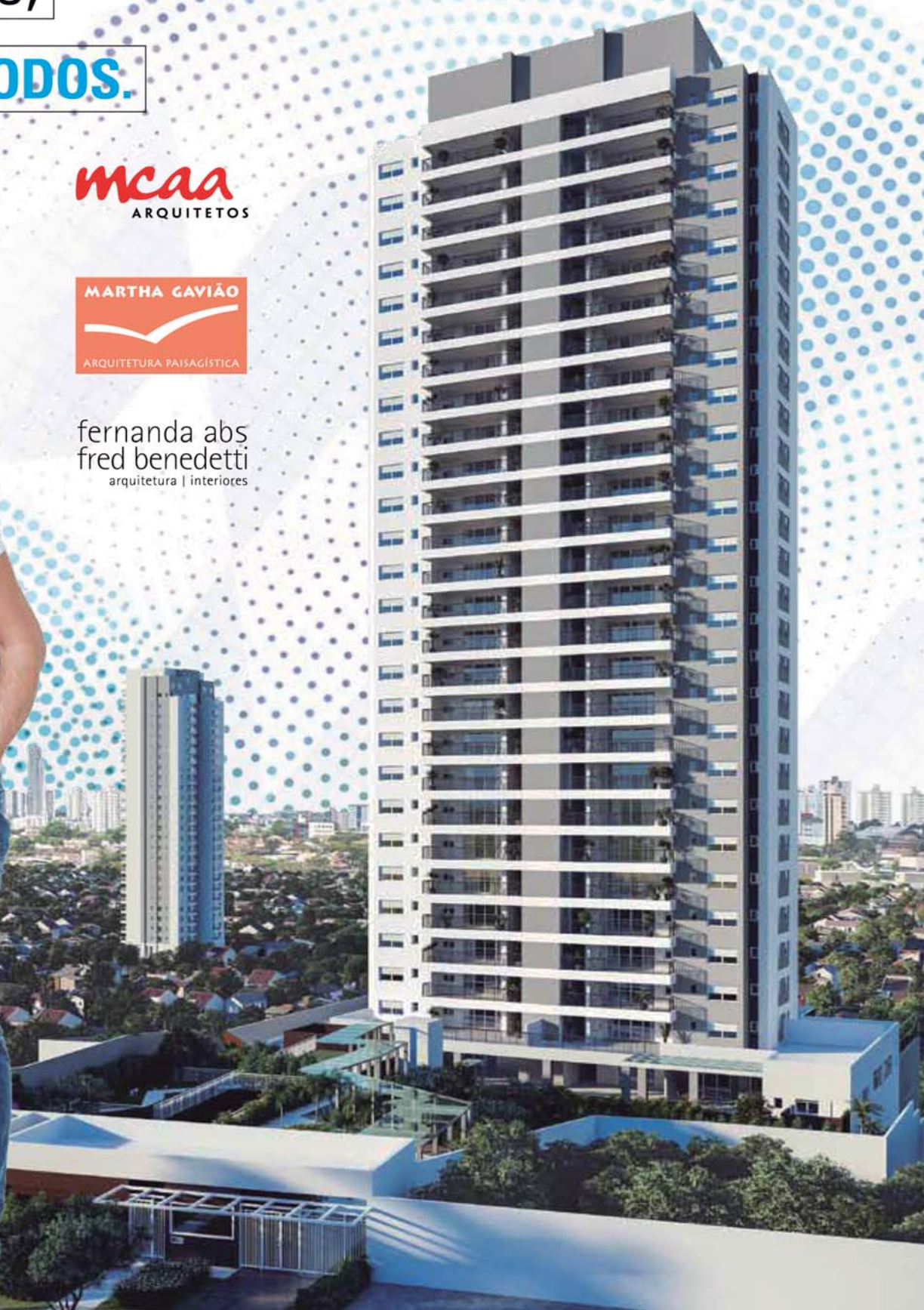
Perspectiva ilustrada da Fachada

MORE EM UMA RUA RESIDENCIAL TRANQUILA ENTRE ACLIMAÇÃO, VILA MARIANA E CAMBUCI, PRÓXIMO A: