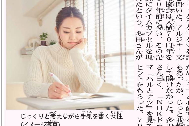
じっくりと考えながら手紙を書く女性 (イメージ写真)

【北京 博覧共闘】中国が主導する国際金融機関、アジアインフラ投資銀行（AIB）が新たに申請承認したのは香港、カナダのほかベルギーやハンガリー、アイルランド、ペルー、エチオピアなど。今後、国内手続きを経て正式に加盟する。