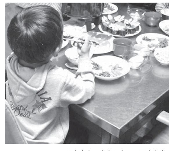
子ども食堂で食事を楽しむ困窮家庭の子どもたち