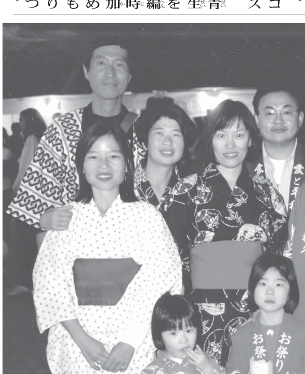
同僚(右後ろの男子)や日系二世の友人らと、ブラジリアの本願寺の盆踊りに法被姿で参加。右端の女の子がその後、亡くなった(撮影2000年)

【共同】政府の働き方改革で政府と連合、経団連がまとめた残業時間上限規制案を巡り、休日労働を上限に上乗せすれば、年間720時間の上限を超えて960時間まで働くことが可能であることが23日分かった。