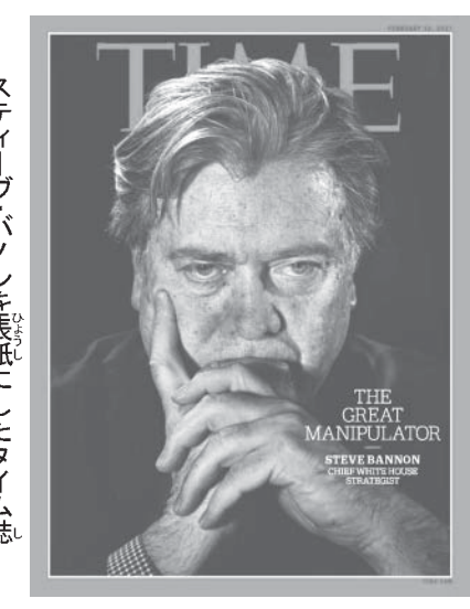
ステイブ・パノンを表紙にしたタイム誌

今月のメディアの見出 しには以下のような警戒 心を呼び起すものが並 んだ。 ●ステイブ・パノンの 暗い歴史観への傾倒は警 戒すべきものだ（ヒジネ ス・インサイダー） ●パノンは最後の審判の 到来や戦争の勃発が不可 避だと信じている（ハ フントン・ポスト） ●パノンは第三次世界大 戦の勃発を願っている （ネイション誌） このようなメディアの 報道に共通するのは、ト ランプ大統領の首席戦略 アドバイザーが、彼自身 の世界観に最も影響を与 えた本『フオーブ・ター ニング』の熱心な読者で ある、というのだ。 私はこの本を、ウイリ アム・ストラウス氏と共 に1997年に出版し た。この本がパノンの心 を奪ったという話は事実 である。 彼は2010年に 「ジェネレーション・ゼ ロ」というドキュメンタ リー映画を発表したのだ が、この映画はわれわれ が描いたアメリカ史（そ してほとんどの近代社会 の歴史）についての、4 世代にわたる循環理論を 土台にして構成されたも のであった。 このサイクルには、社